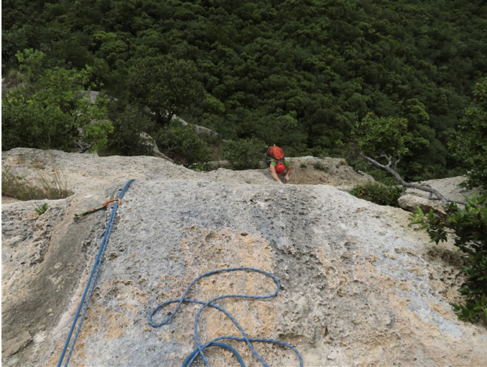
Fine quarta lunghezza