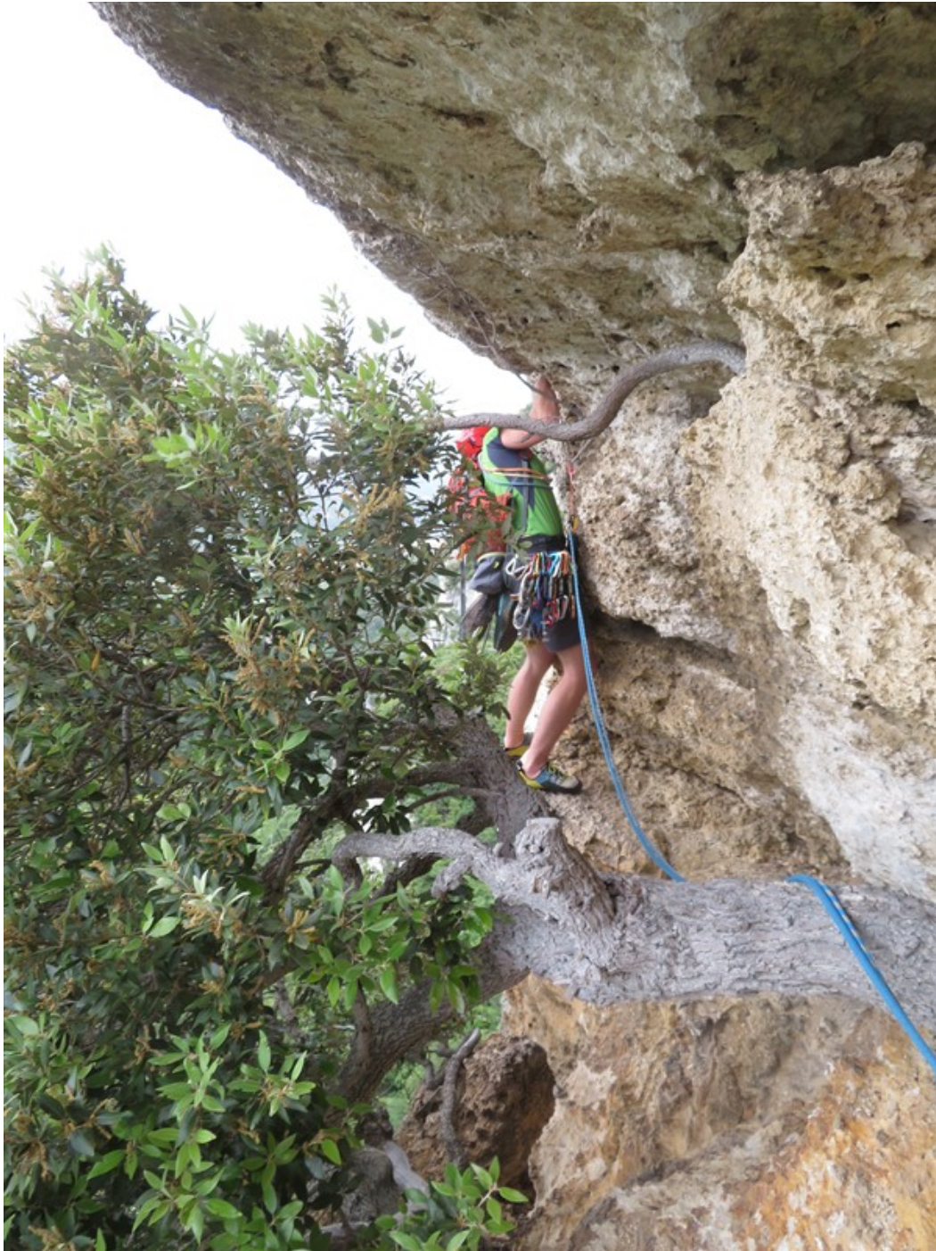
Partenza quinta lunghezza