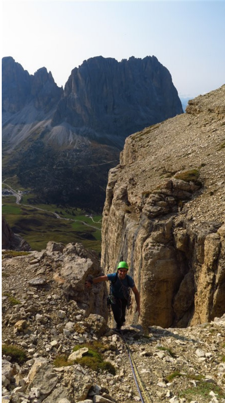
Ottava lunghezza, uscita sulla cengia sommitale