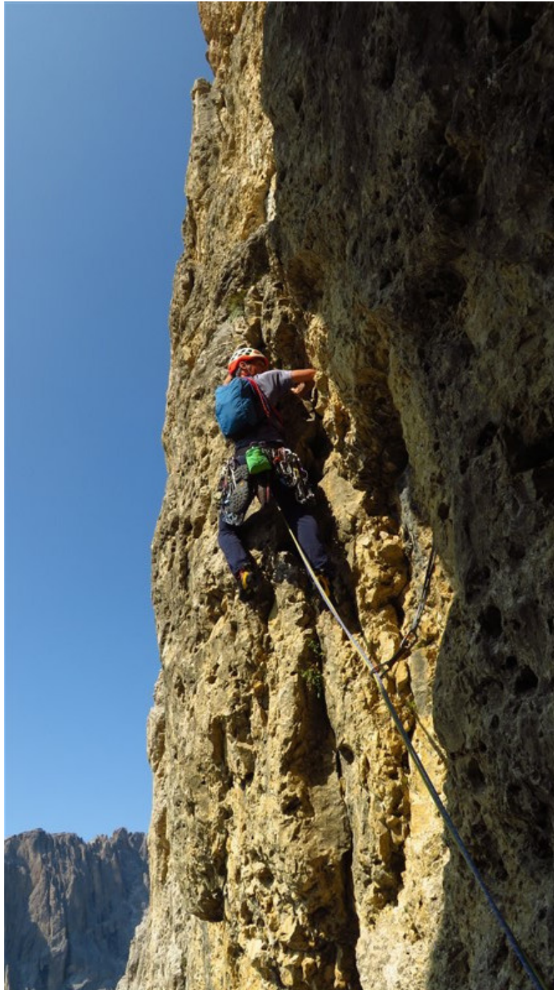
Partenza terza lunghezza