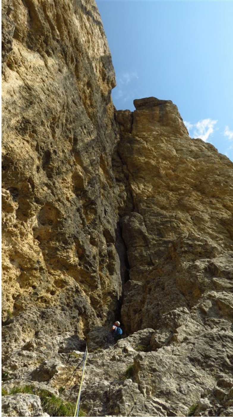
In sosta alla fine della quarta lunghezza, sotto la parte superiore della via