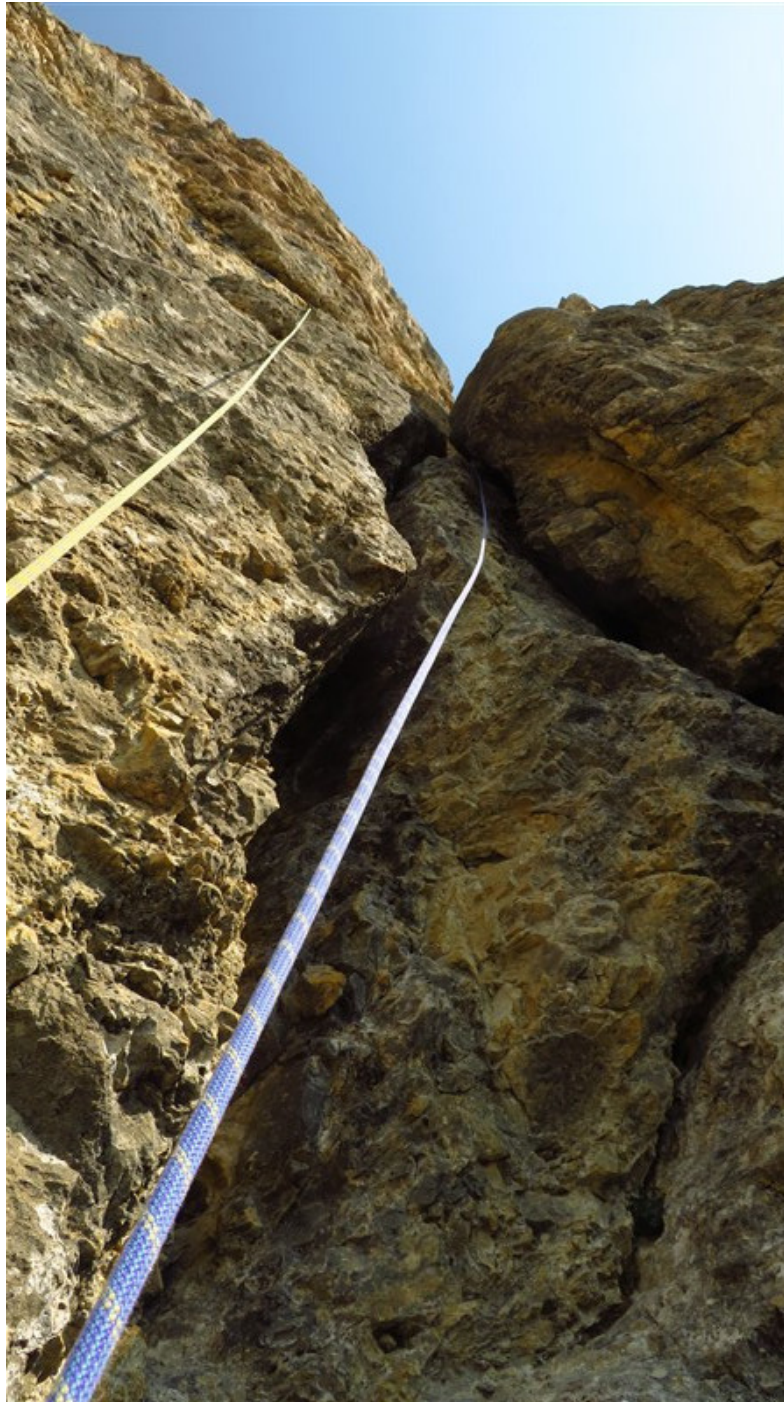
Seconda lunghezza, parte finale