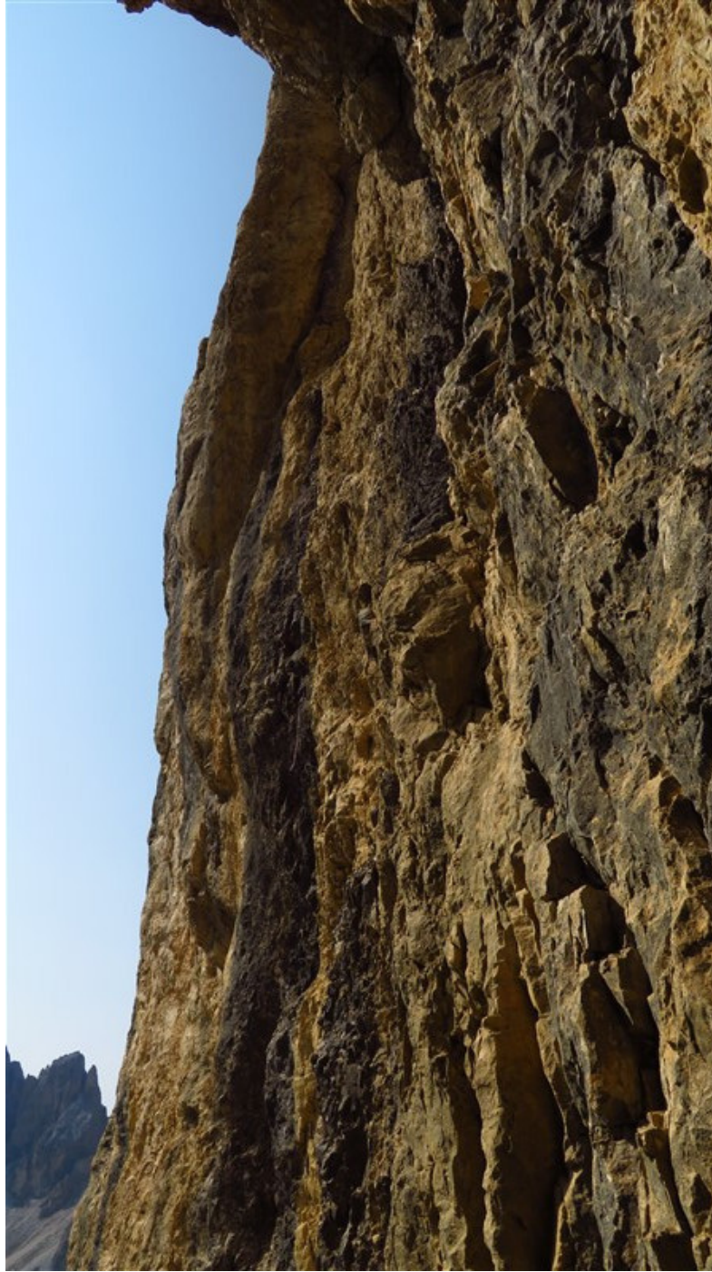
Ottava lunghezza a sinistra, a prendere la fessura nera