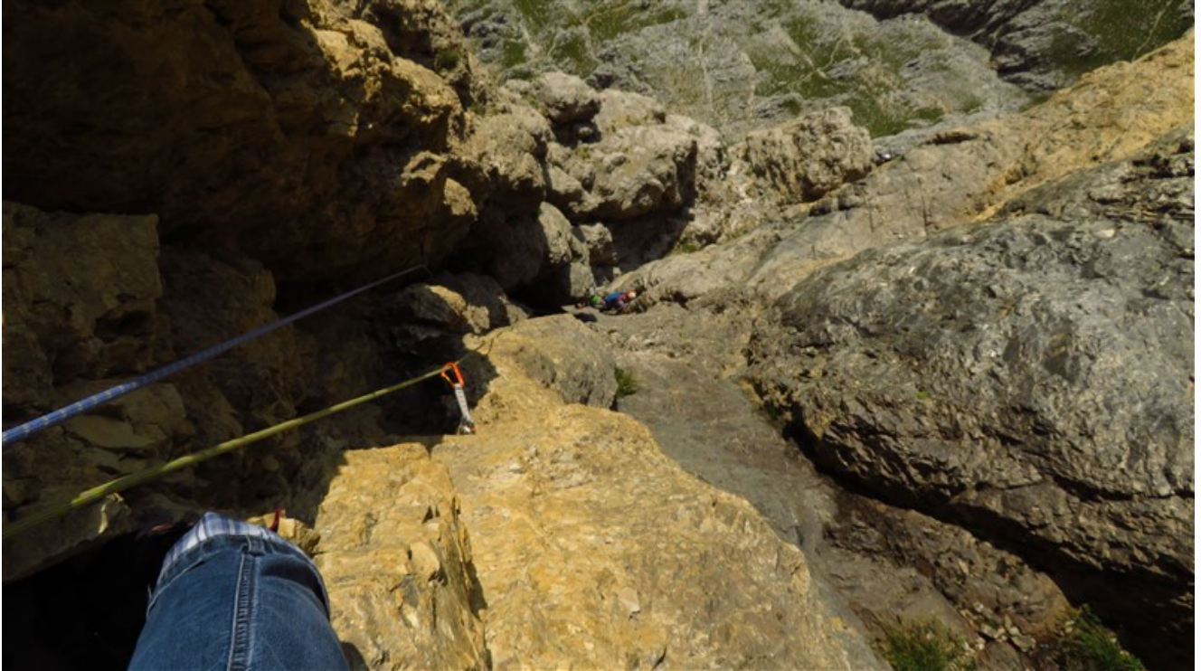
Quinta lunghezza dalla sosta alla fine del tiro