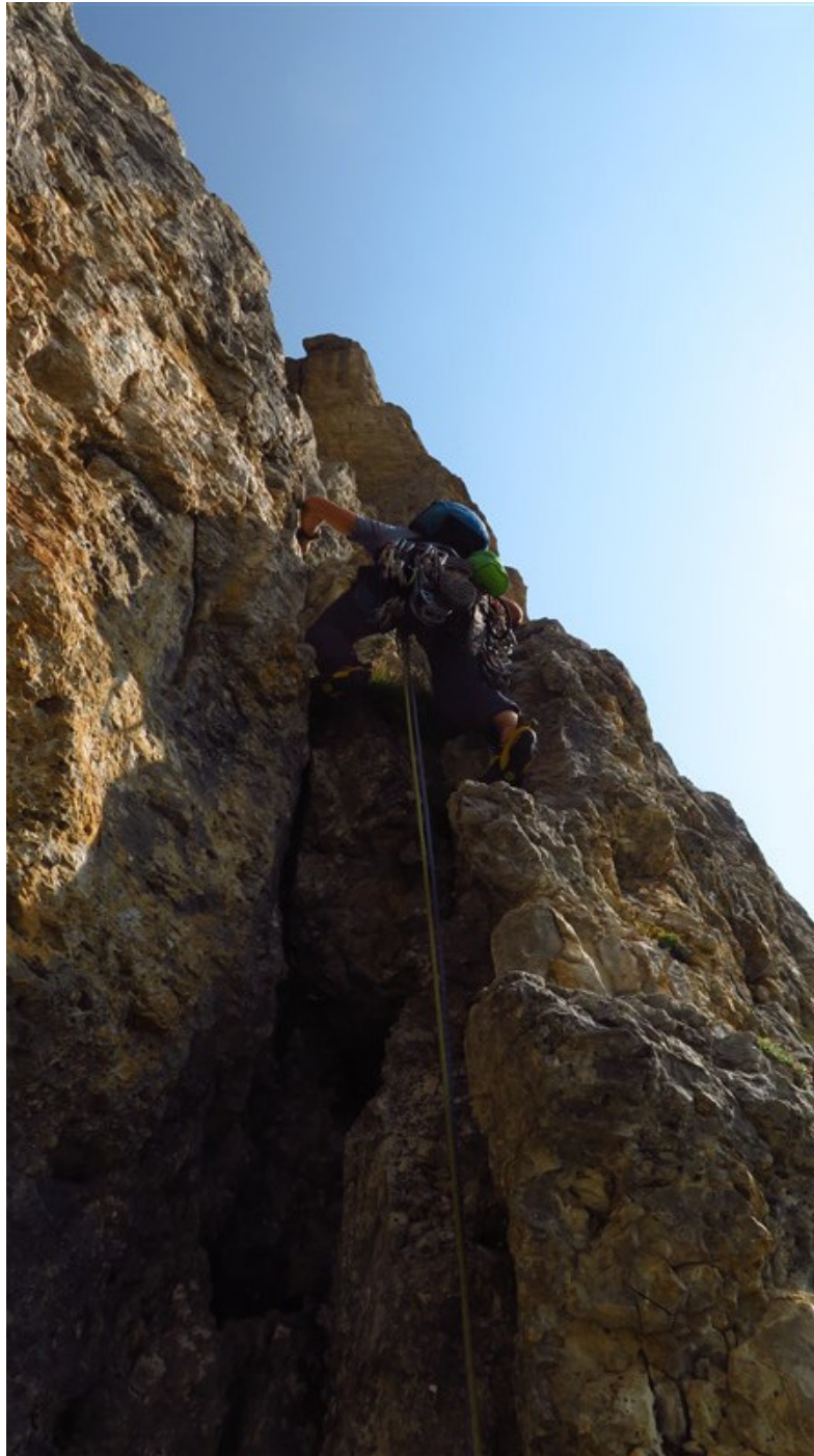
Partenza prima lunghezza