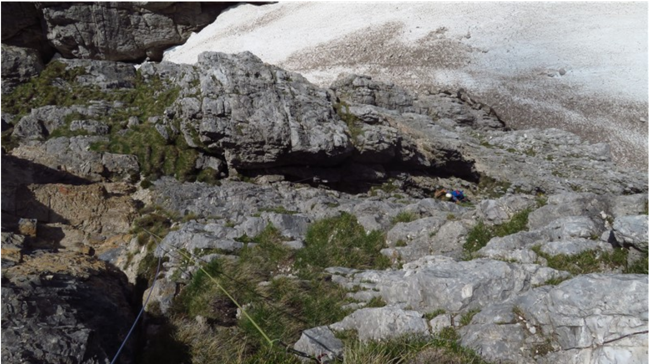
Uscita terza lunghezza