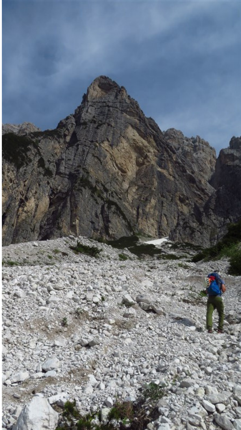
Nel canale di avvicinamento