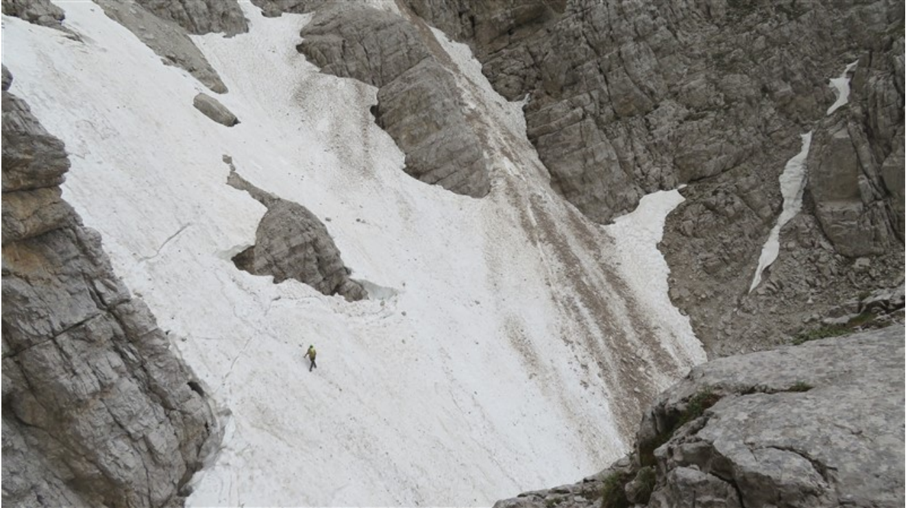
Traversando alla Pala del Bò