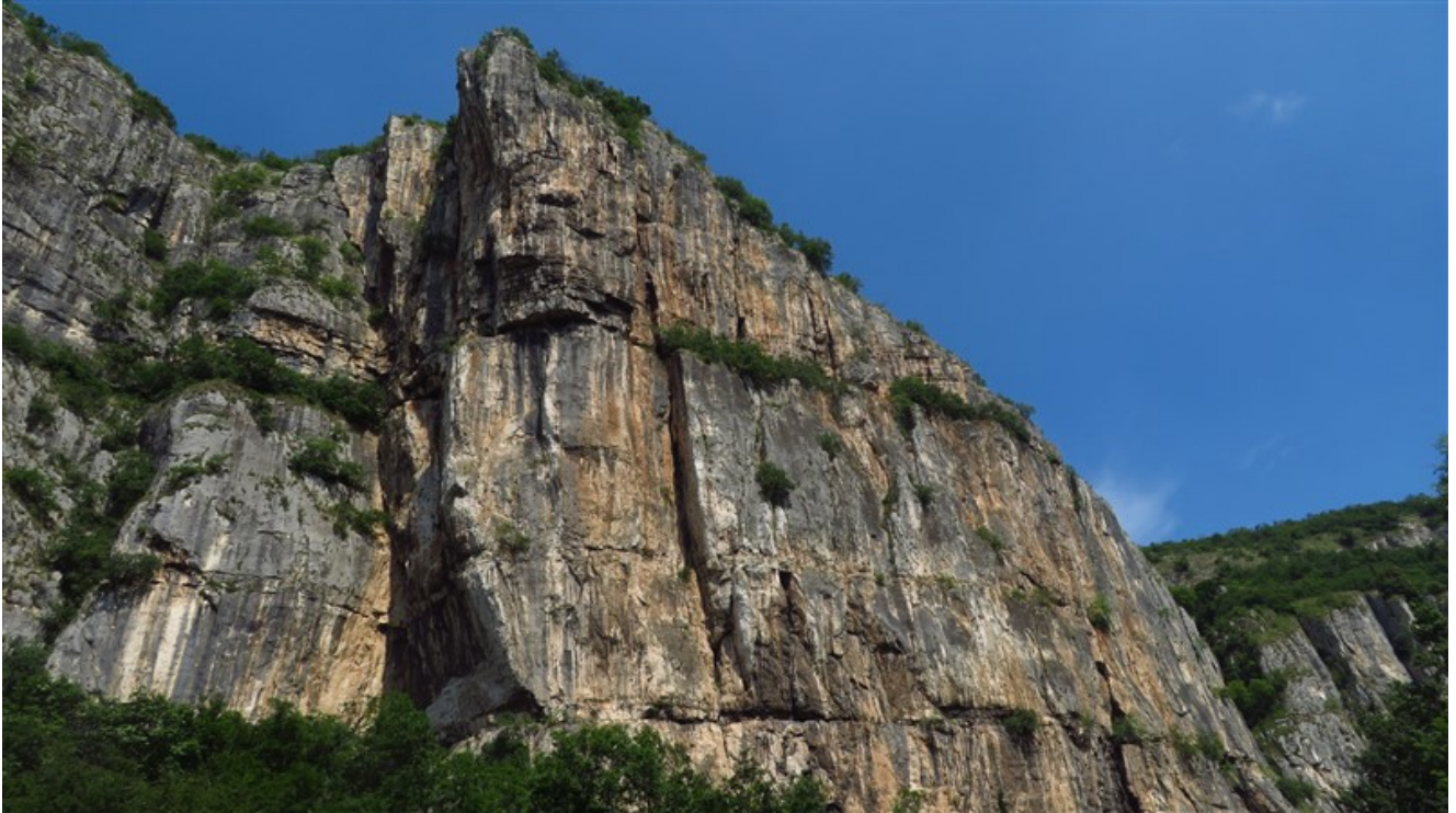
La Prua, Ceraino