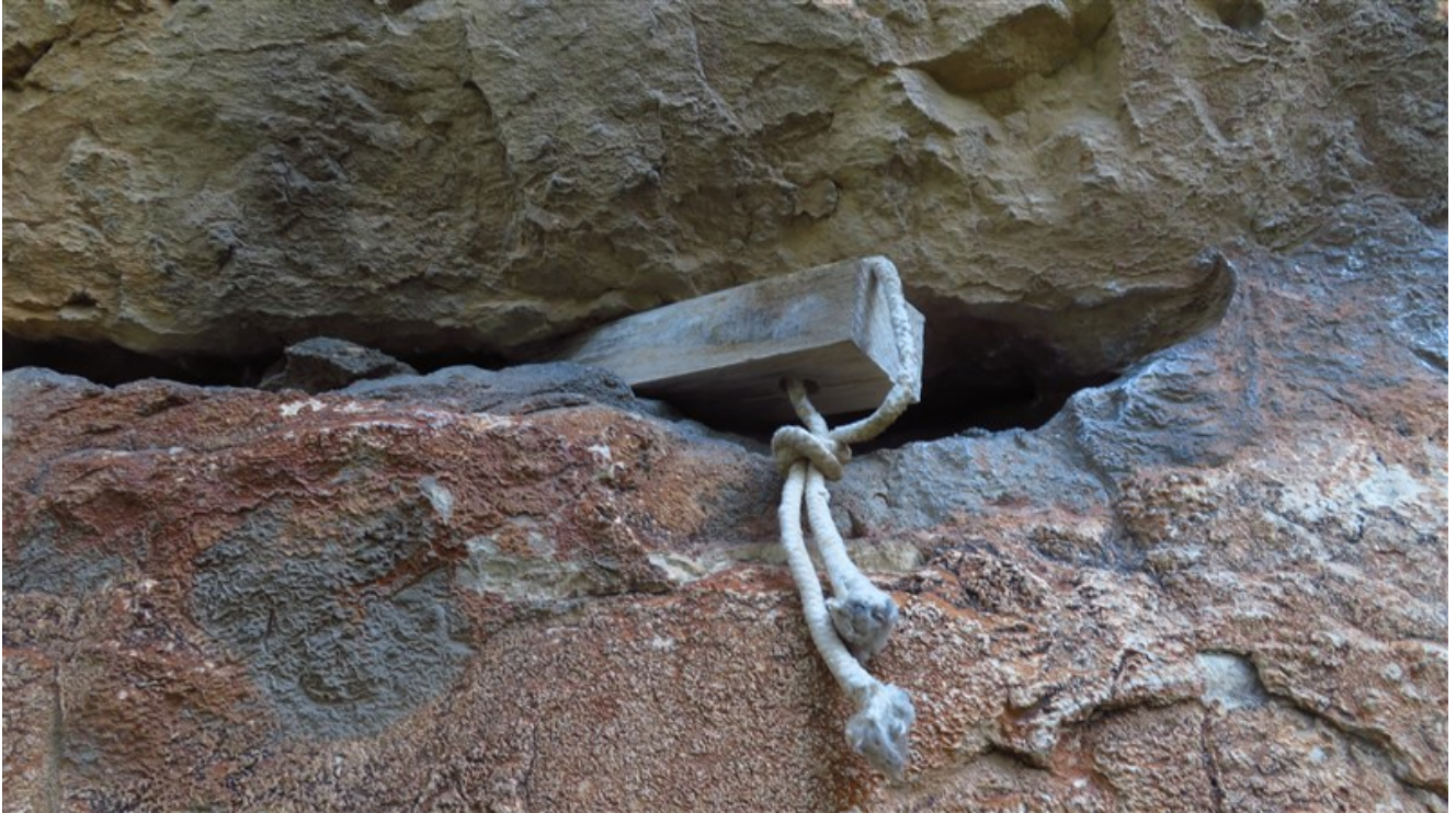
Un vecchio cuneo sulla quinta lunghezza