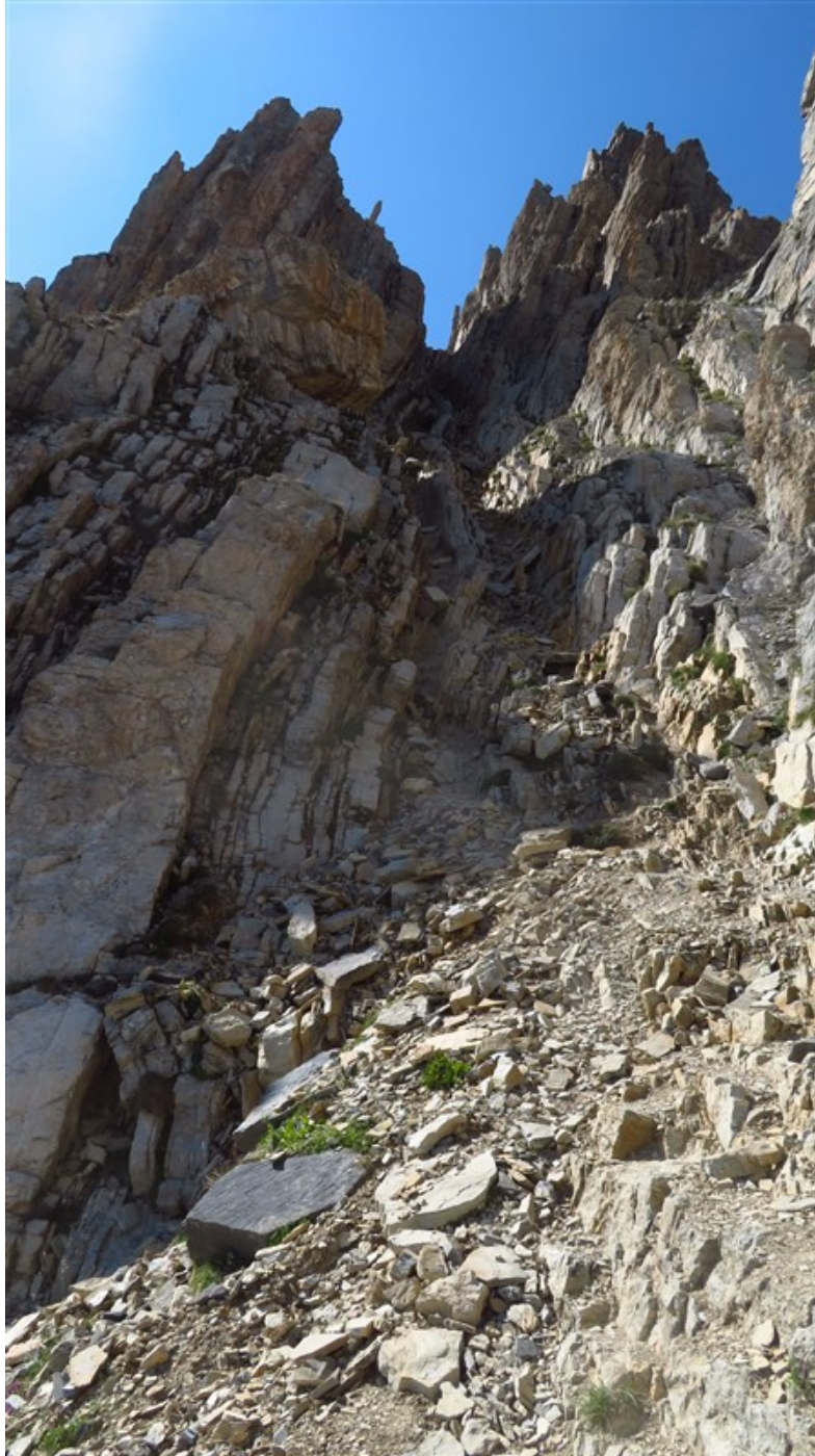
La prima parte del canale di discesa