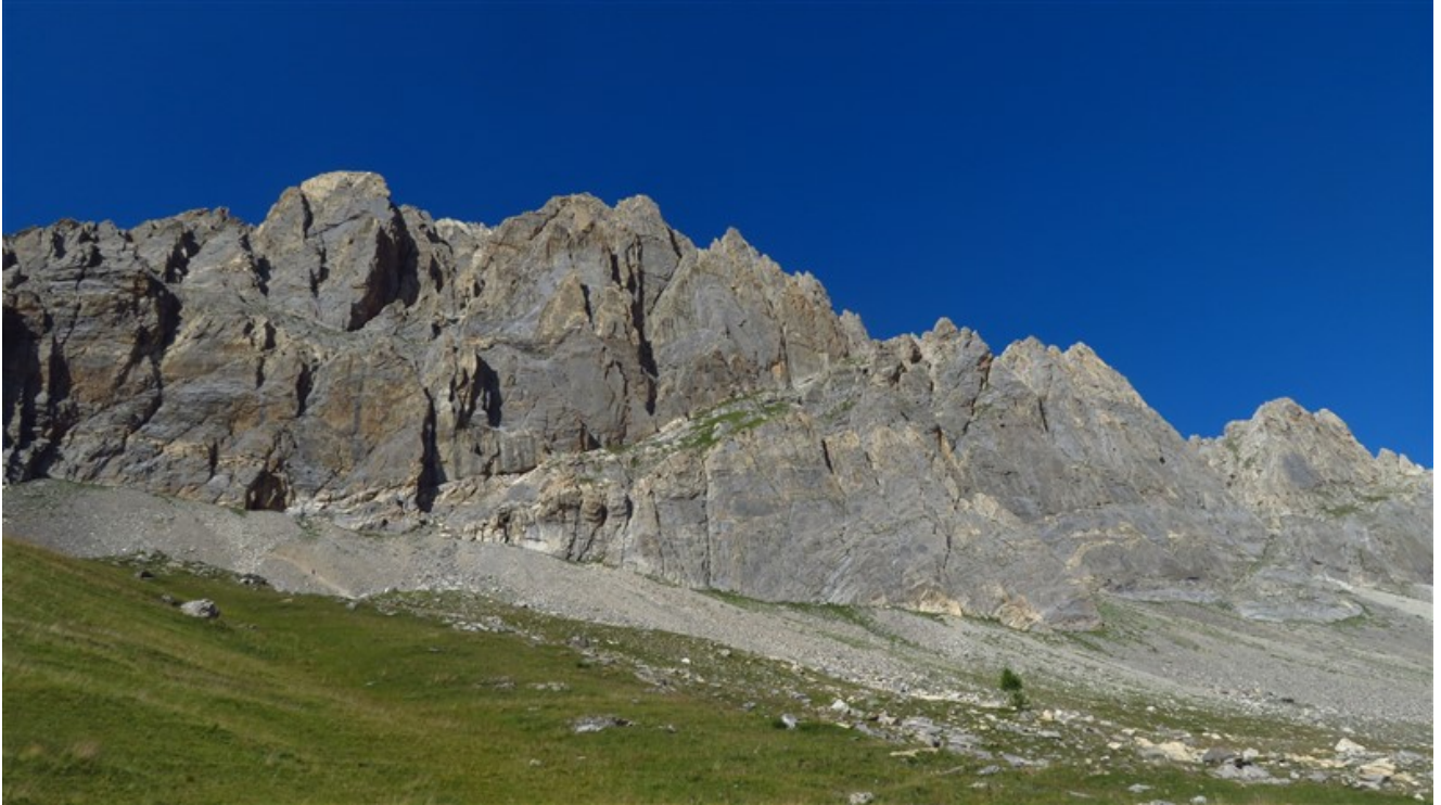
Rocca la Meja, parete sud