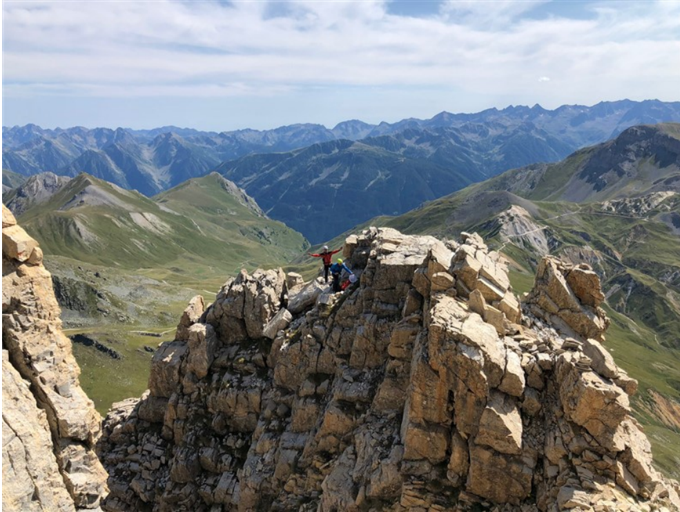
L'anticima dove esce la via