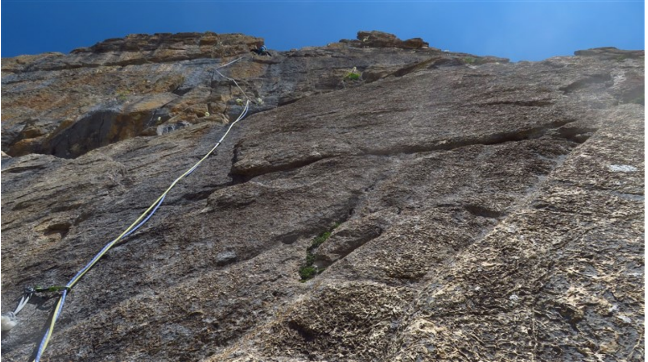
Quinta lunghezza (primo tiro sopra la cengia)