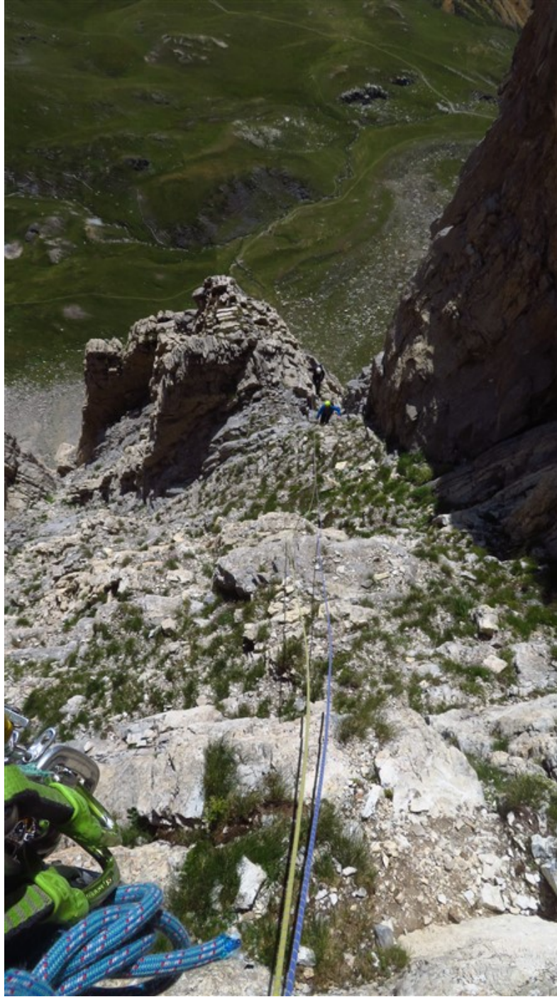
Il canale dove esce l'ottava lunghezza