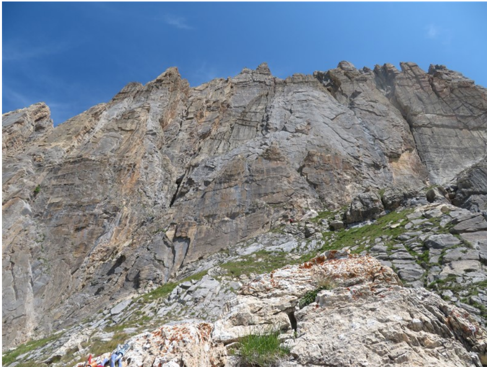
La parete sopra la cengia