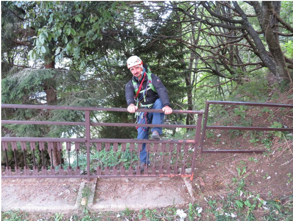
L'avvicinamento inizia da qui...