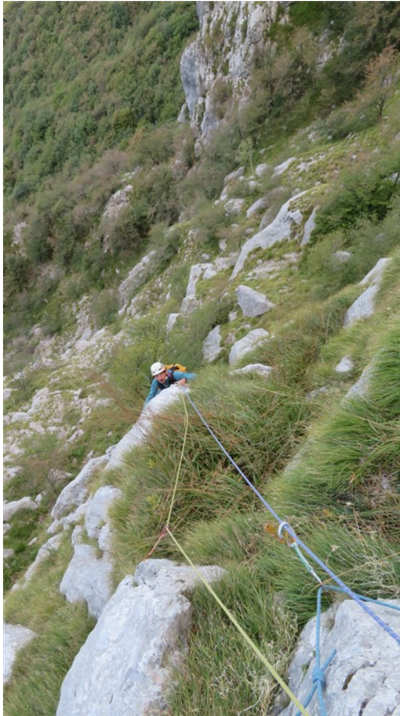
Prima lunghezza, uscita su gradoni erbosi