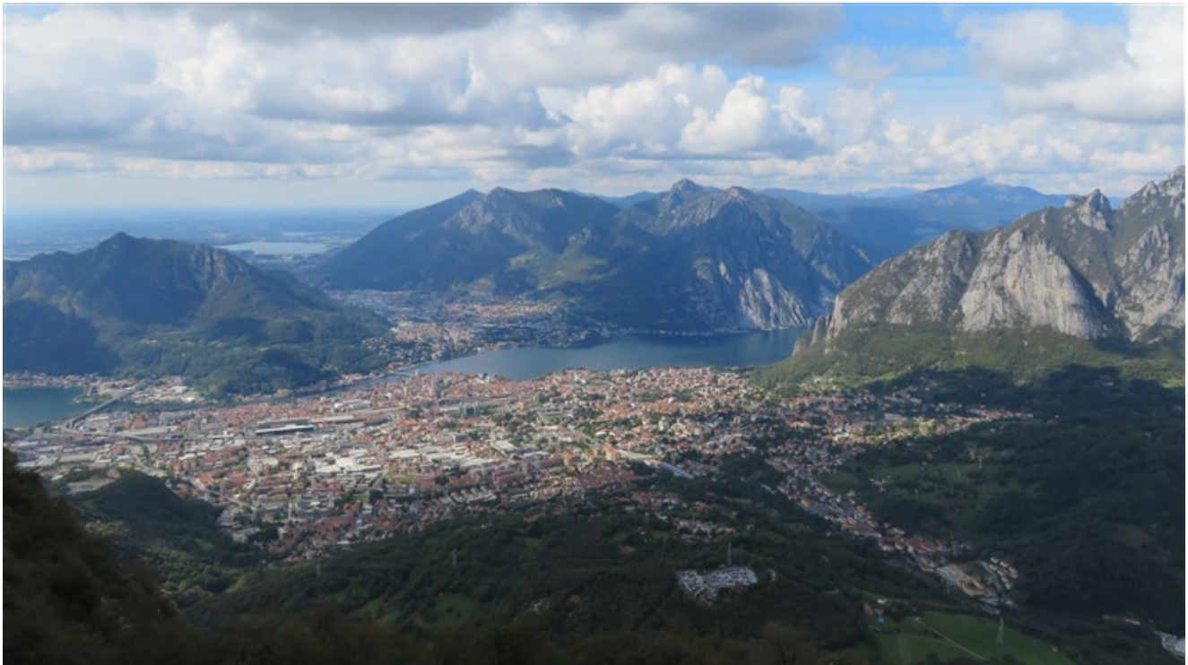
Panorama su Lecco