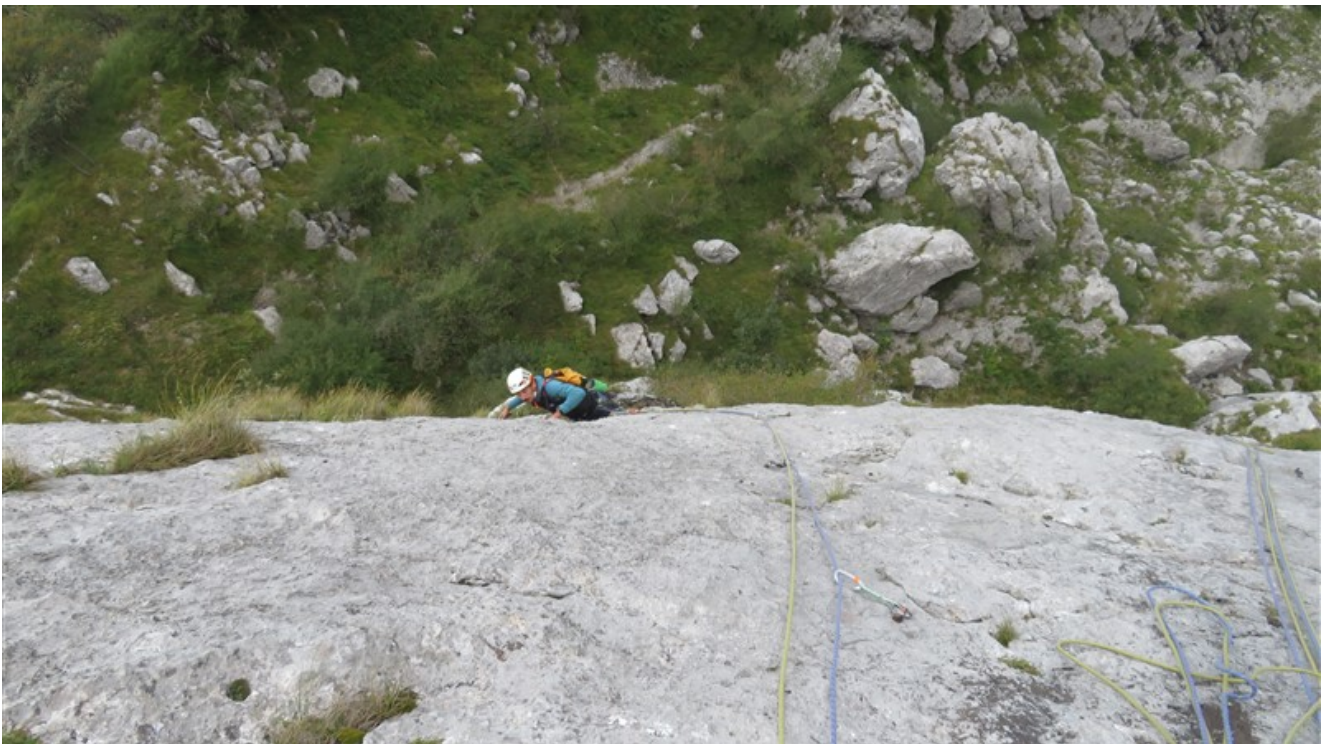
Parte finale terza lunghezza