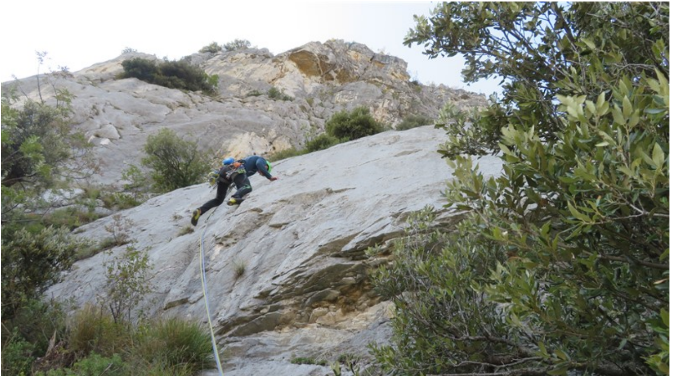
Inizio decima lunghezza