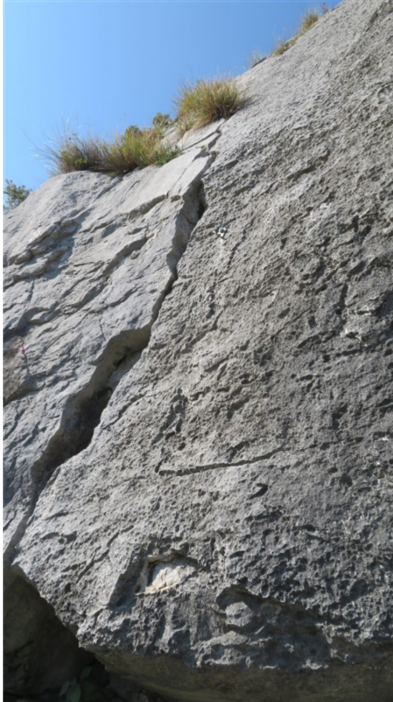
Partenza quinta lunghezza