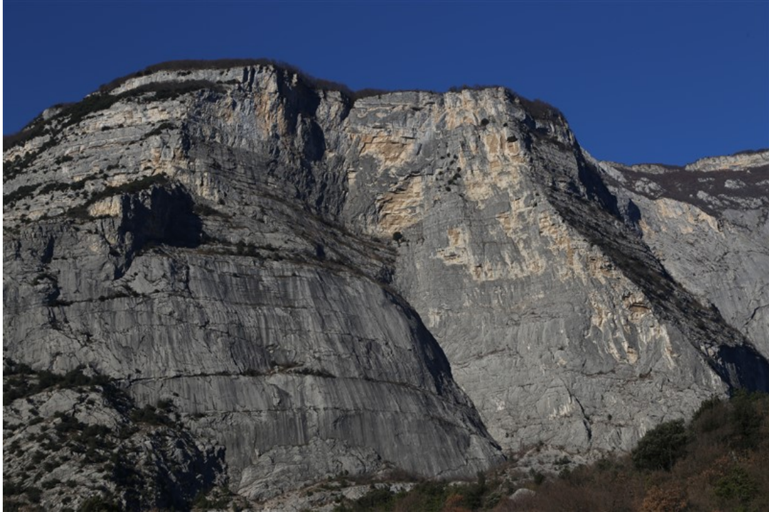
Cima alle Coste