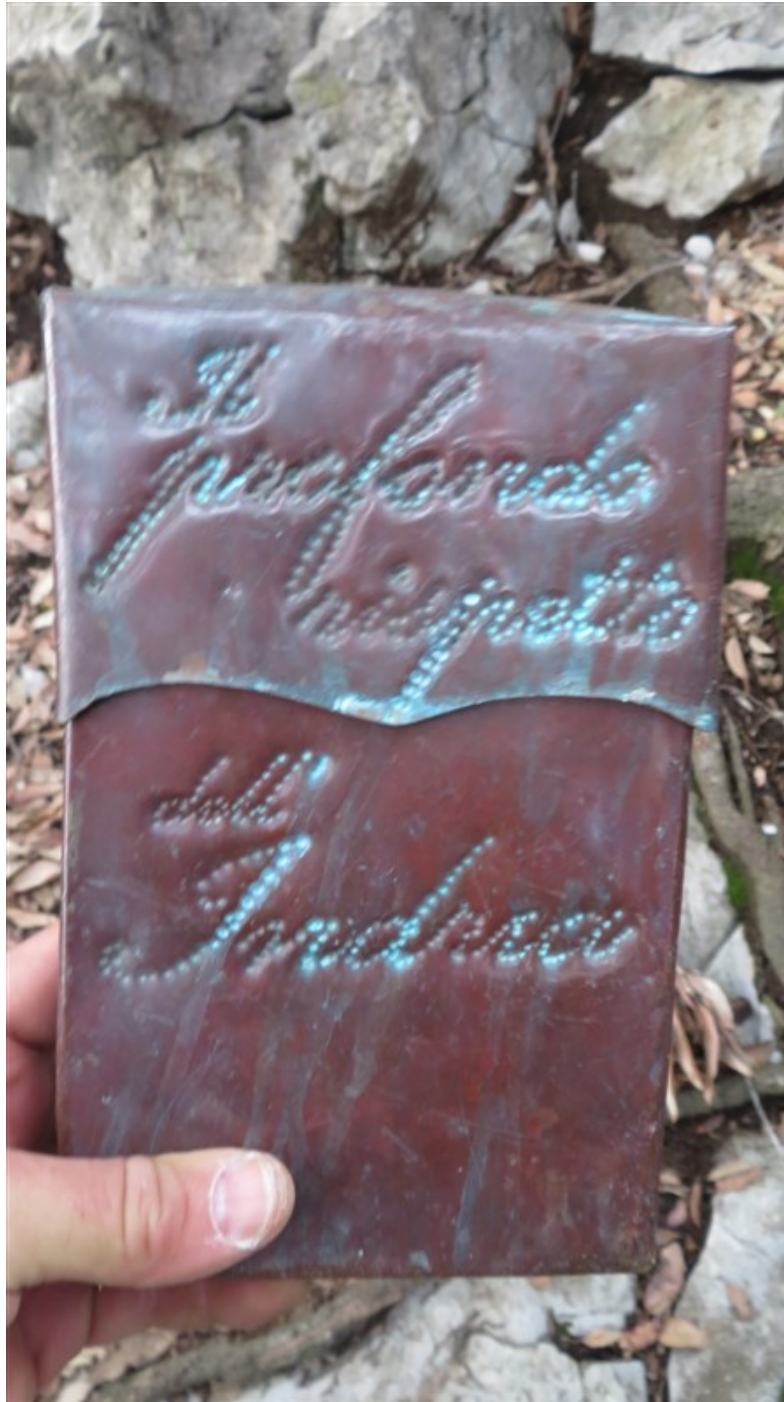
Libro di via