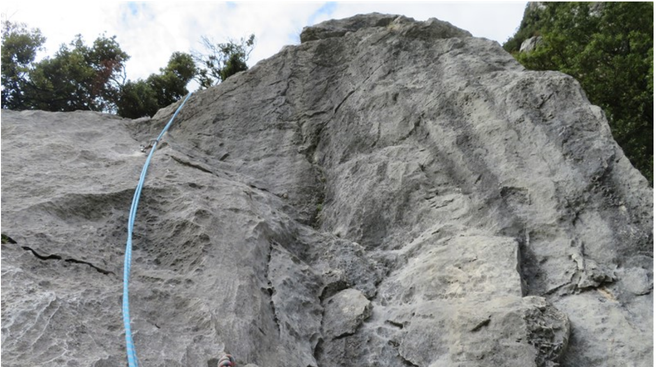
Quinta lunghezza, dopo lo spigolo