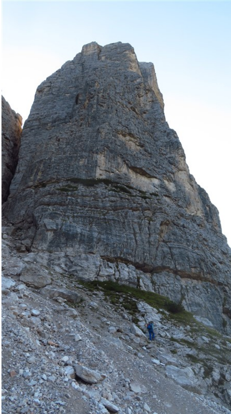
Nel canale di attacco