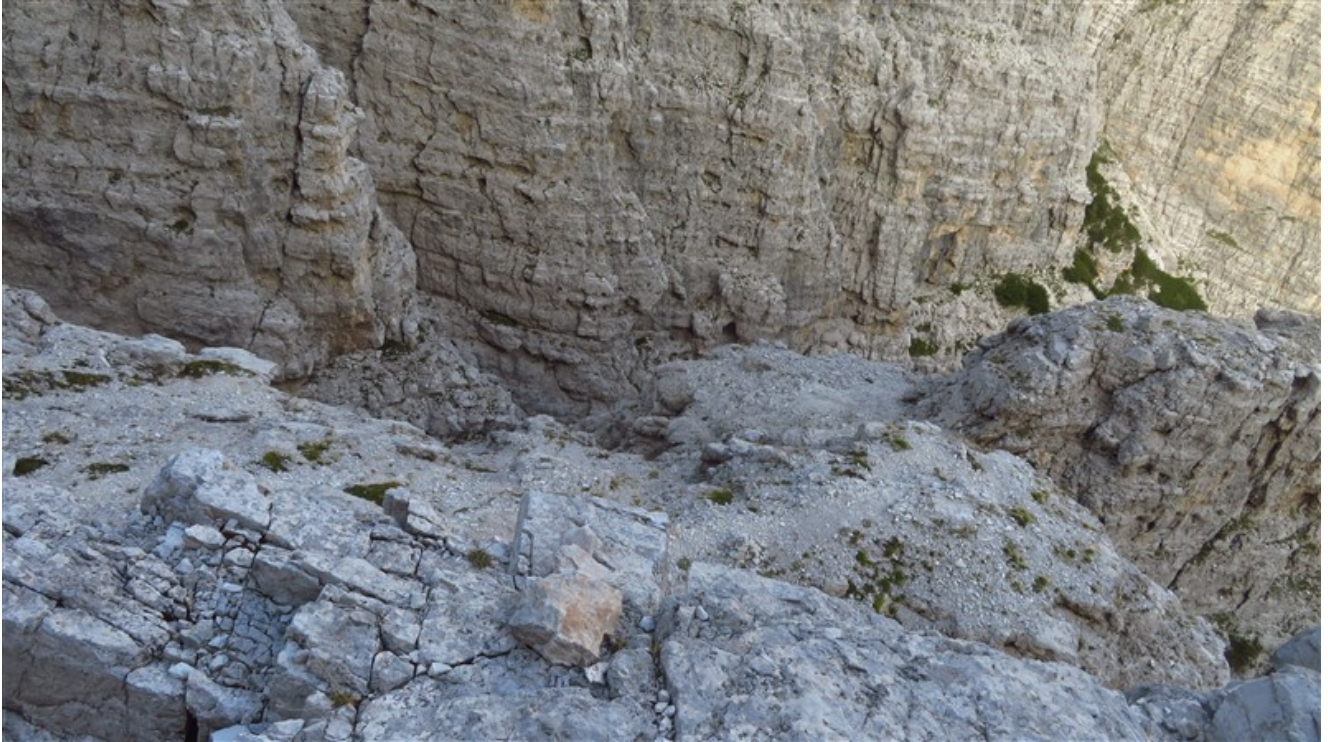
Il canale dopo le doppie