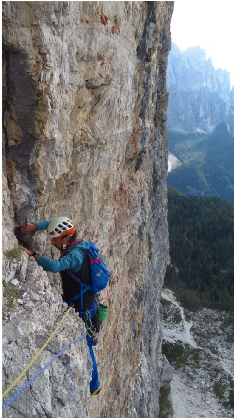
Uscita quinta lunghezza