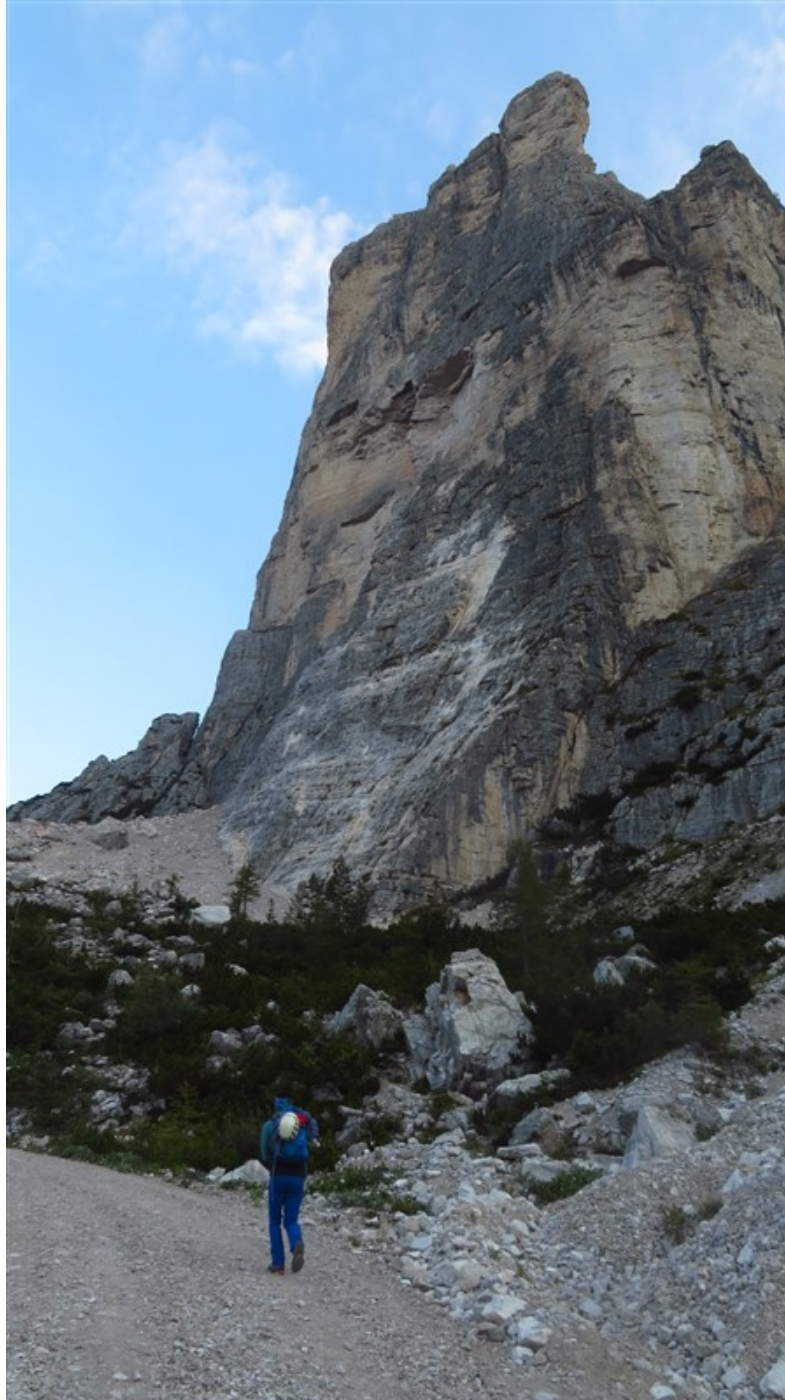
Avvicinamento alla Torre Venezia