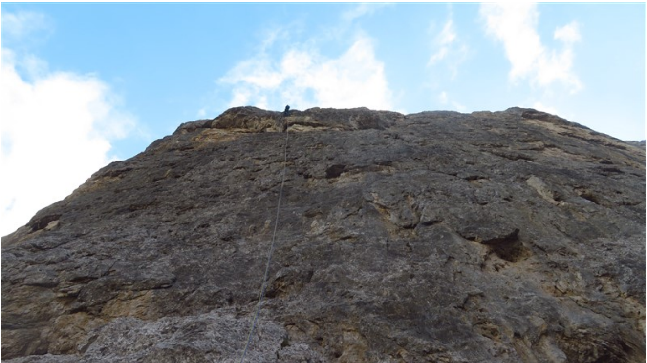
Discesa in doppia