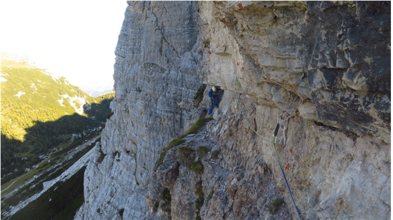
Seconda lunghezza in cengia