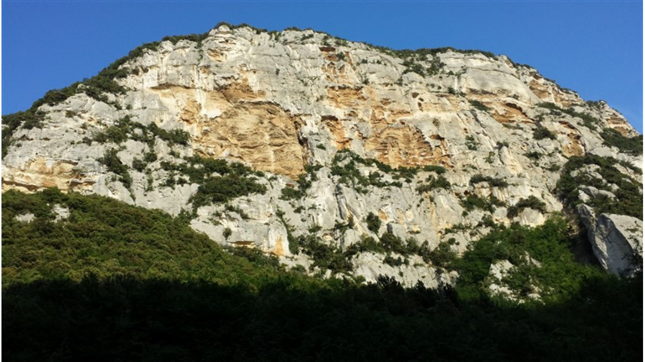
Bric Pianarella, la via sale a destra