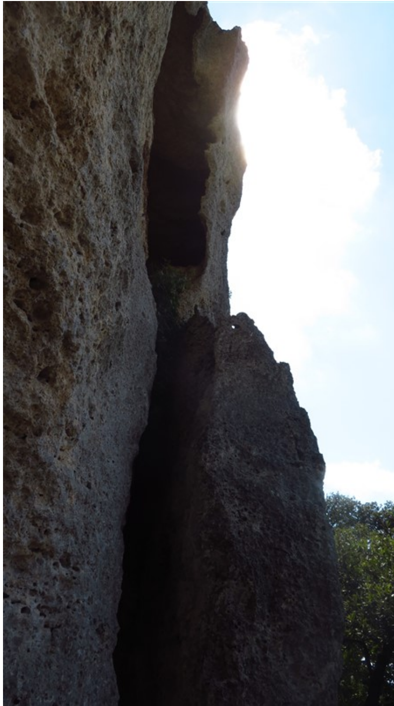
Partenza undicesima lunghezza