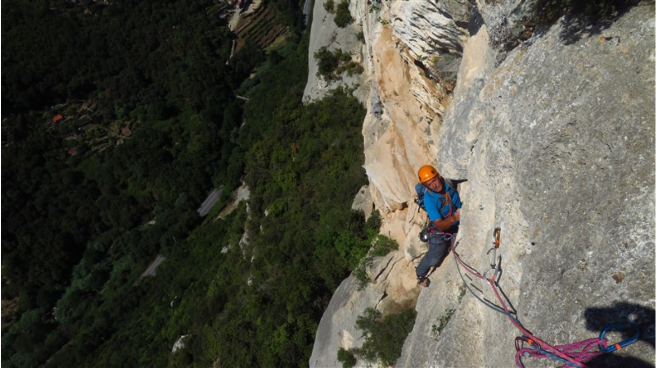
Uscita tredicesima lunghezza