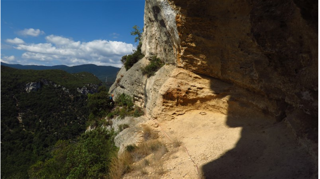
La cengia della decima lunghezza