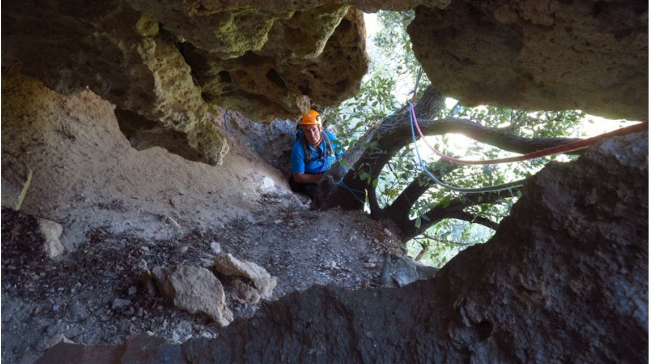
Sosta quinta lunghezza