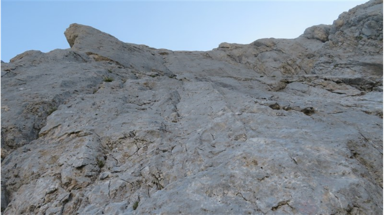
Attacco, visibili i primi due chiodi