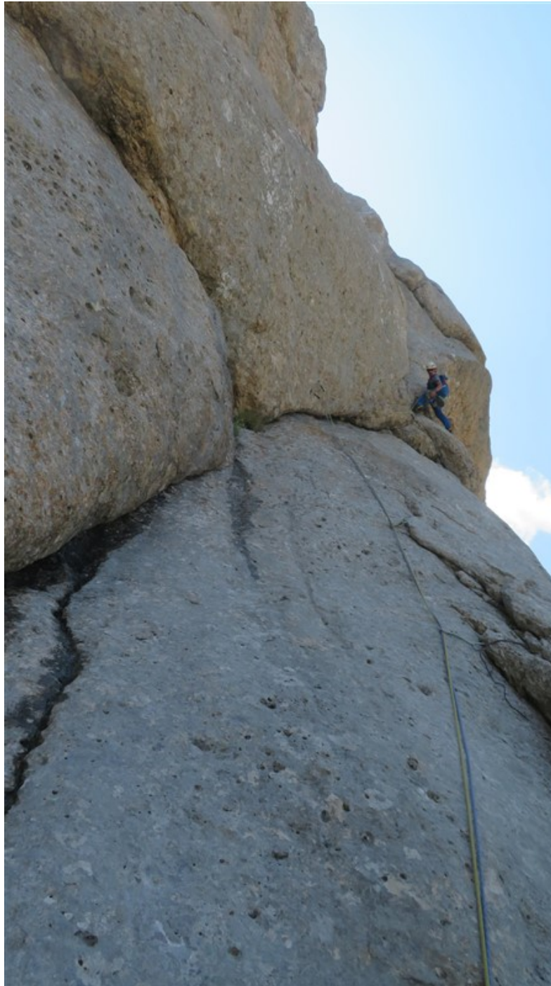
All'attacco della fessura della settima lunghezza