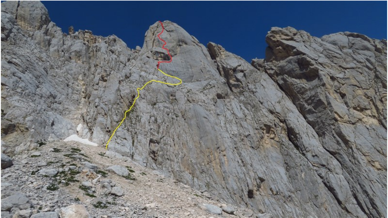
Tracciato indicativo canale e via Di Federico - De Luca