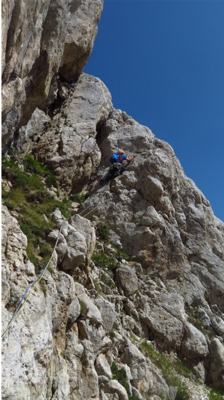
Il tratto di camino dello zoccolo