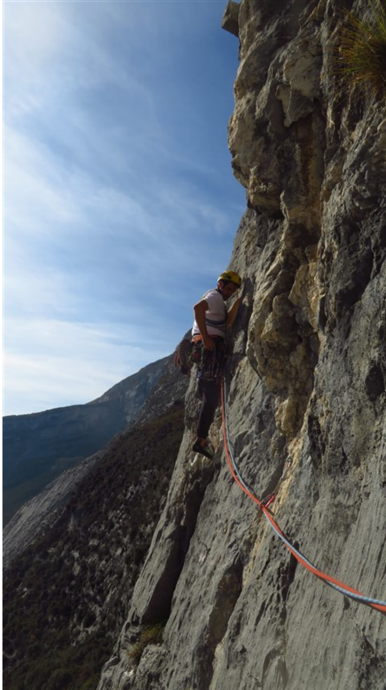
Partenza settima lunghezza