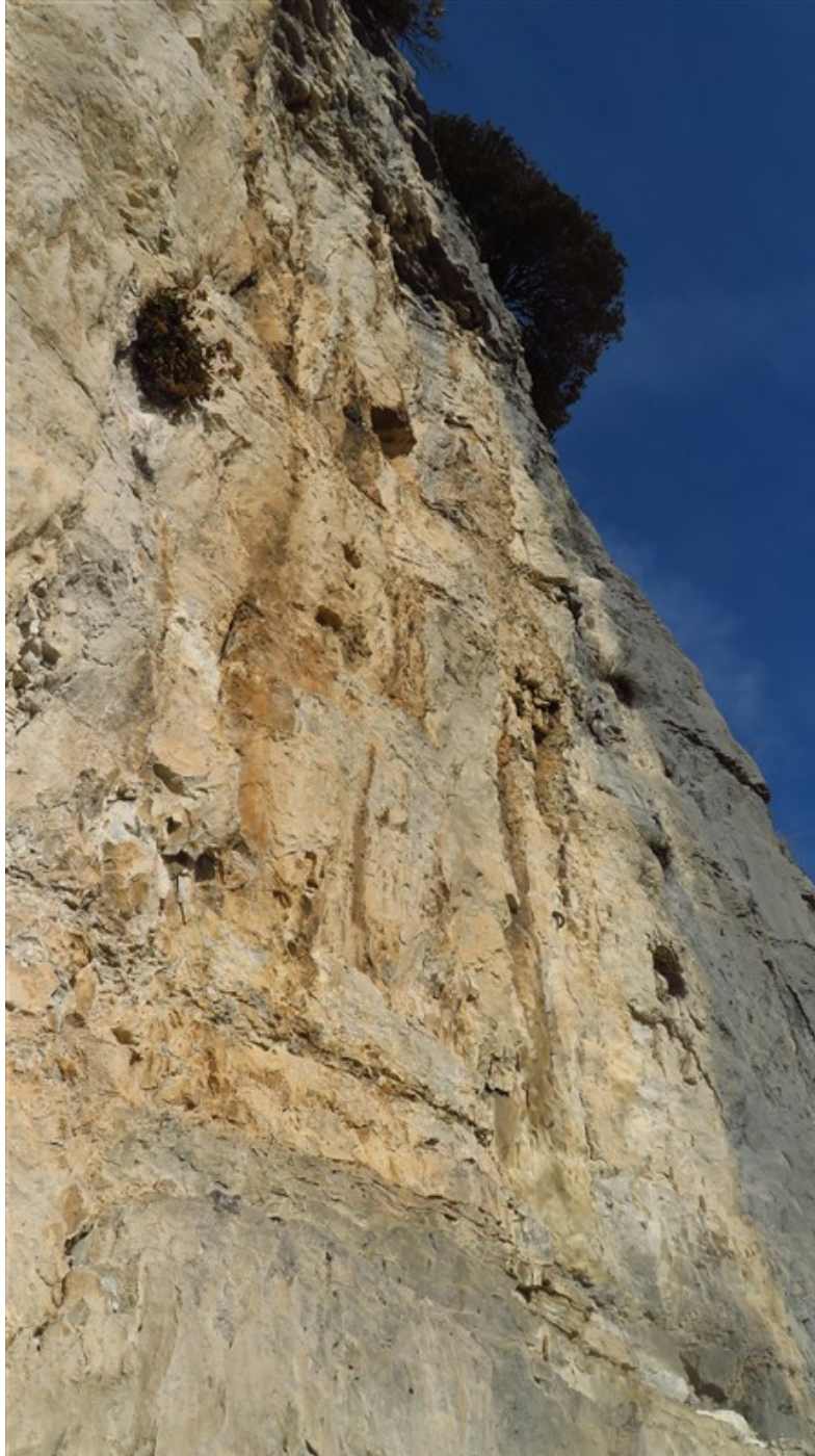
Partenza undicesima lunghezza