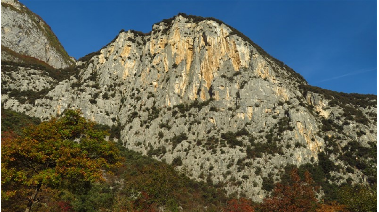
Pian della Paia