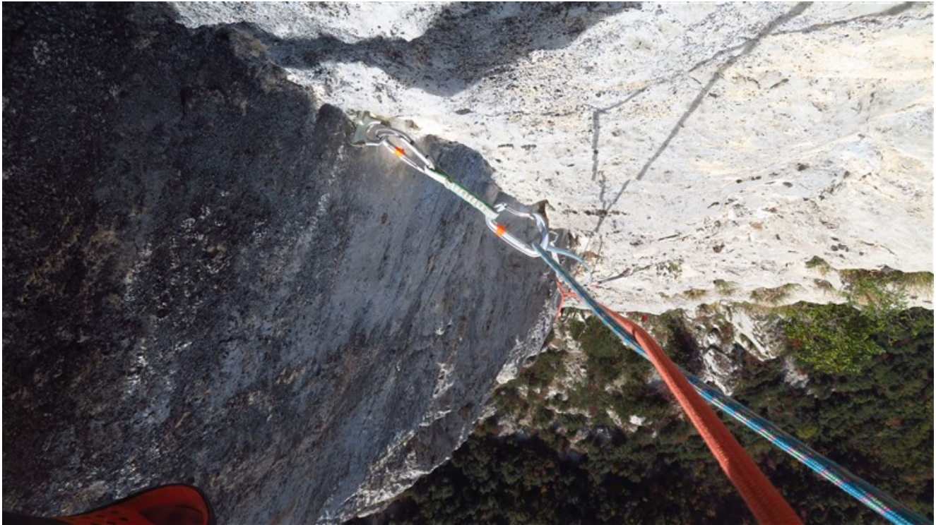
Il diedro dell'undicesima lunghezza