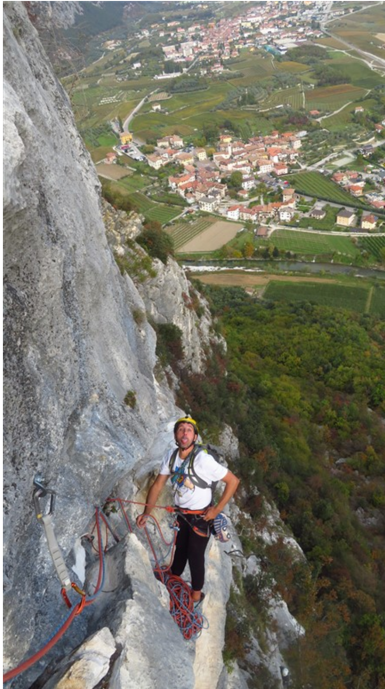
Sosta quinta lunghezza