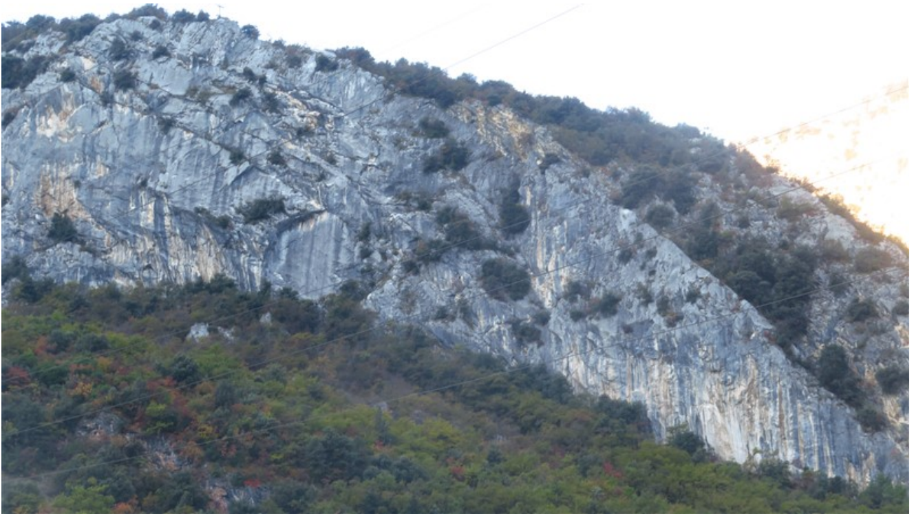
Croce di Ceniga