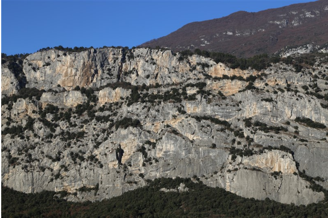
Parete di San Paolo, sotto, e Monte Colt, sopra