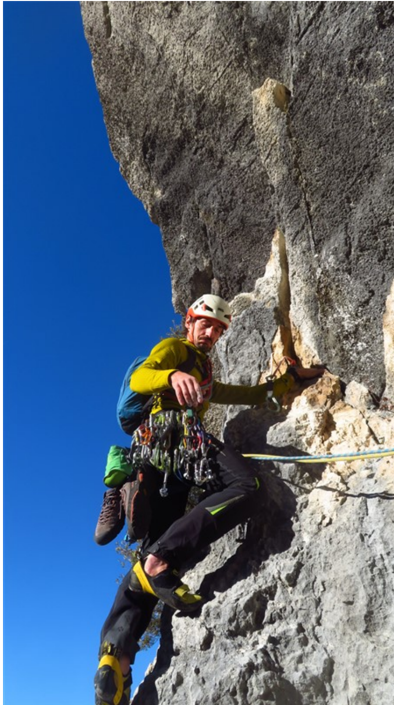
Partenza quinta lunghezza