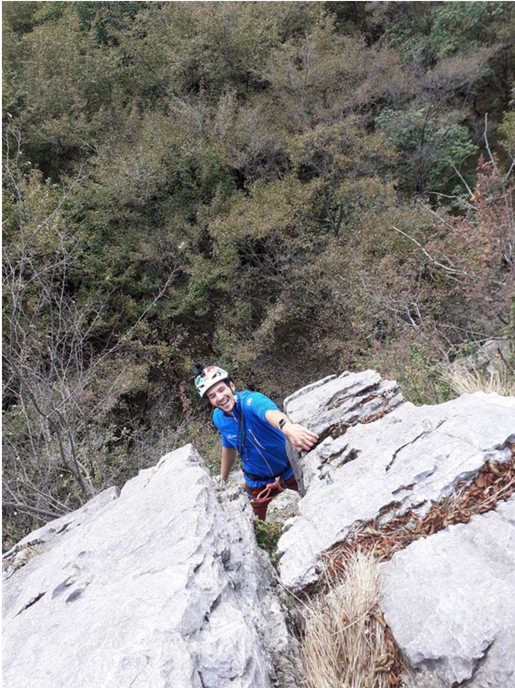
In uscita dal secondo tettino del primo tiro