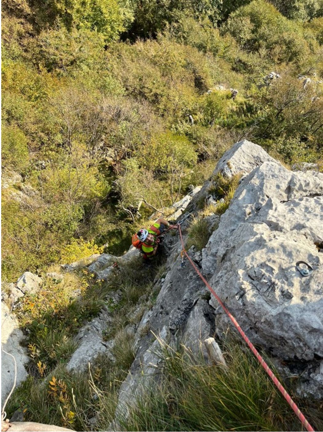
Sul secondo tiro