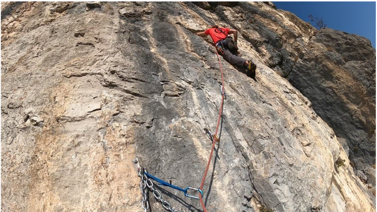
In partenza sul quarto tiro