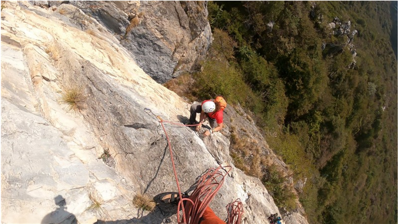
Jacopo sul terzo tiro