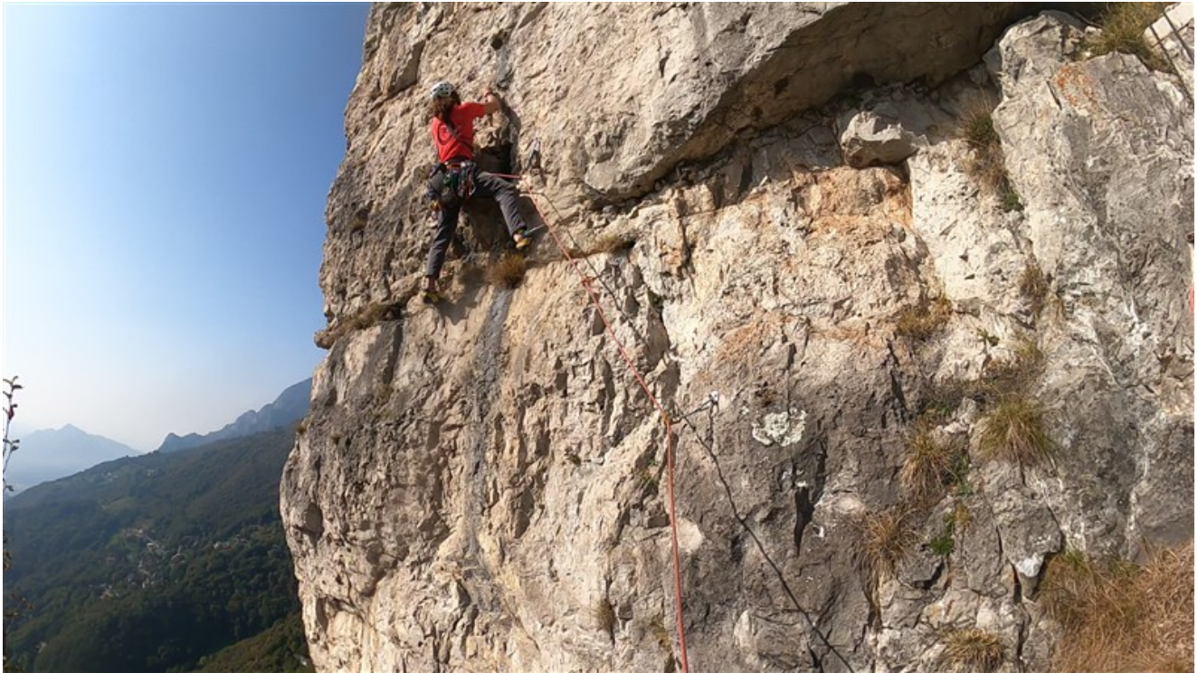
L'ultimo tiro della via