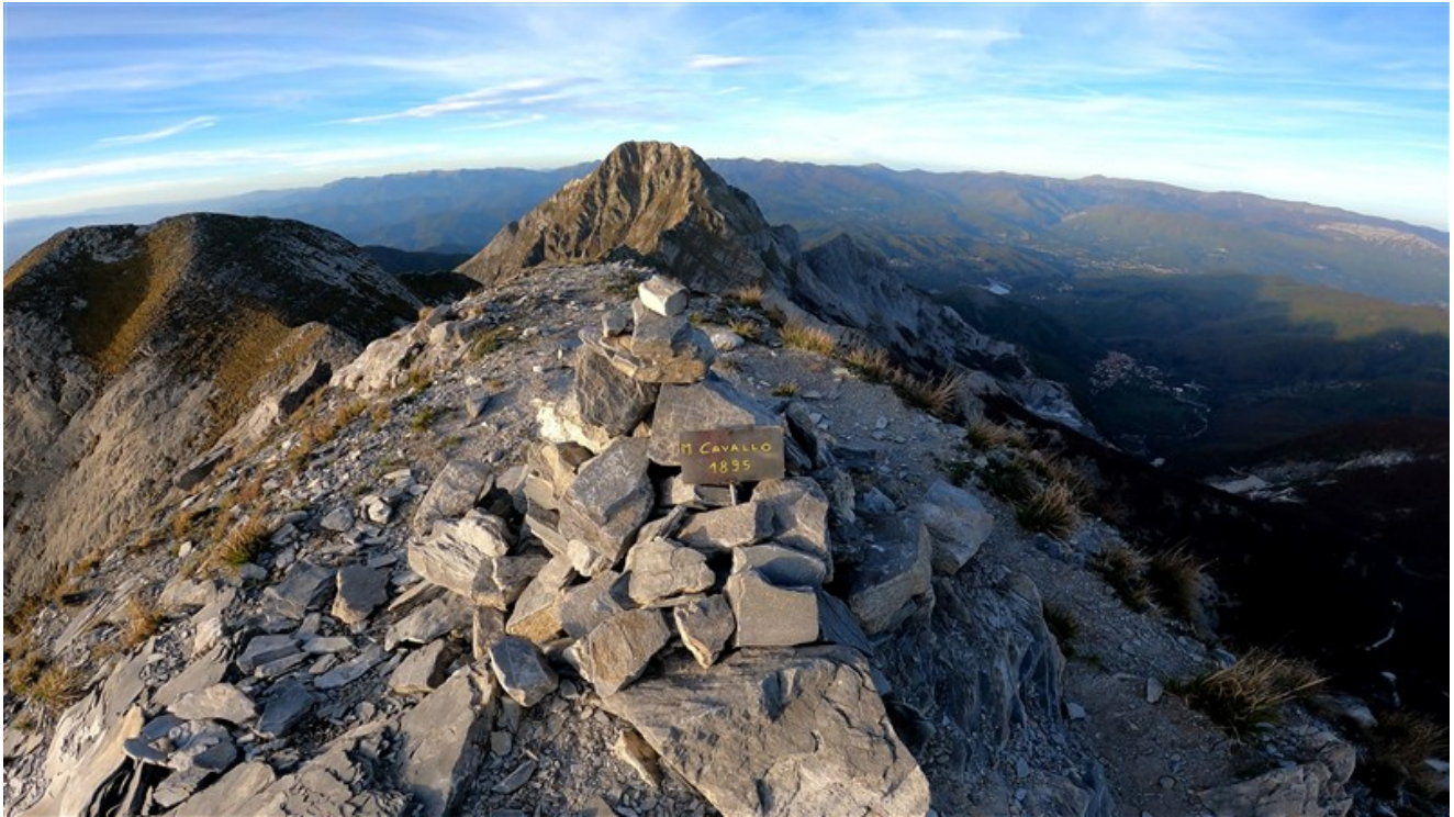
Targa Monte Cavallo