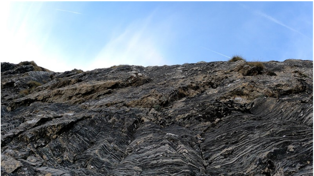
Tiro di 6a