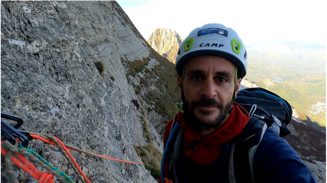
Traverso settima lunghezza