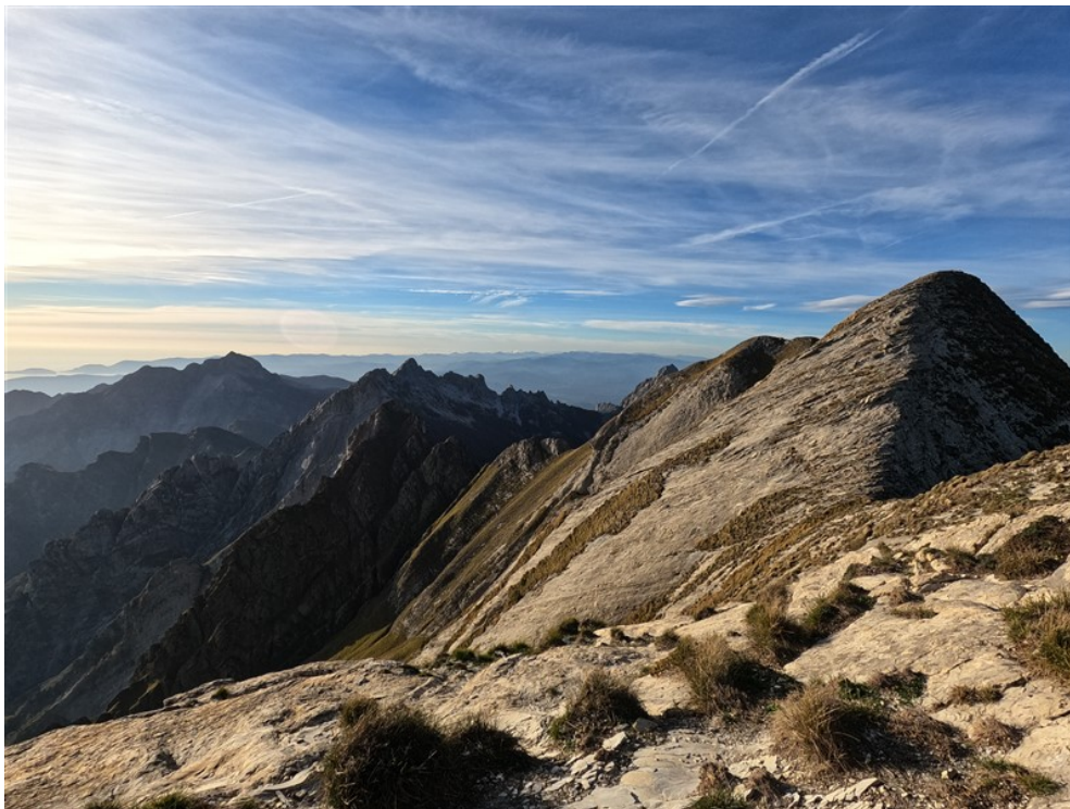
Uscita dalla via, vista gobbe di rientro