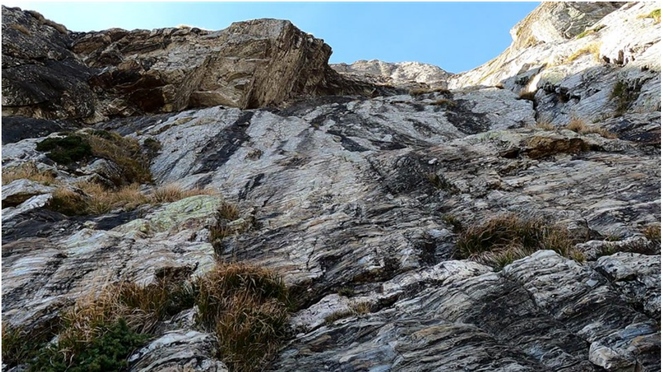
Attacco della via