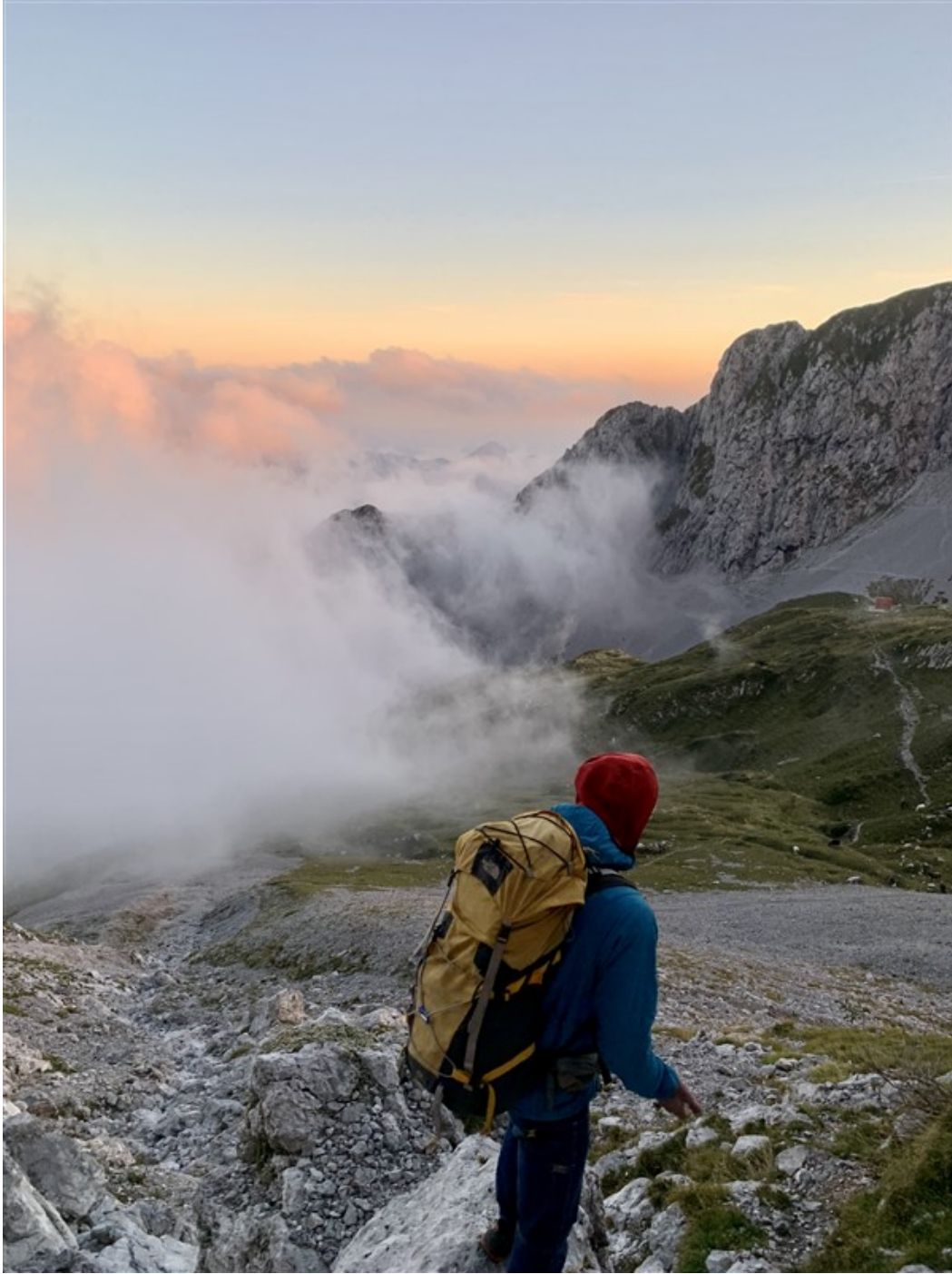
Bivacco al tramonto