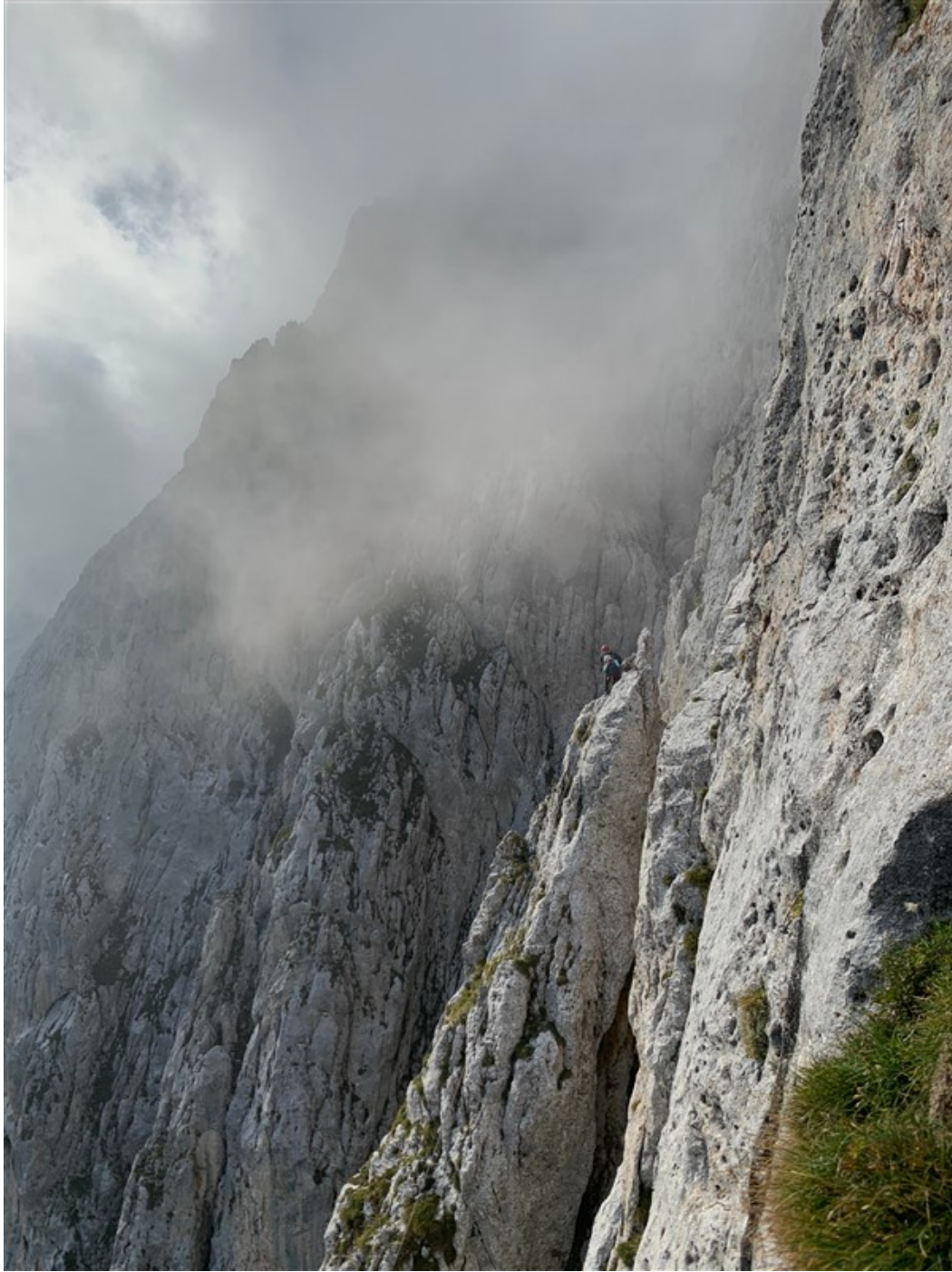
Cordata sulla via Bramani-Ratti