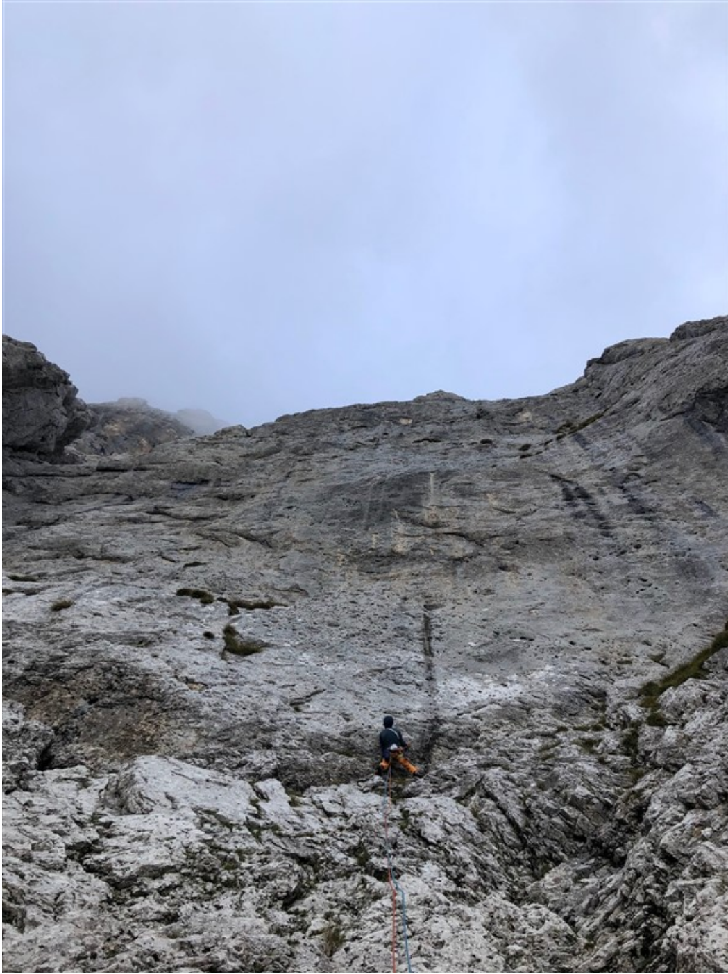
Sulla prima lunghezza