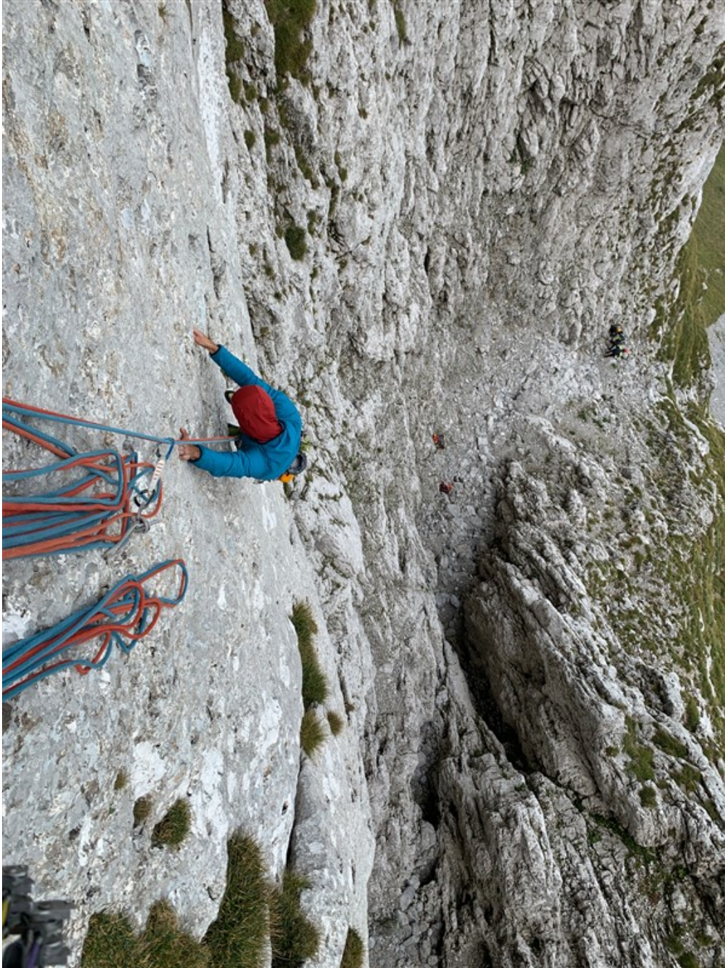
Nicola sulla prima lunghezza