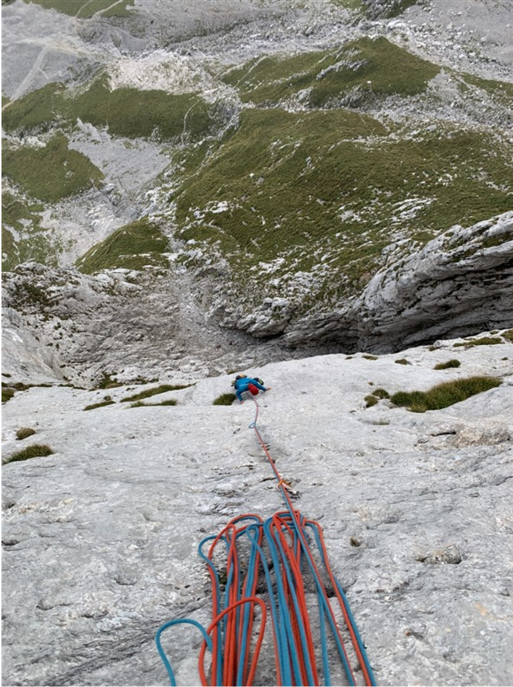
Roccia super compatta