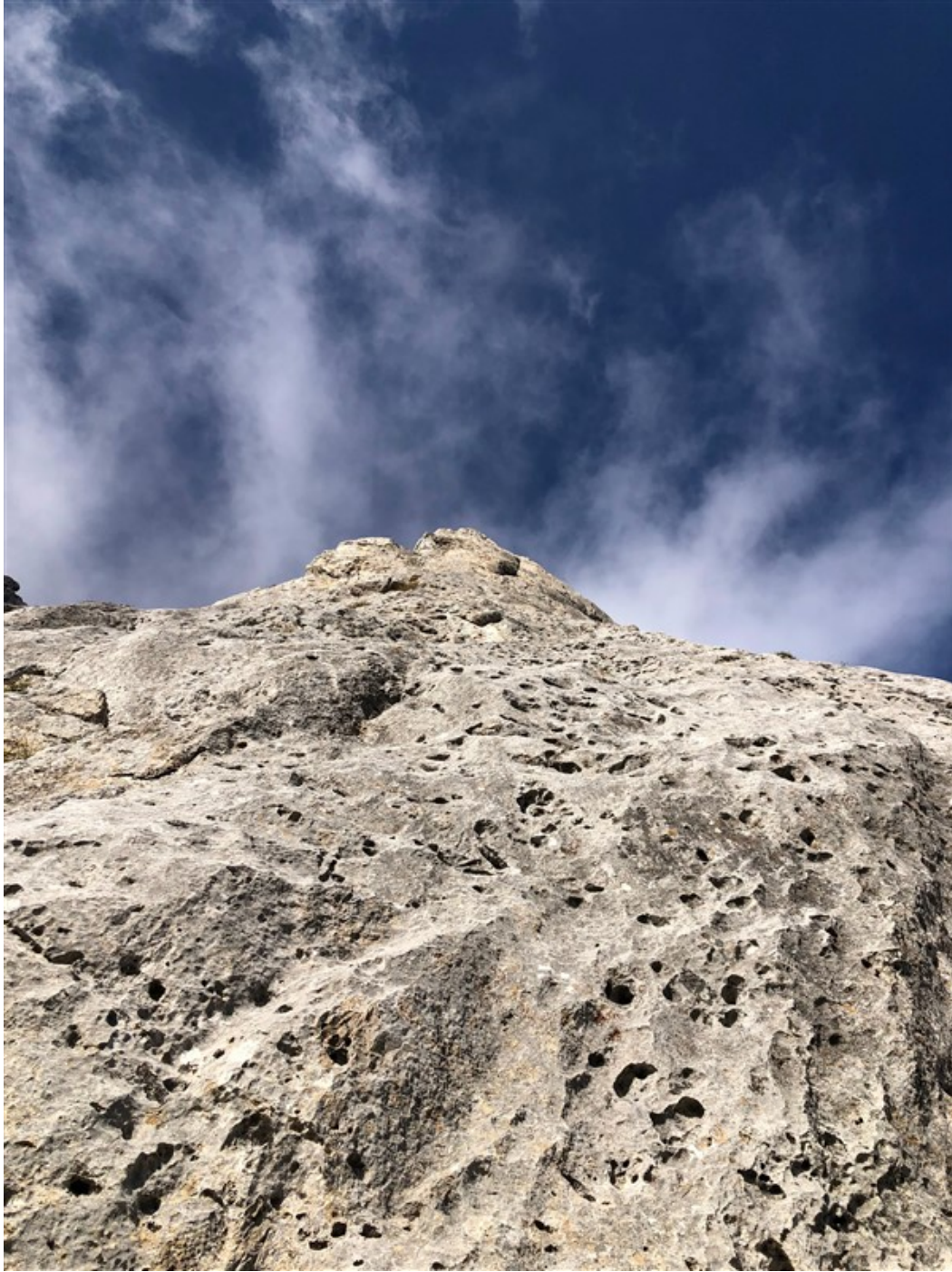
Partenza quinta lunghezza