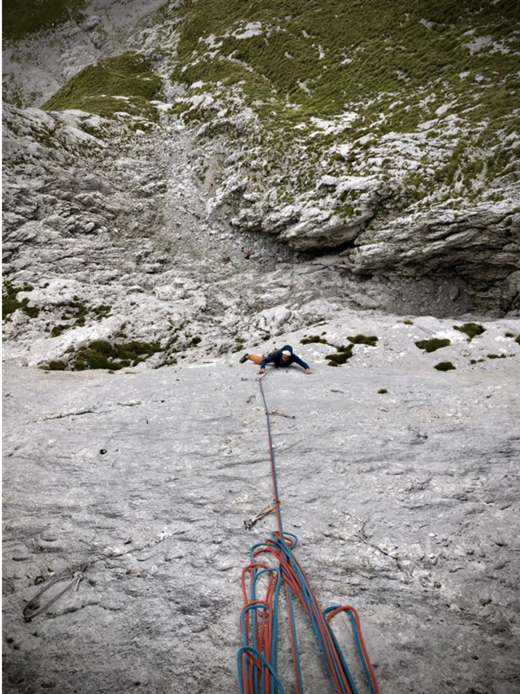
Luca sul tiro chiave