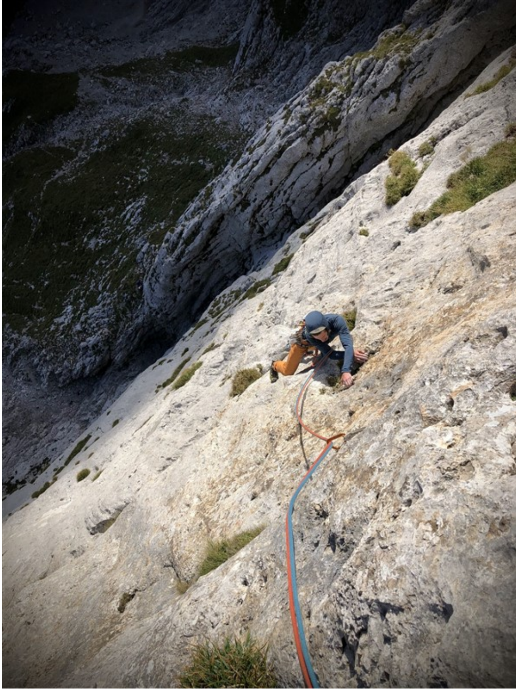
Luca in uscita dall'ultimo tiro