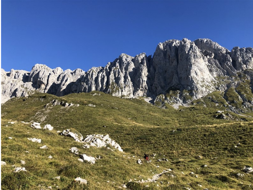
La parete sulla destra