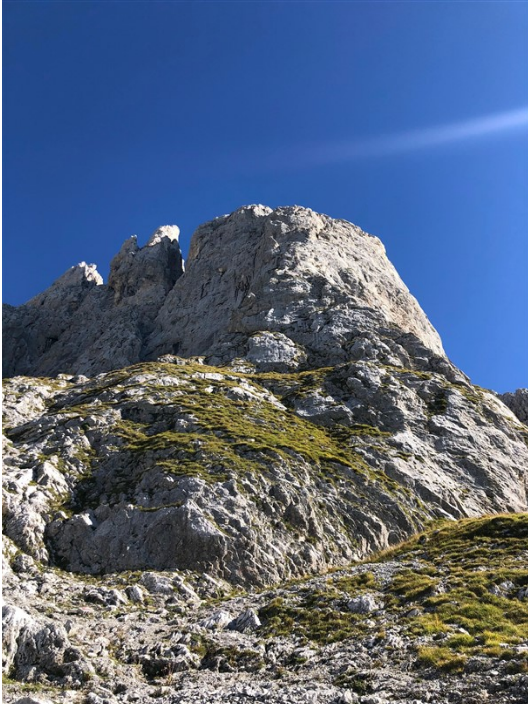
Verso l'attacco della via