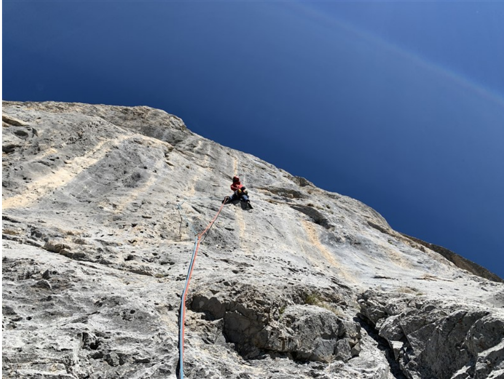
Nicola sulla placca della terza lunghezza