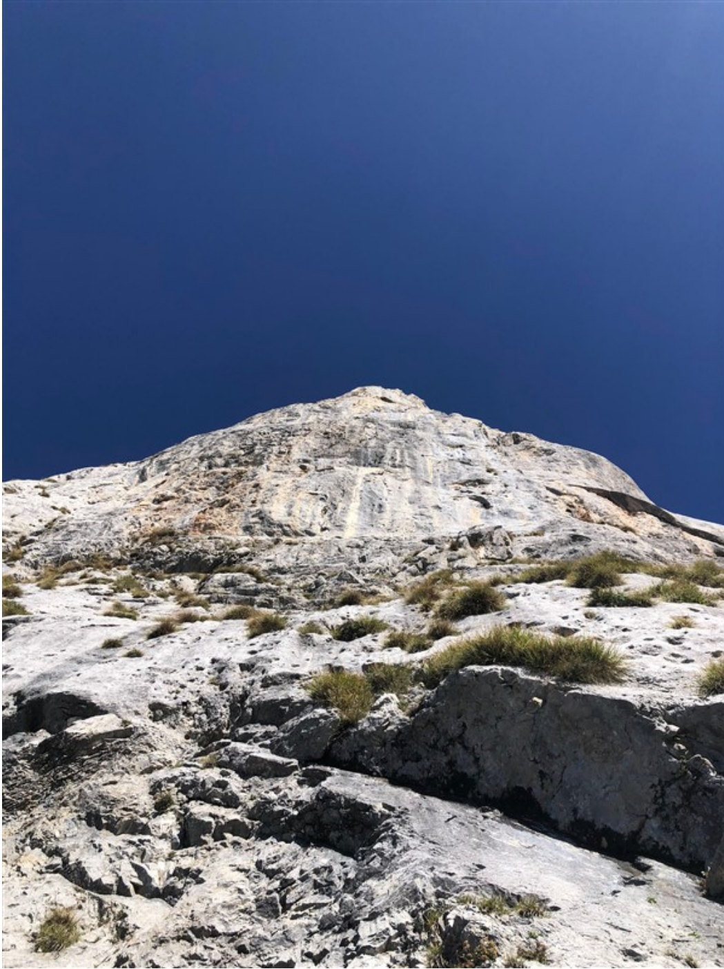
Partenza seconda lunghezza