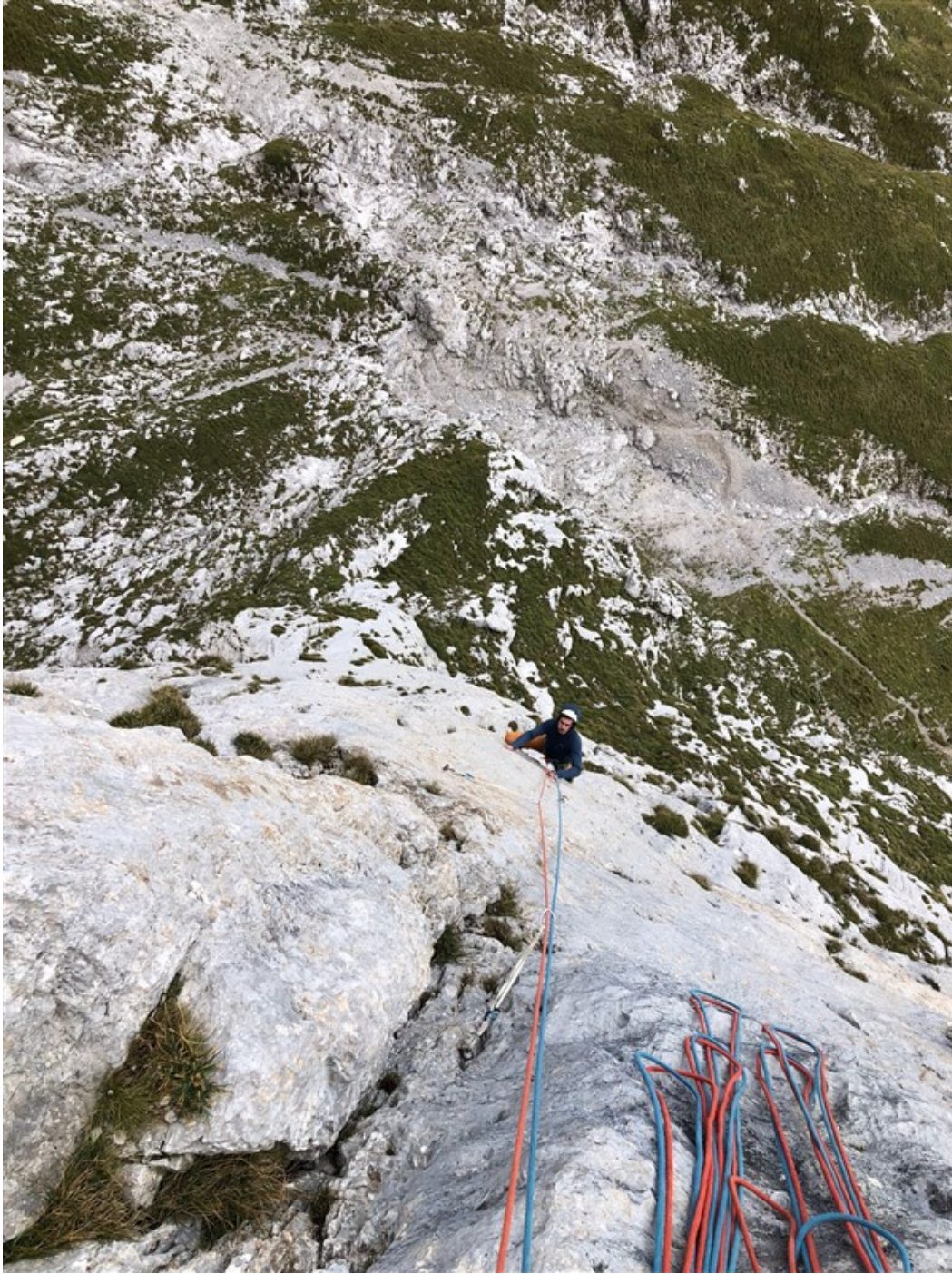
Luca sul quinto tiro