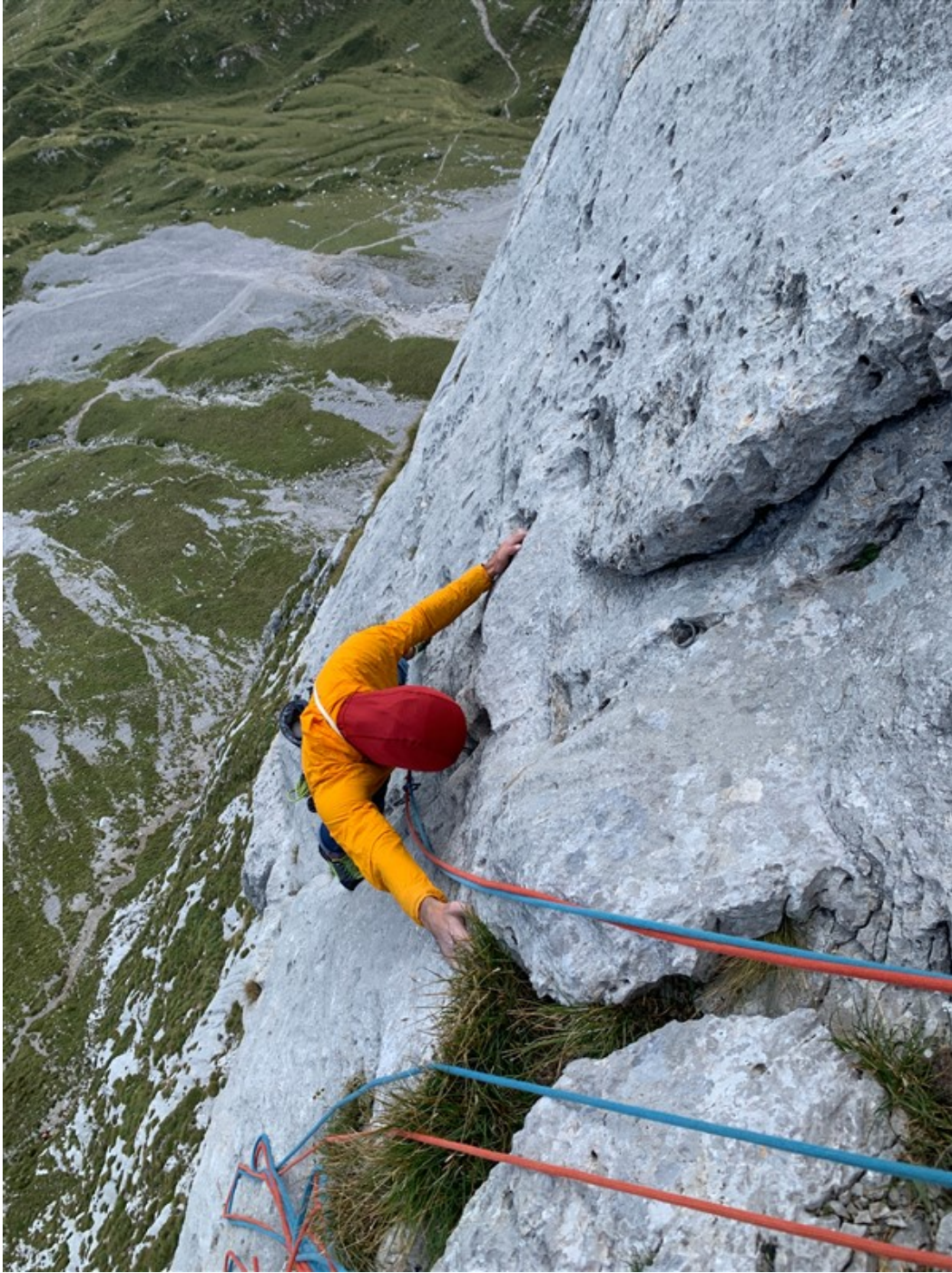
Parte finale della fessura