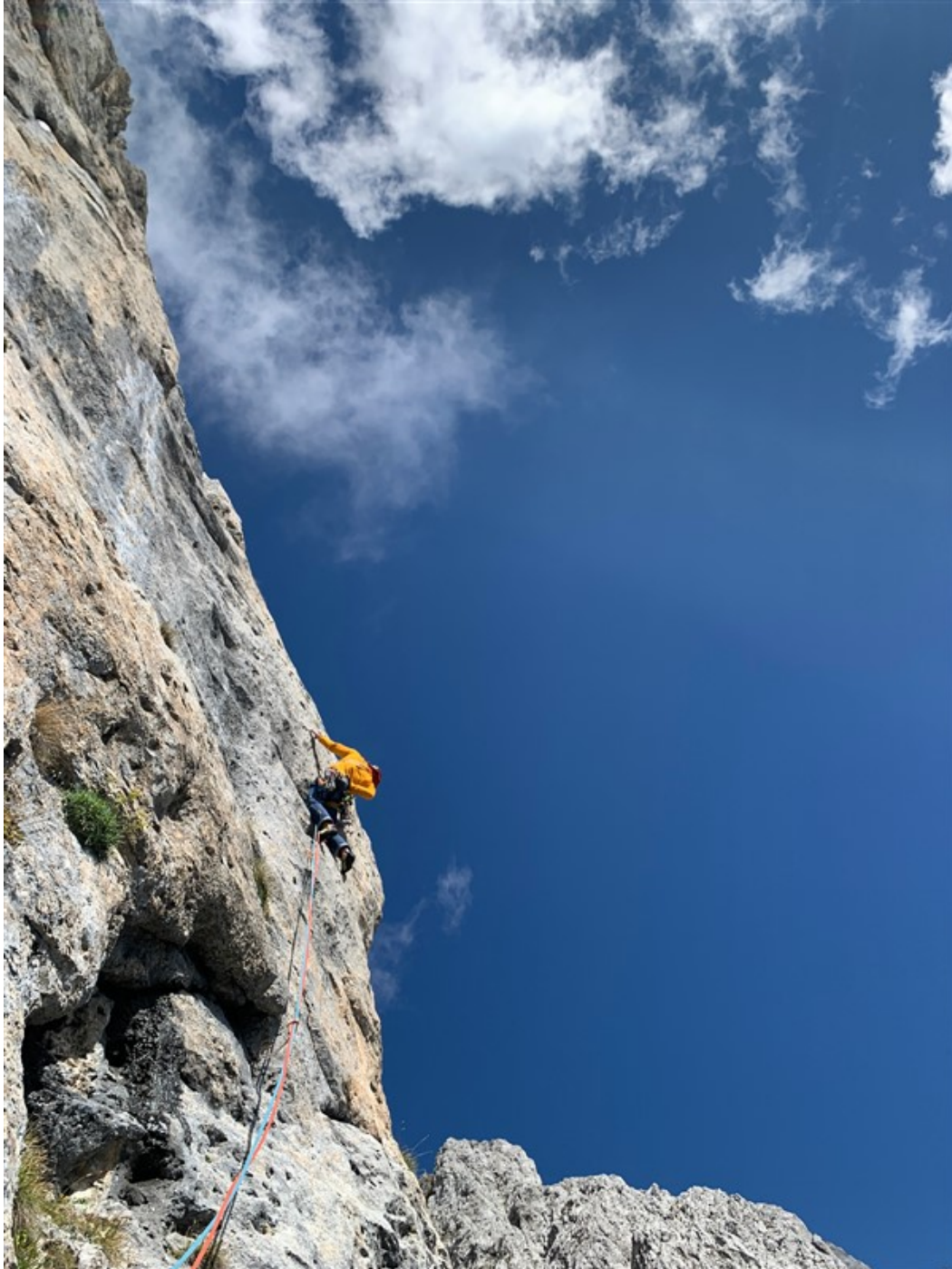
Lo spigolo del quinto tiro