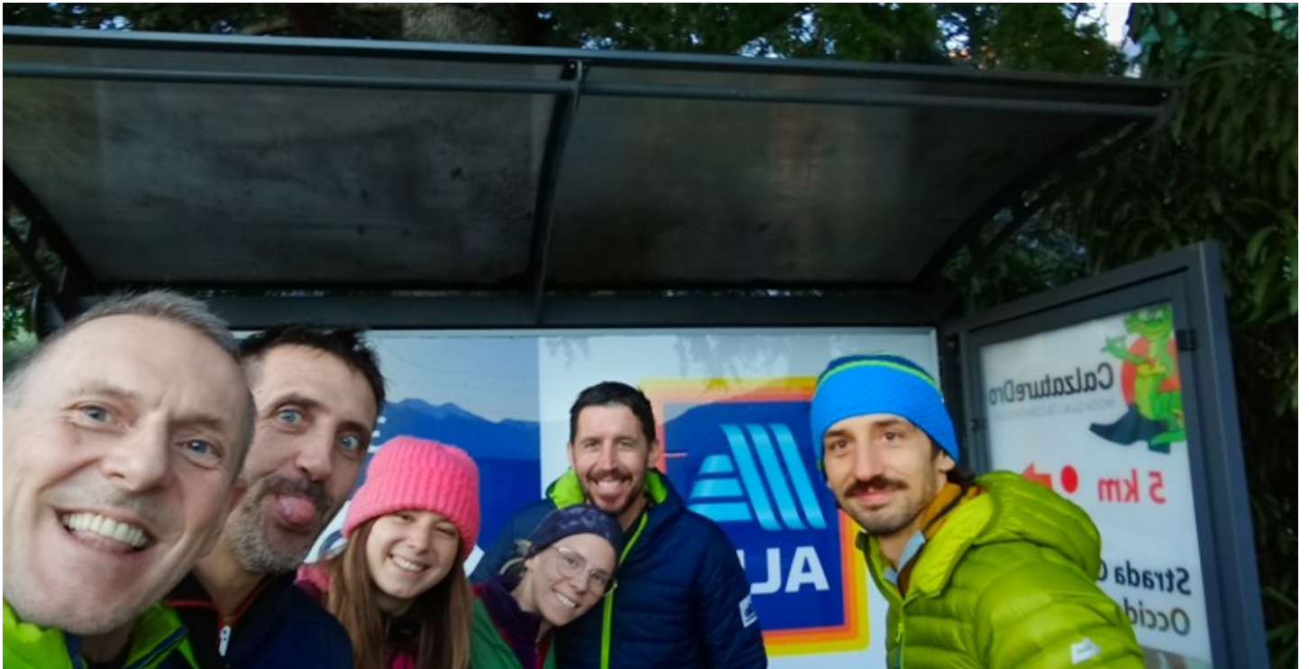
Riunione delle cordate