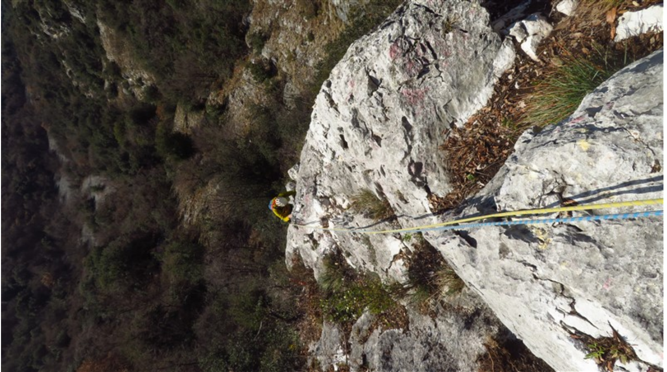
Parte finale seconda lunghezza