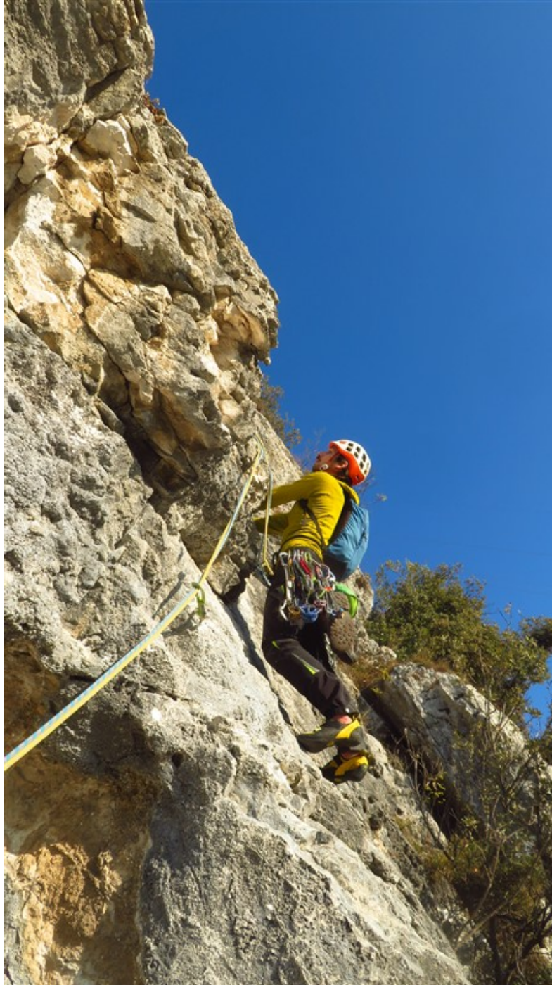
Inizio quinta lunghezza