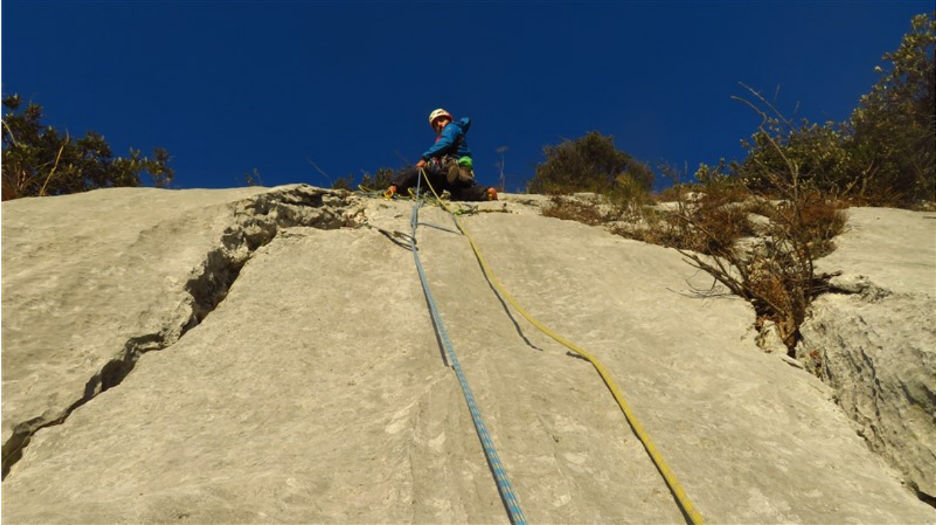
Fine sesta lunghezza