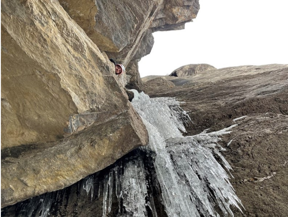
In uscita dal buco della seconda lunghezza