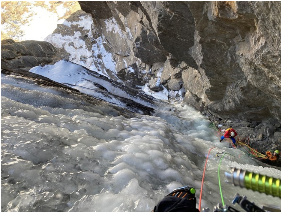
Sulla quarta lunghezza