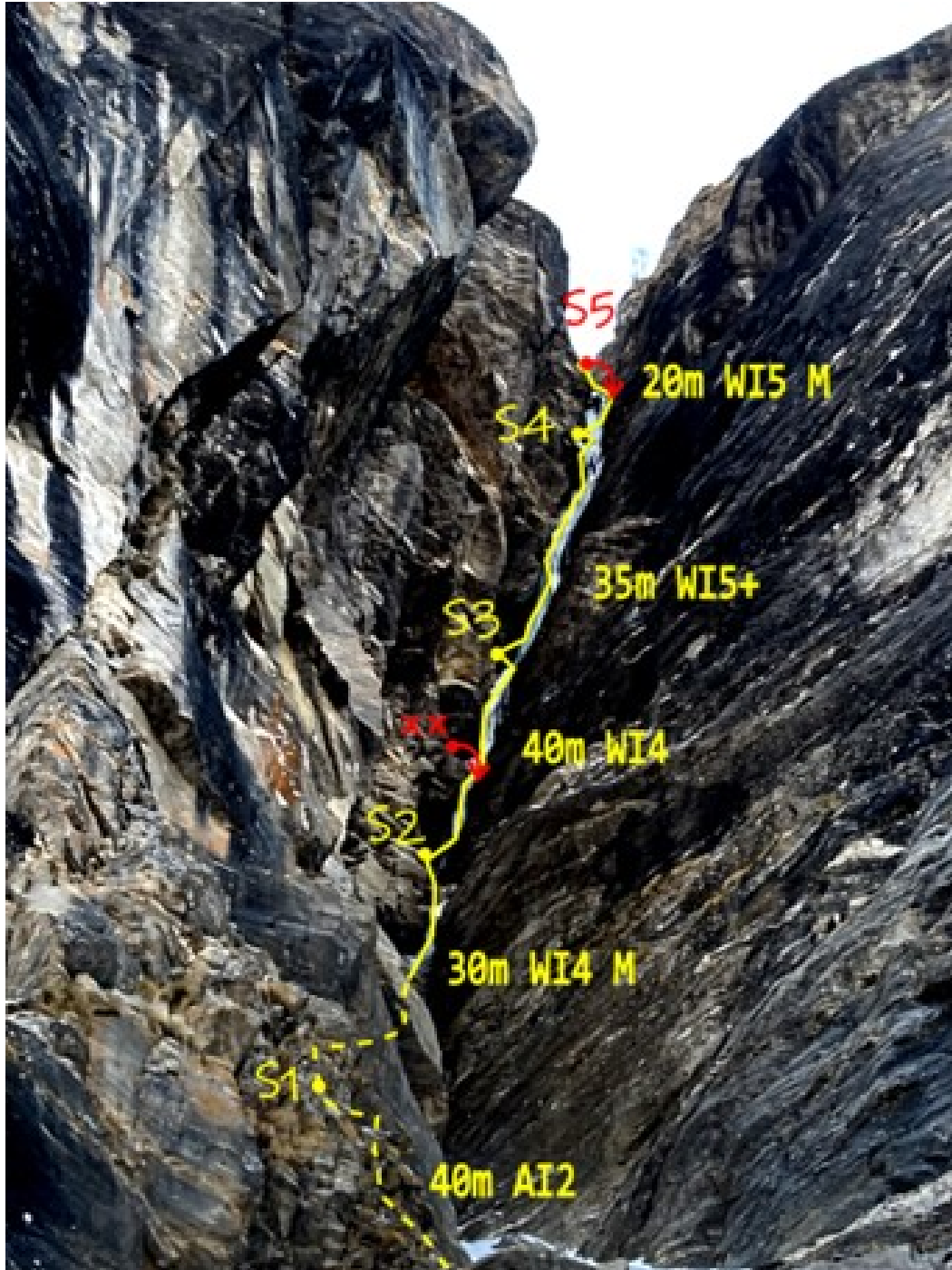
Tracciato della via