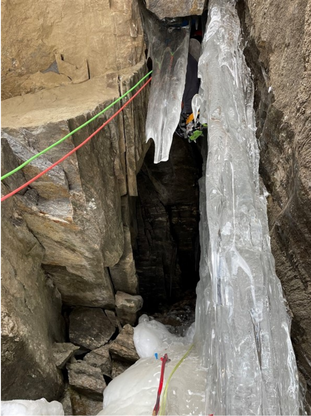
Nella grotta della seconda lunghezza