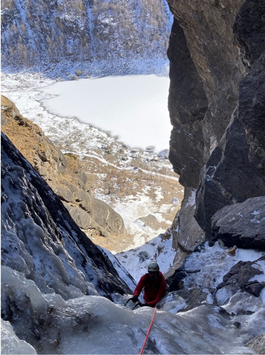
In arrivo in S3