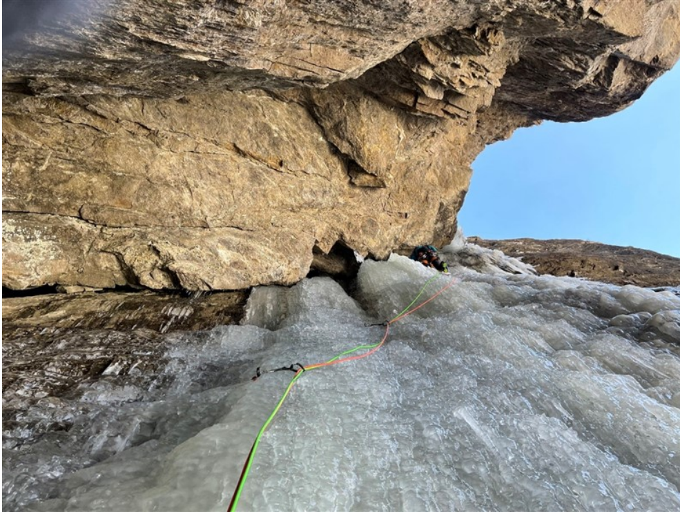
Sulla quarta lunghezza