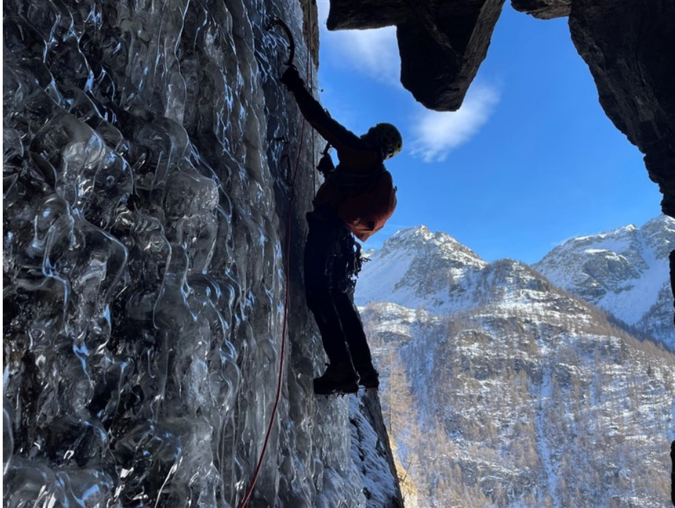
Sulla prima colata della terza lunghezza