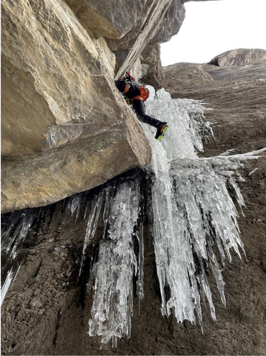
In uscita dal buco della seconda lunghezza