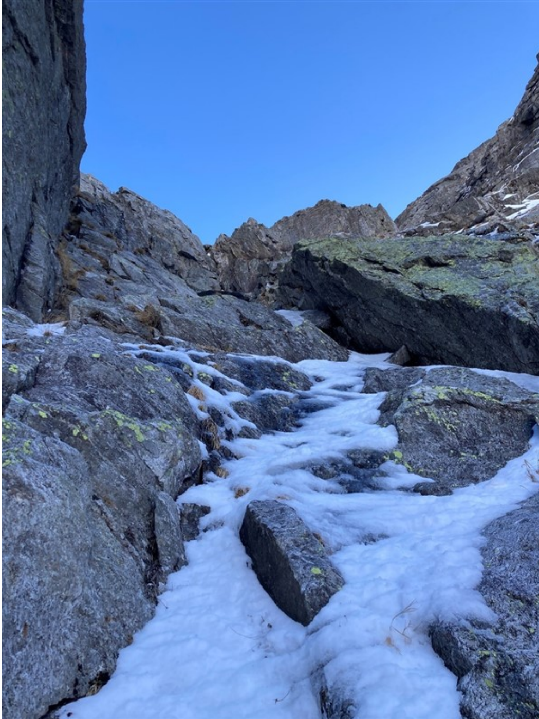
La partenza del primo tiro