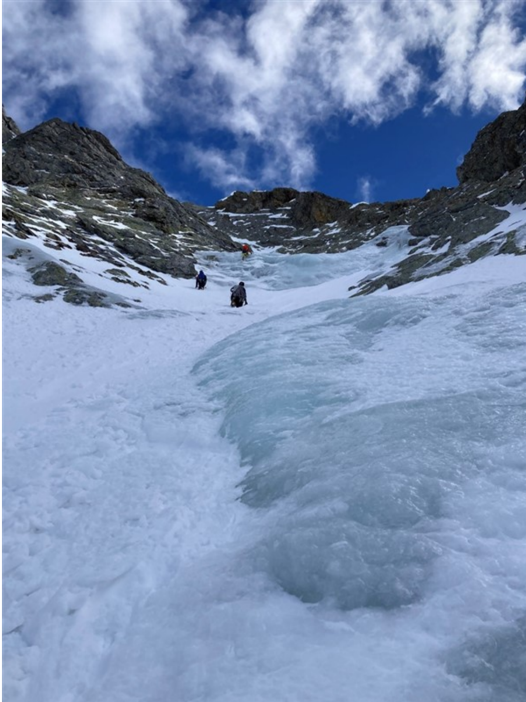
I pendii superiori