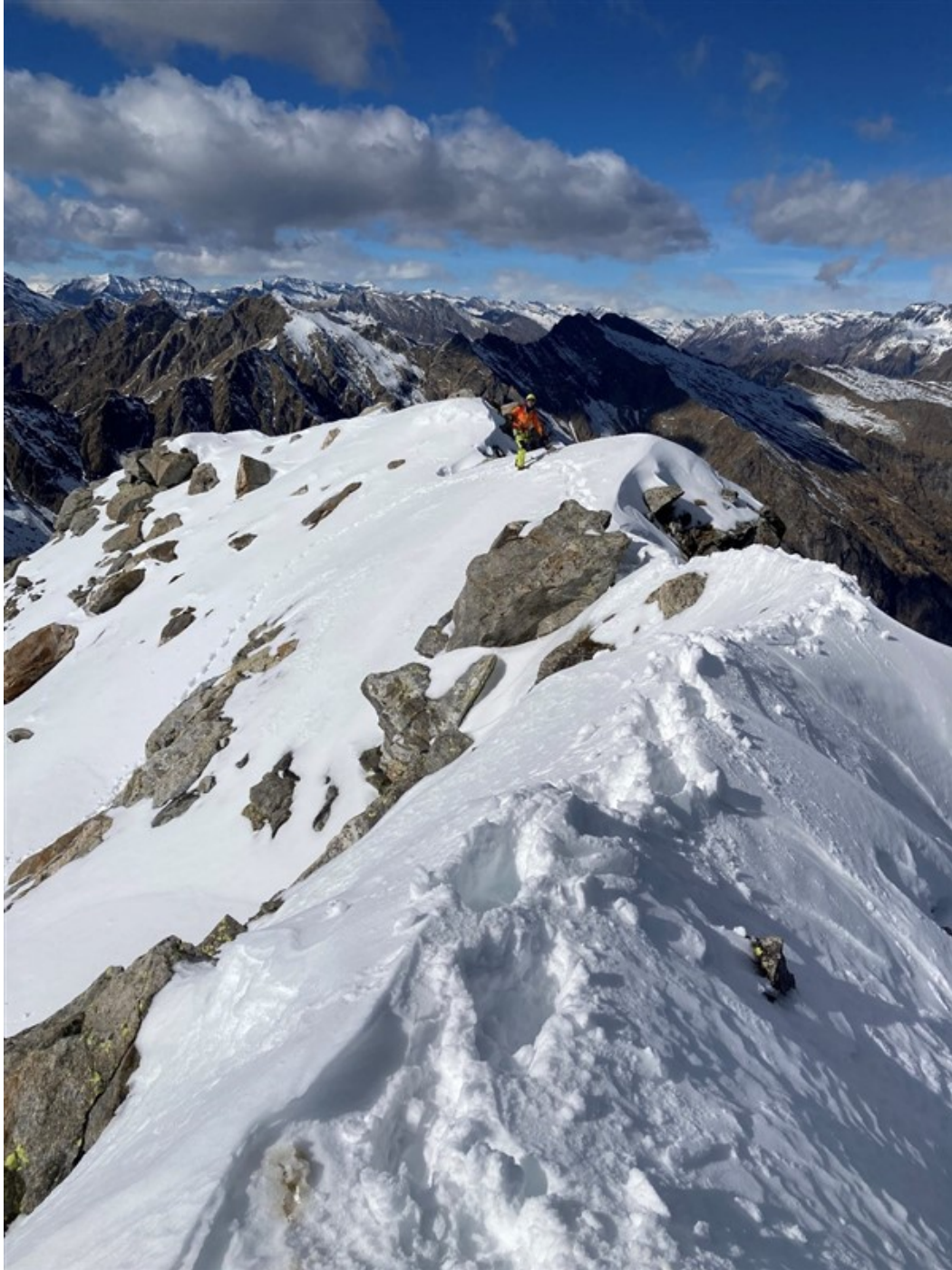
La cresta sommitale vista dalla cima