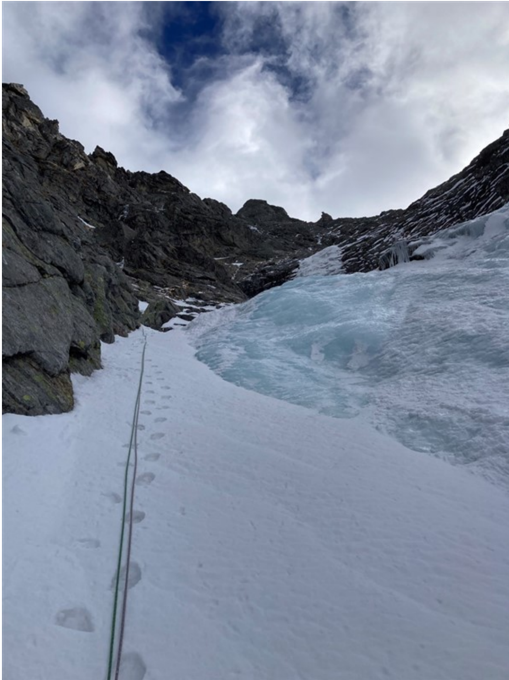
Il canale prima del terzo tiro