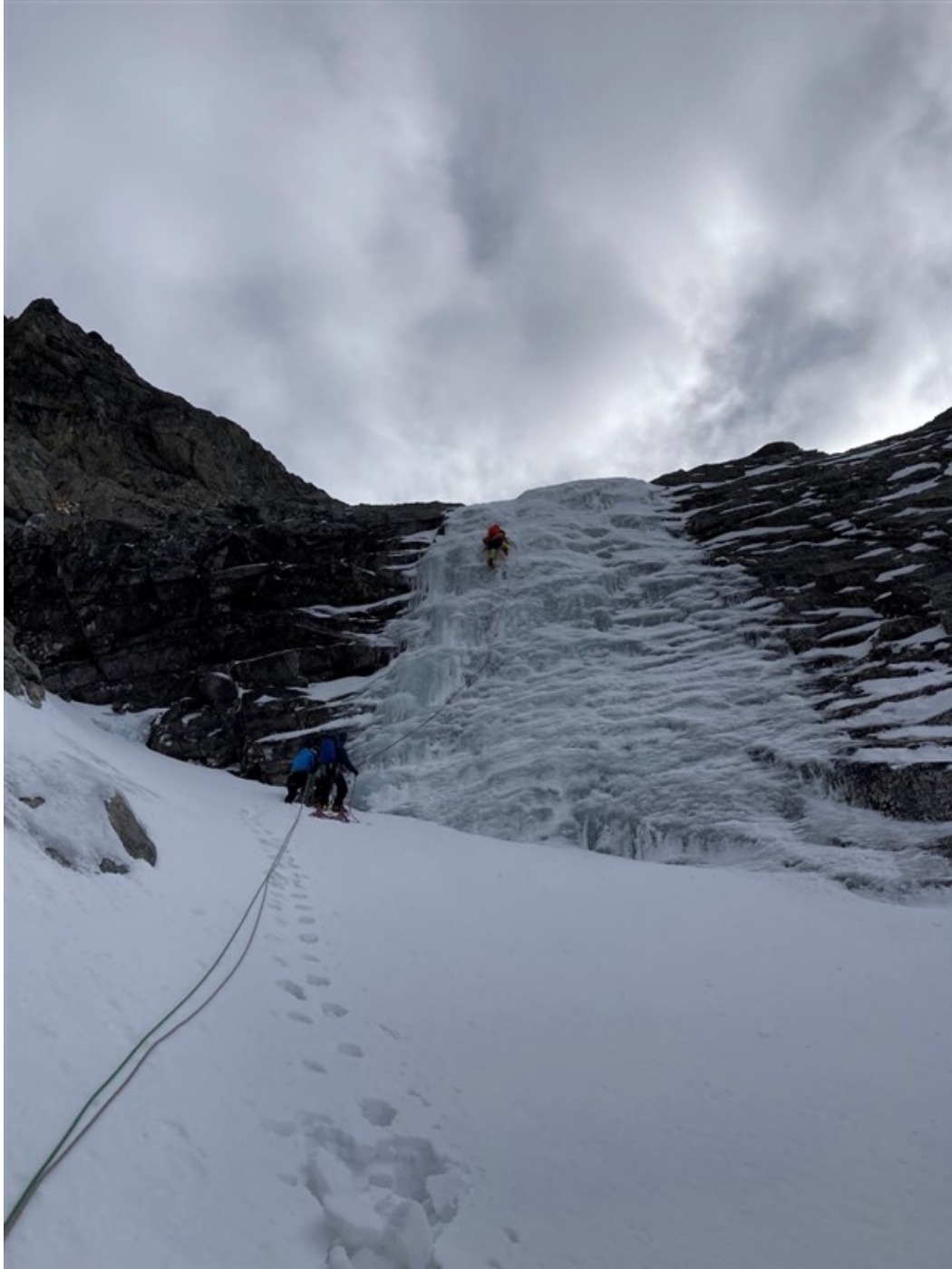
Il terzo tiro