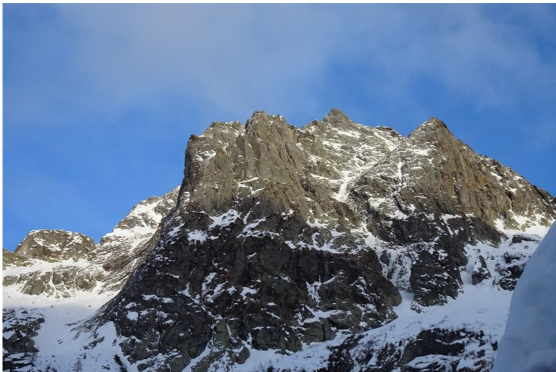
La via vista dal punto bivacco