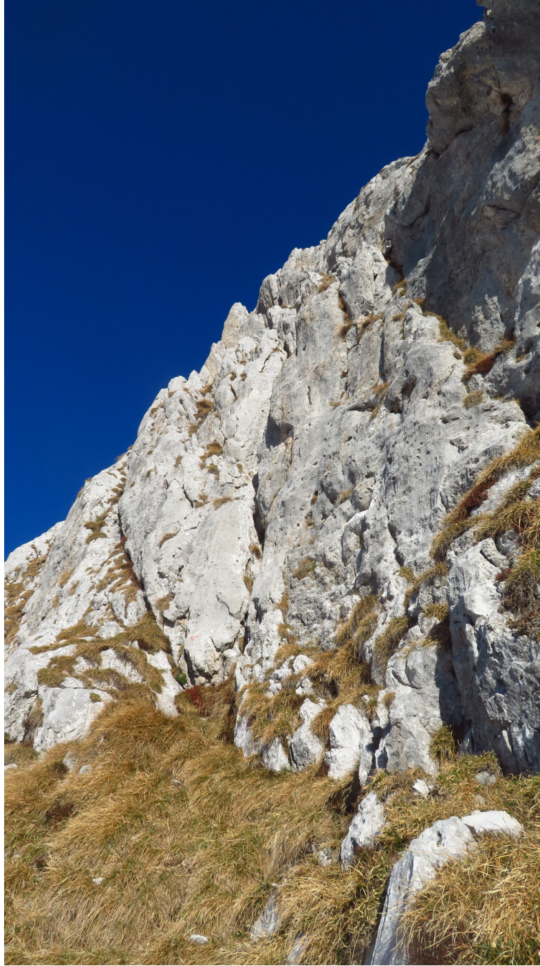
A sinistra visibile l'attacco di Buon Compleanno