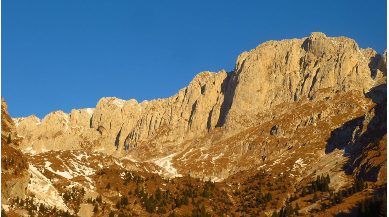
Presolana, parete sud