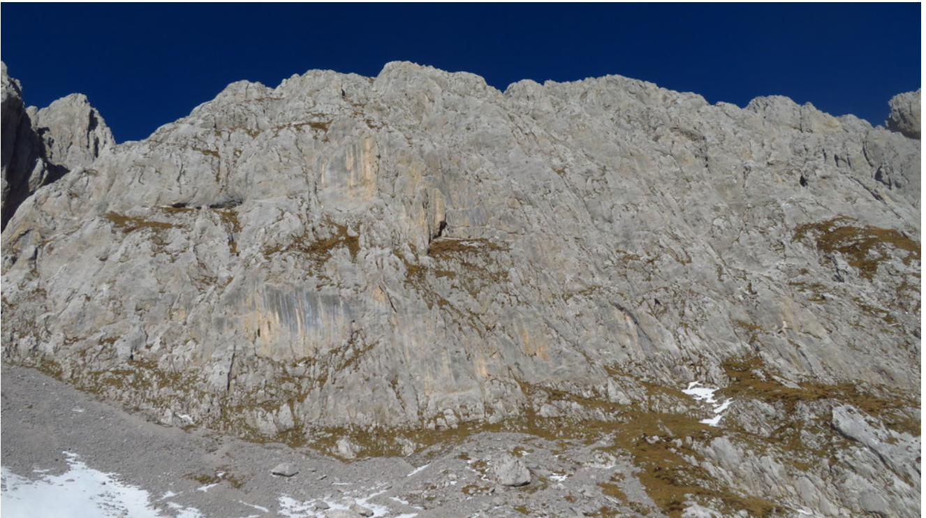
Presolana del Prato