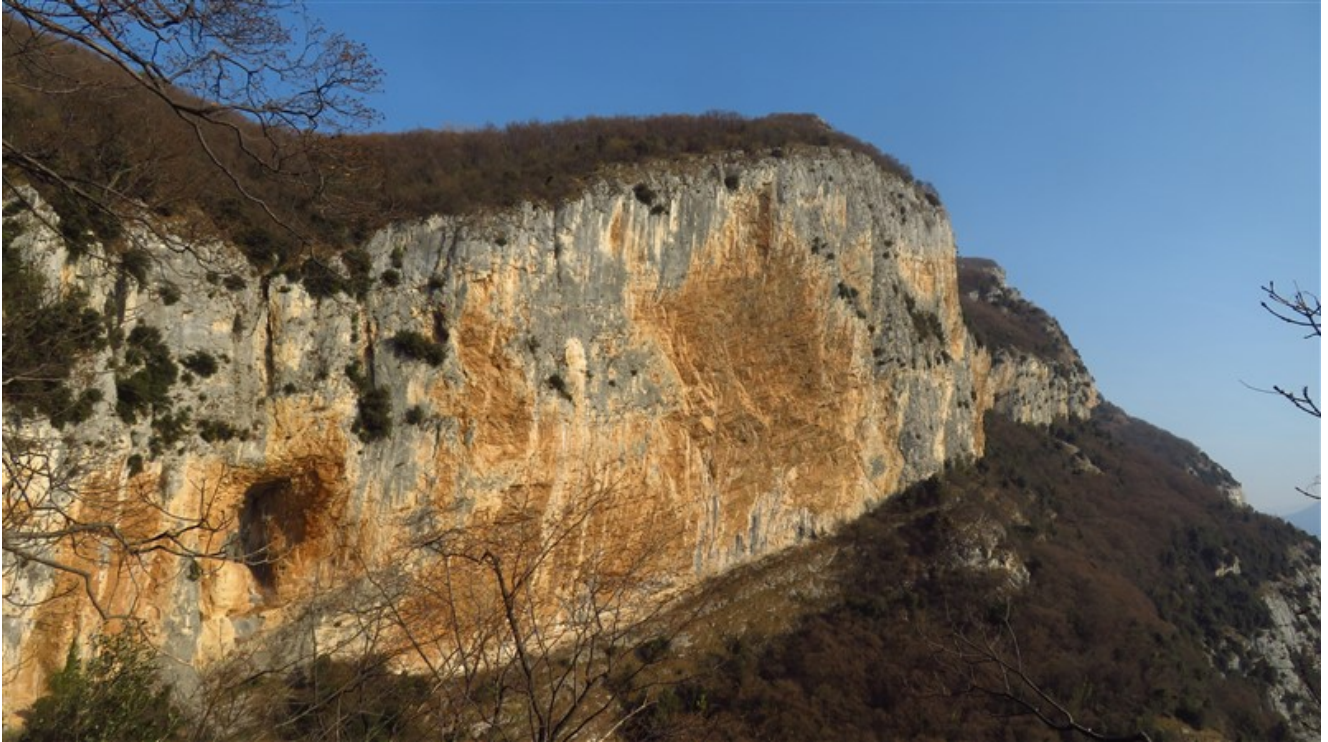
Parete rossa di Castel Presina