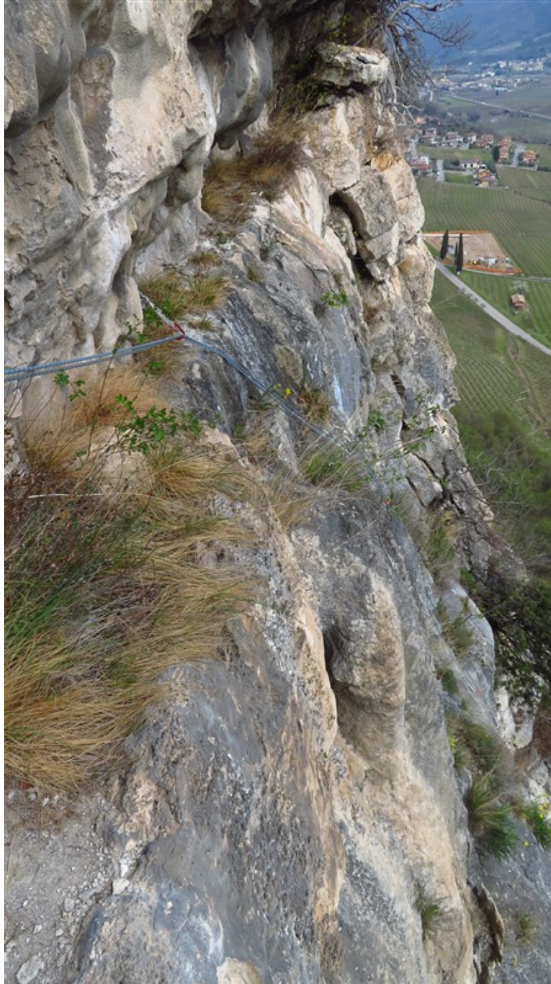
Uscita seconda lunghezza