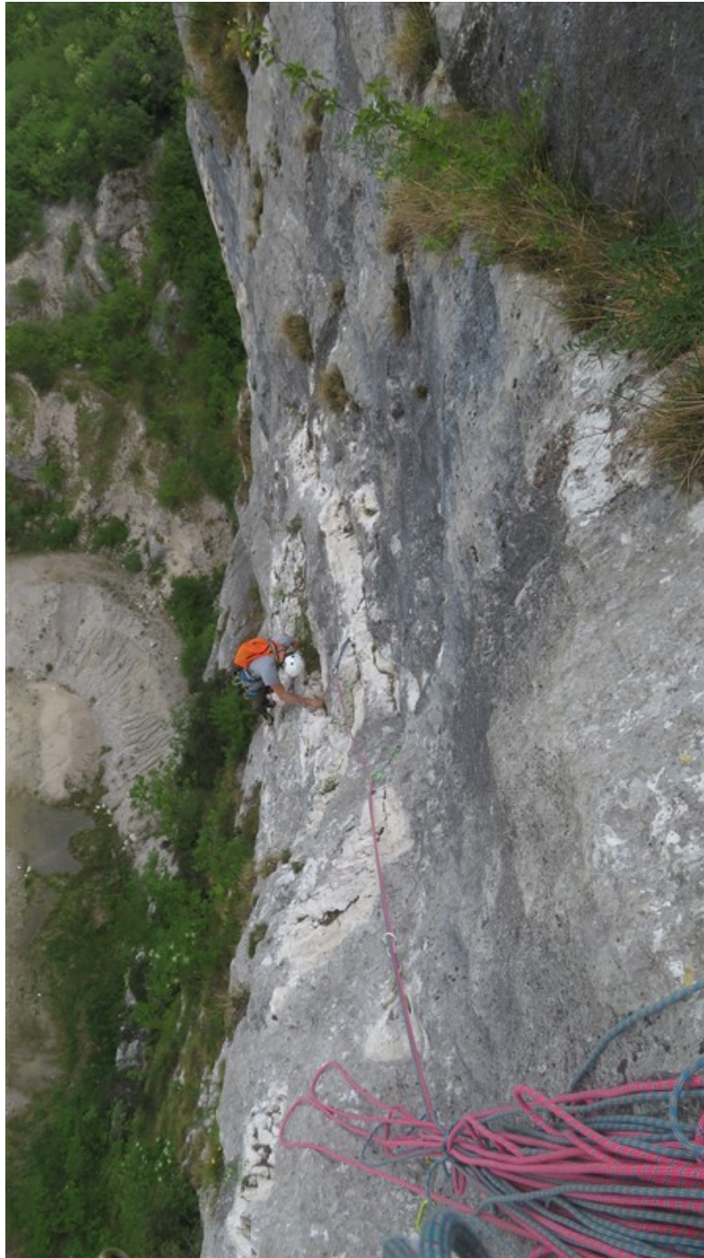
Uscita sesta lunghezza