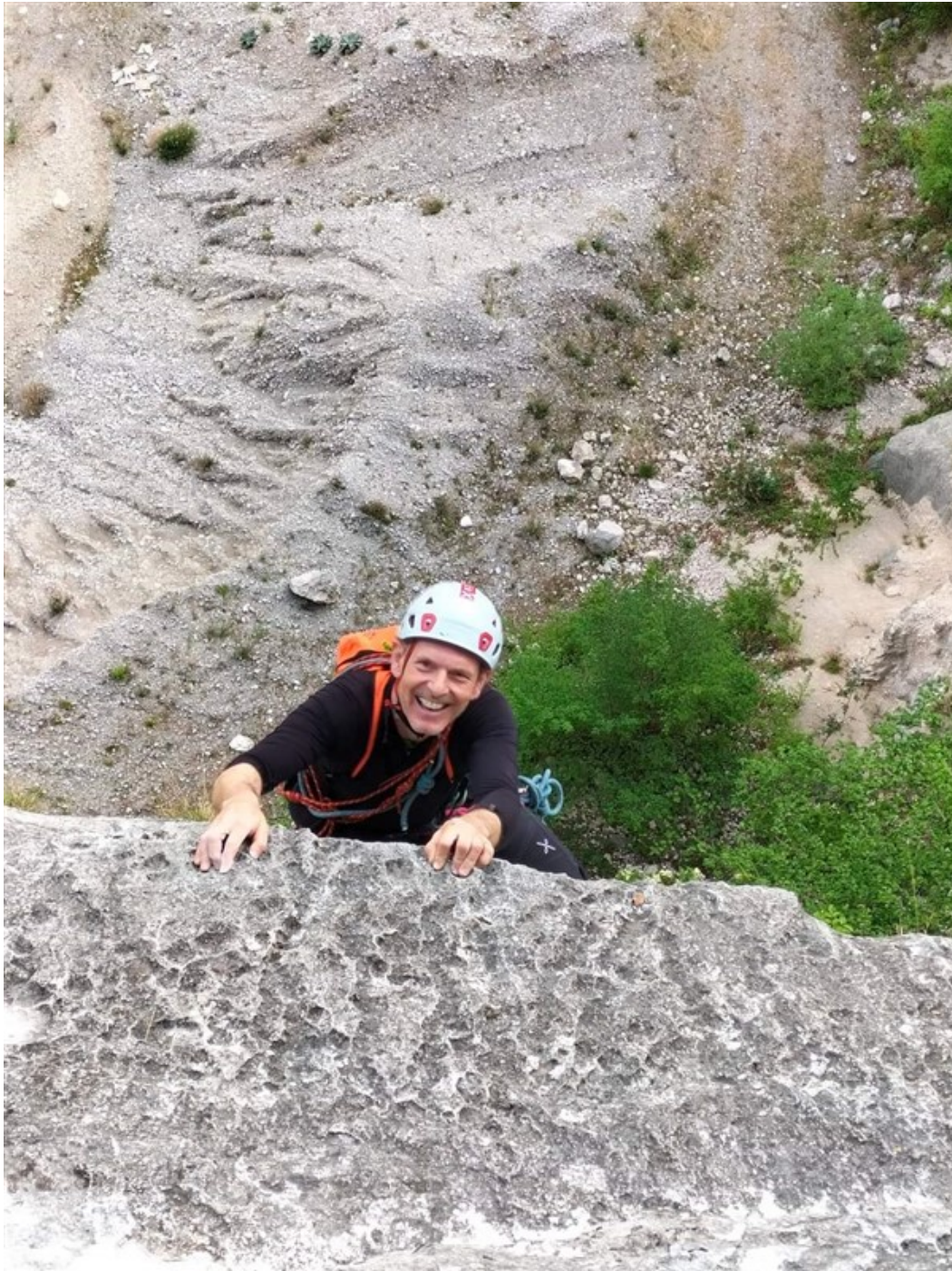
Uscita seconda lunghezza