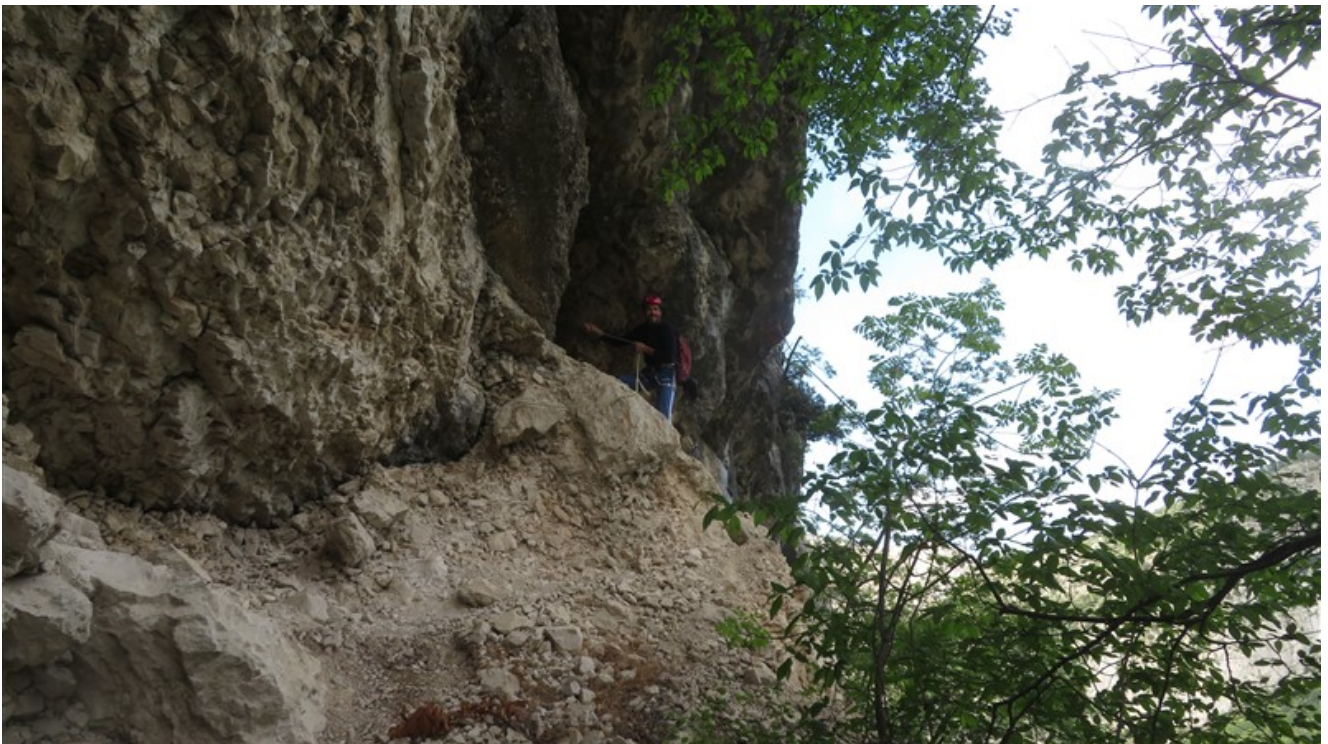
Tratto di avvicinamento con corda fissa