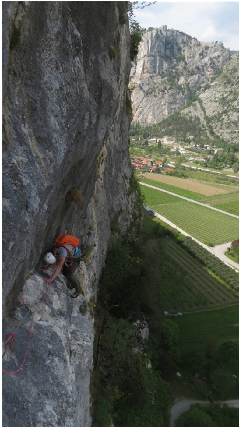
Tratto finale quinta lunghezza