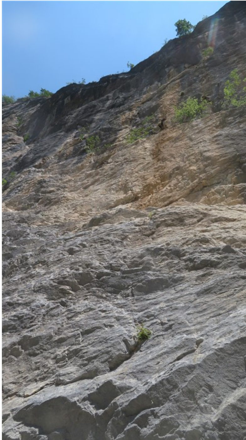
Alla base della prima lunghezza