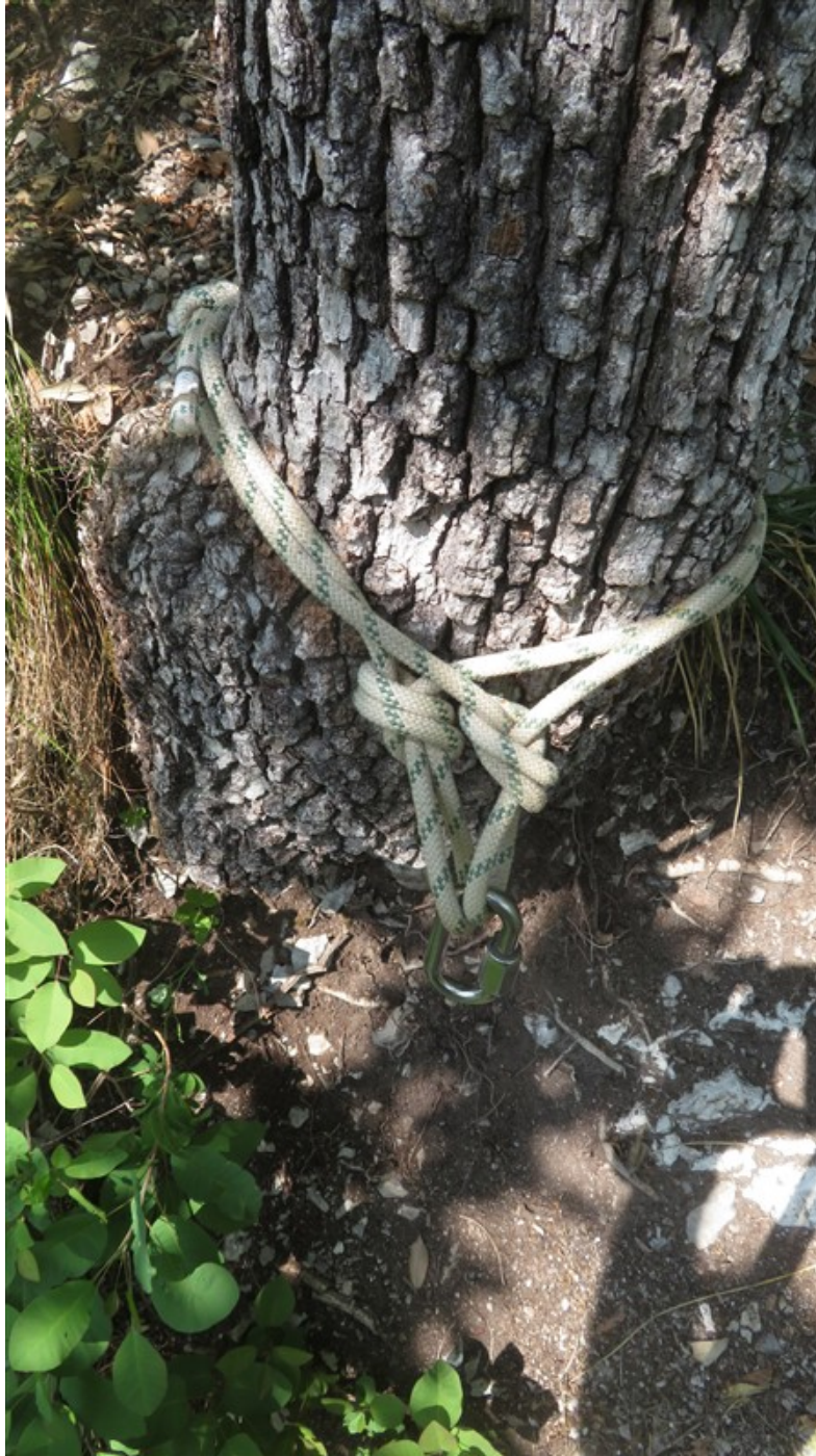
L'albero con cordone per calata