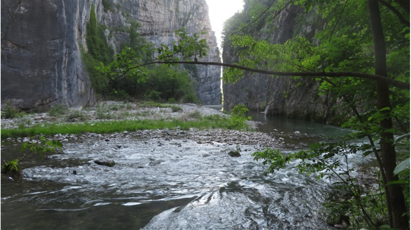
Il punto del guado