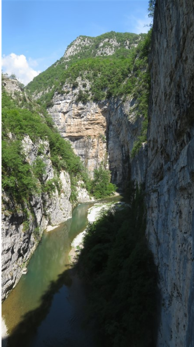
Gola del Limarò