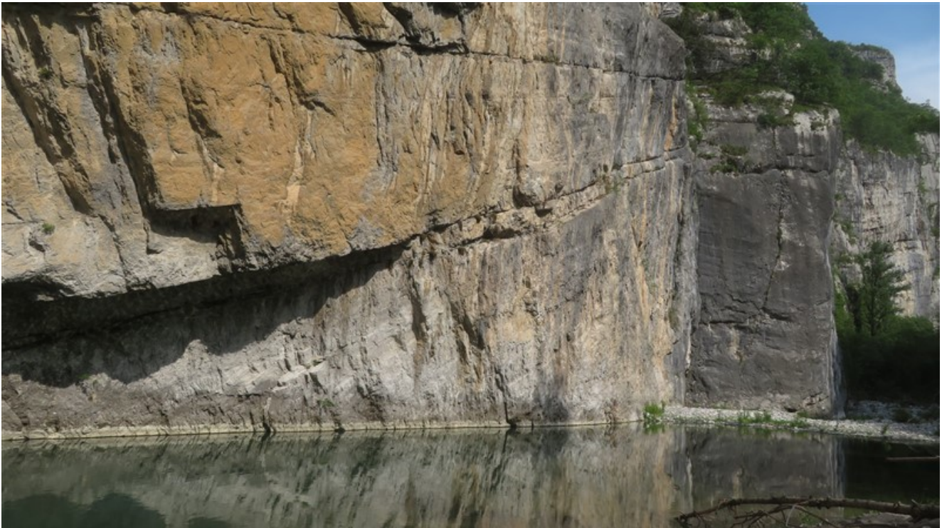
L'attacco della via è a sinistra del diedro grigio