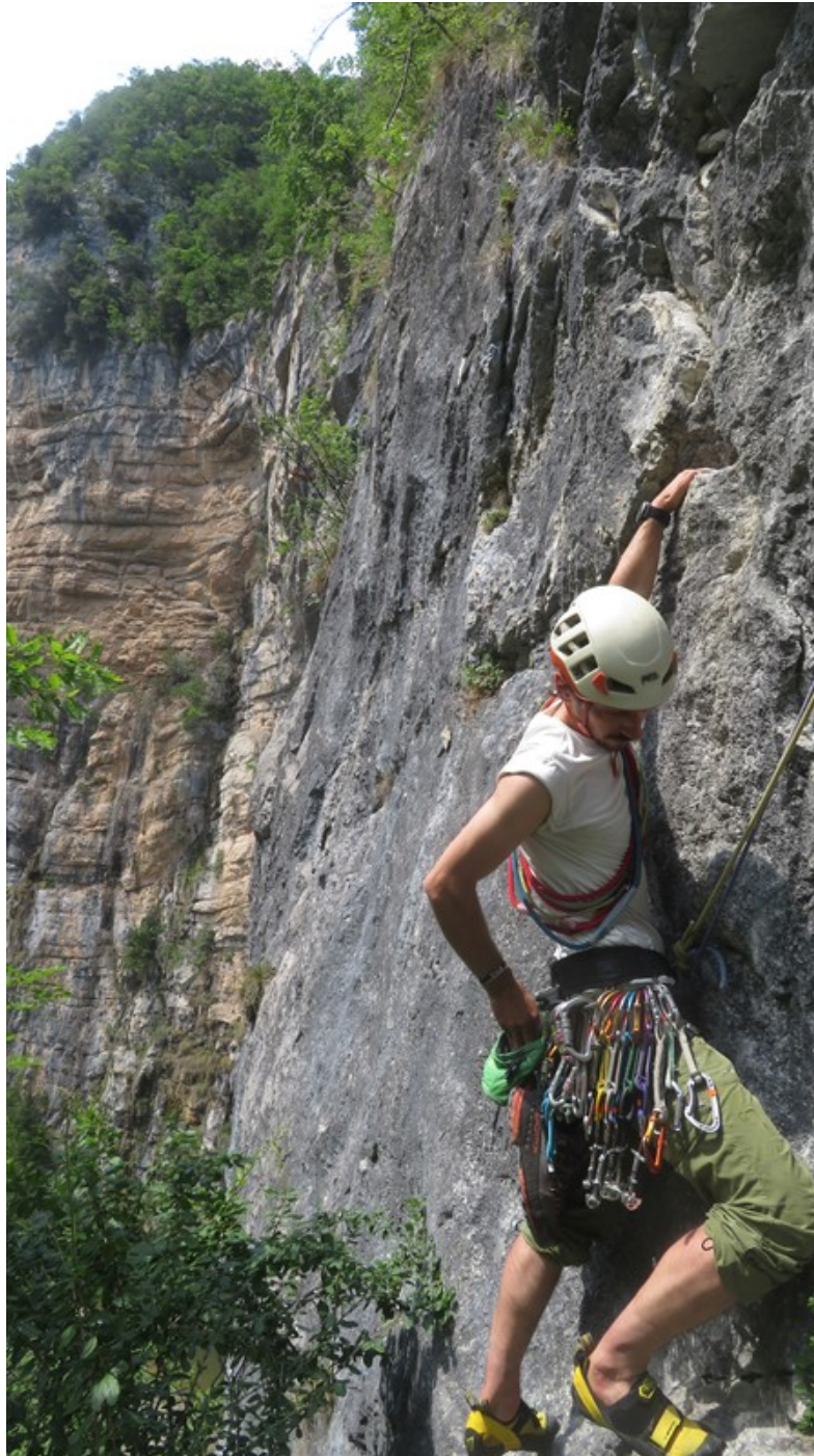
Partenza sesta lunghezza