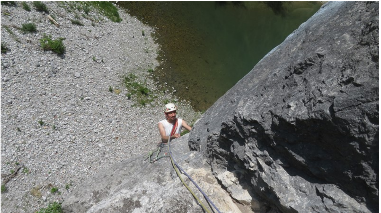
Uscita terza lunghezza