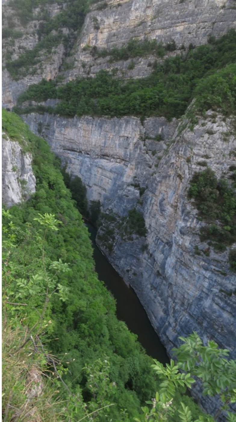
Gola del Limarò