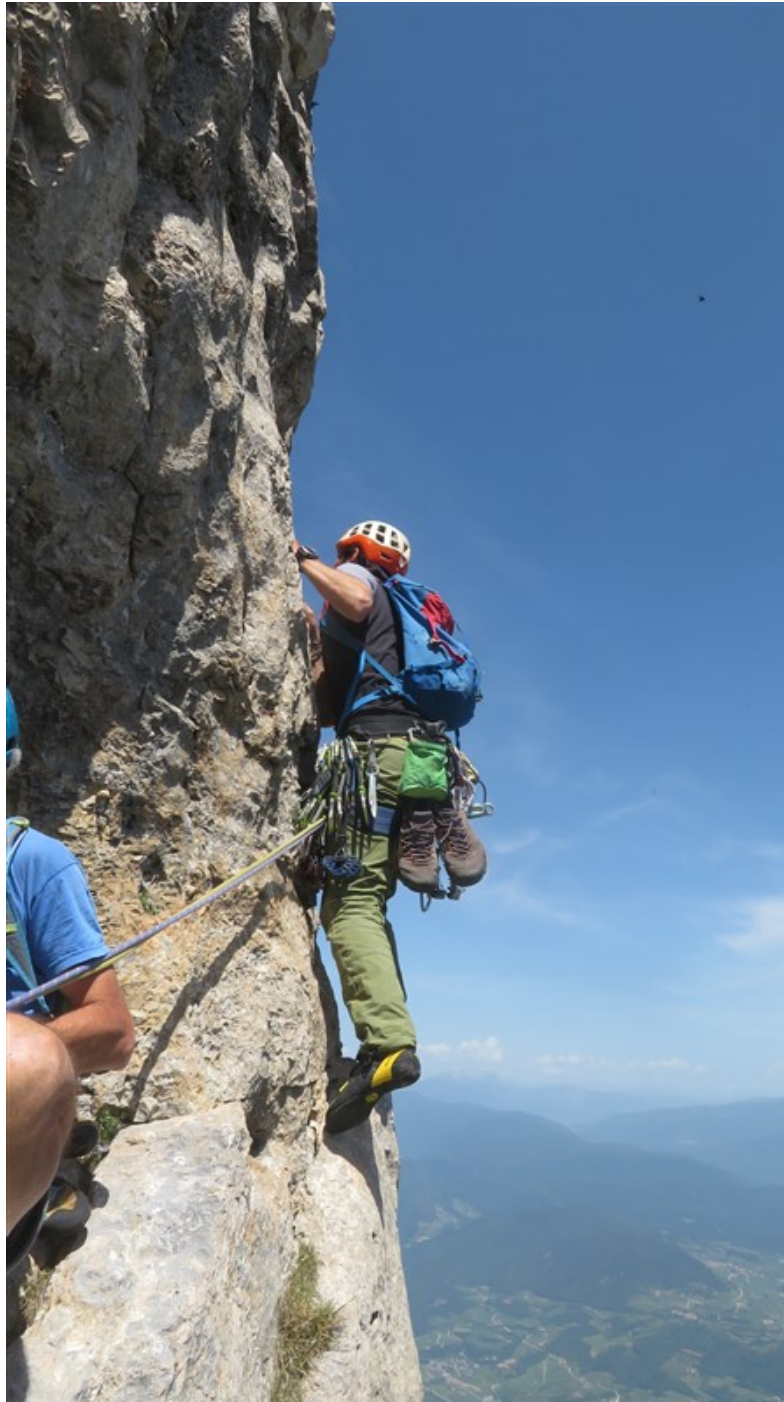
Partenza sesta lunghezza