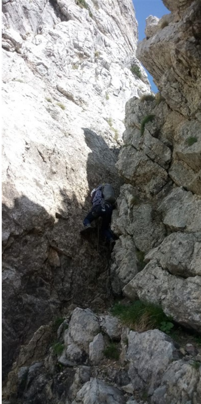
Discesa di una corda fissa nel canale