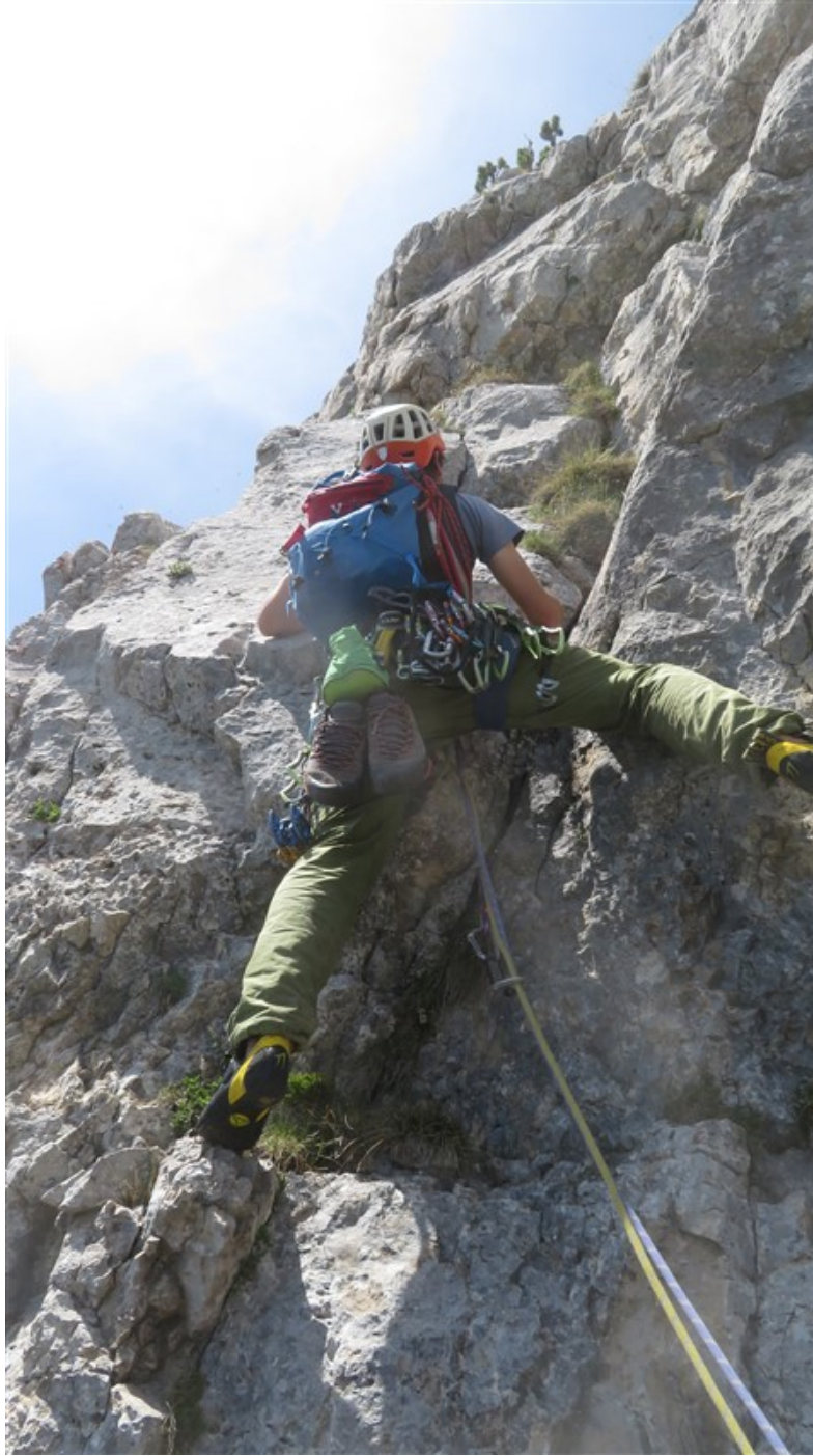
Partenza quarta lunghezza