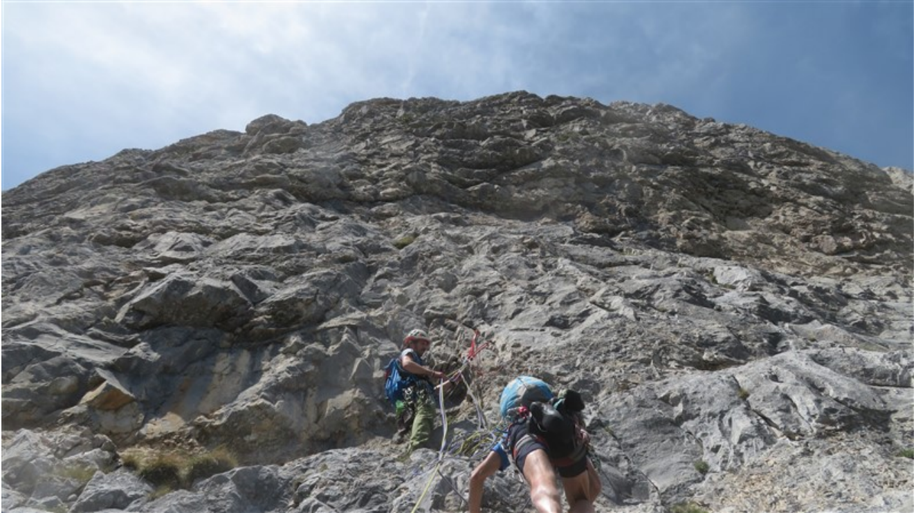
Sosta quarta lunghezza