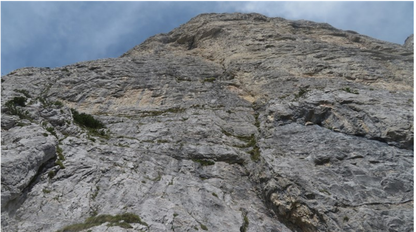
La parete dall'attacco della via, che va verso sinistra