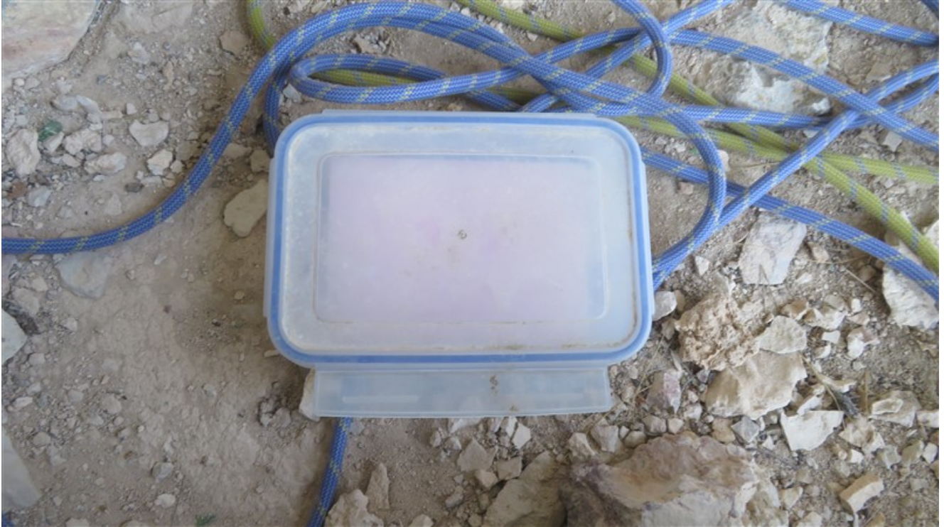
Libro di via