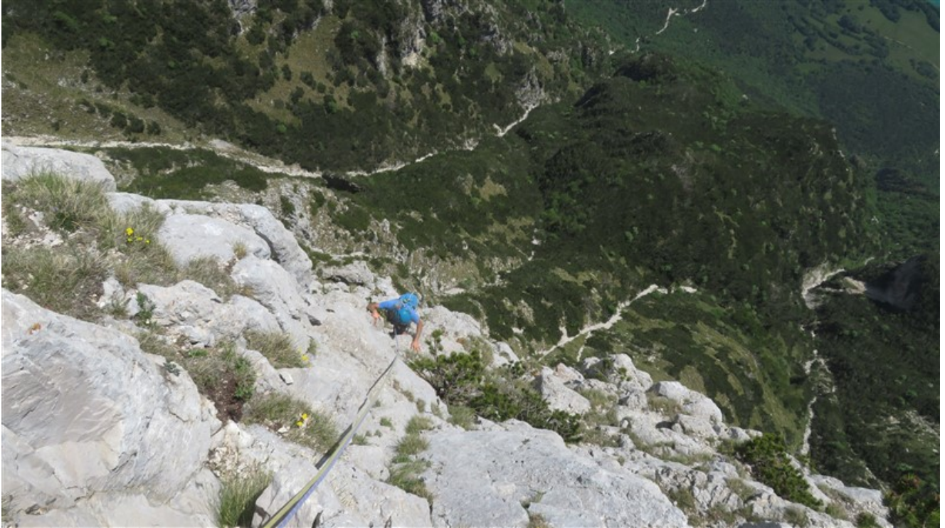
Terza lunghezza, parte finale