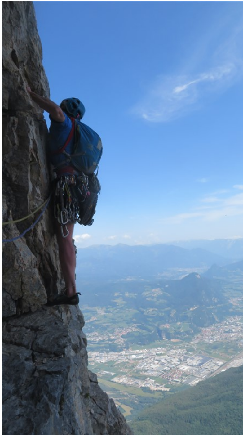
Partenza ottava lunghezza