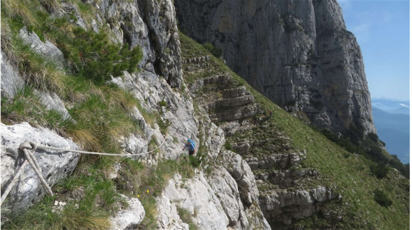
La corda fissa sulla cengia esposta che porta all'attacco