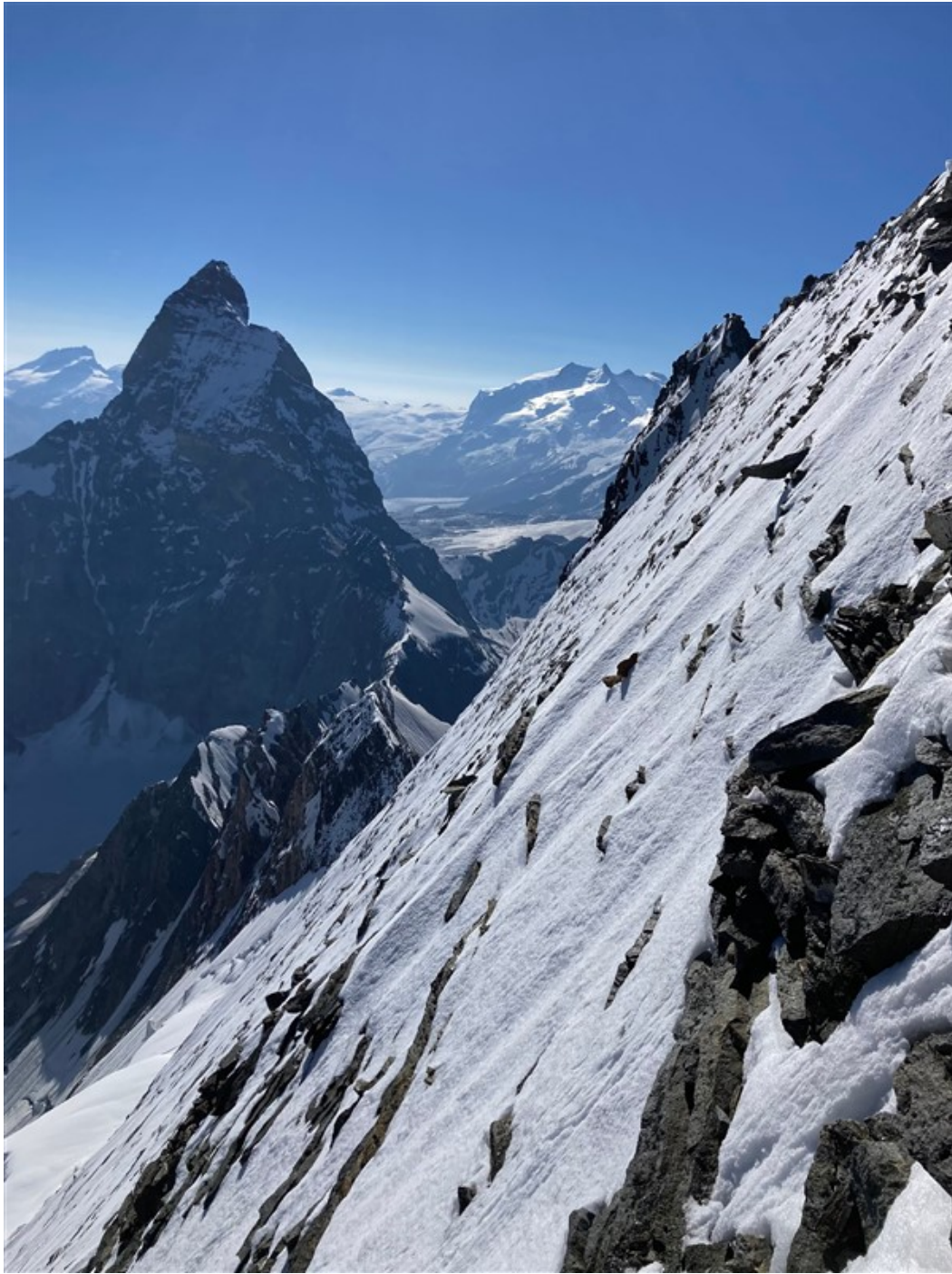
FOTO 4 - Cervino e Monte Rosa dalla Cresta finale