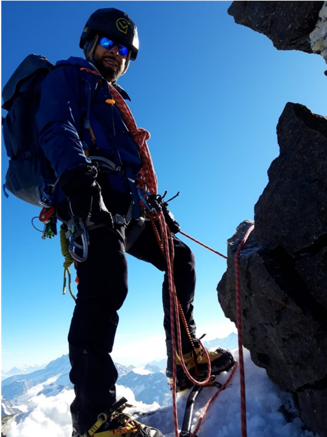
Sulla cresta sommitale