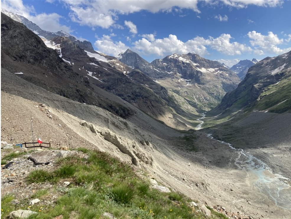
La valle glaciale dal Rifugio Aosta