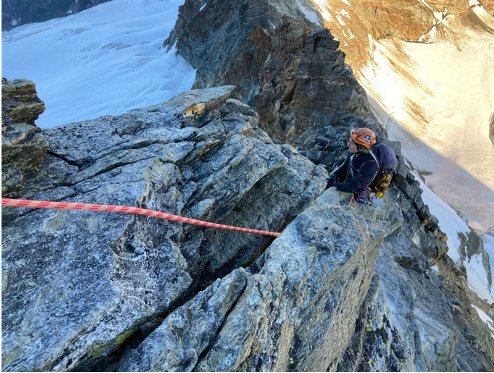
FOTO 2 - Lungo la cresta rocciosa