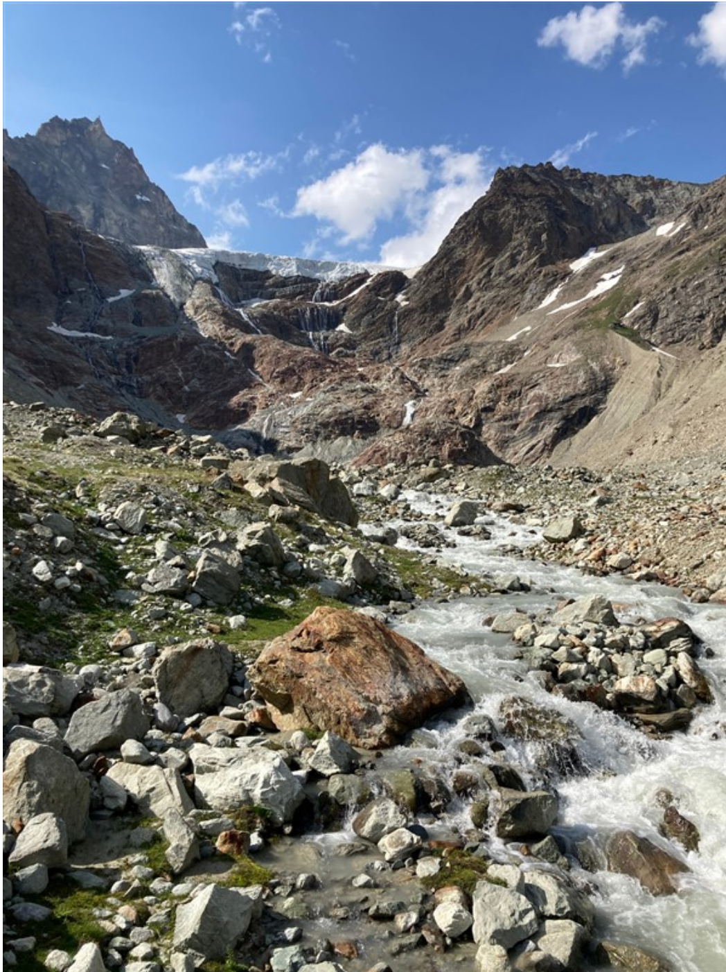
FOTO 1 - Alta Valpelline e Rifugio Aosta sulla destra