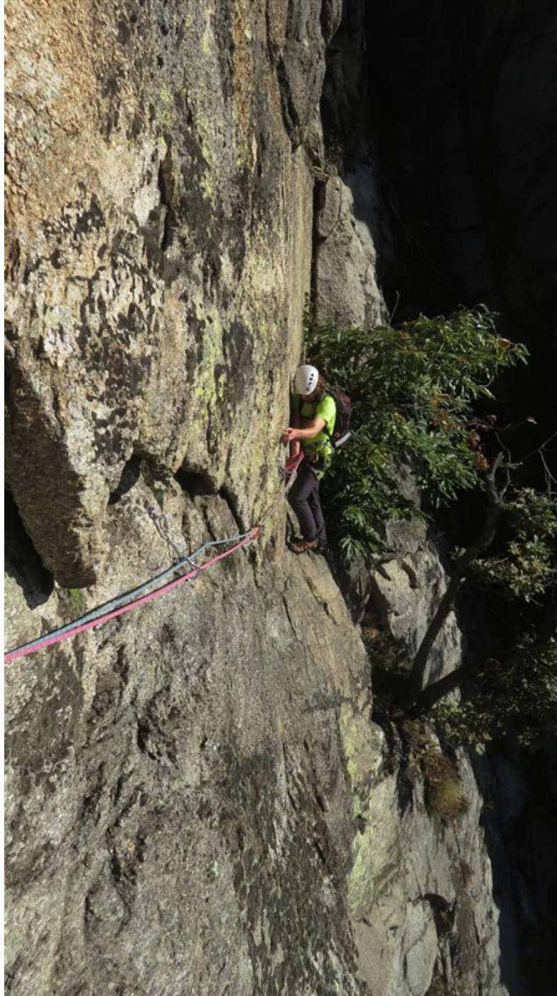
Quarta lunghezza (primo tiro di Analcolica)