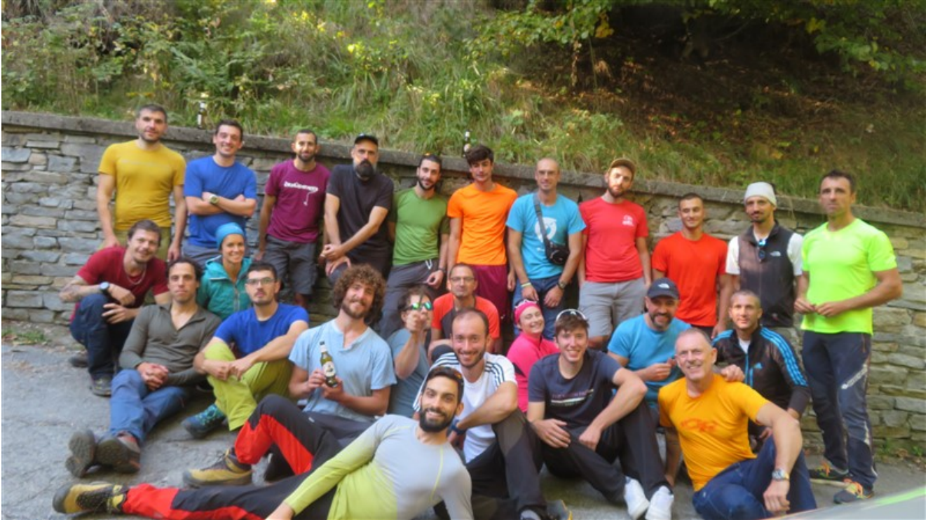
Il gruppo del corso A2-2022, uscita Rocca Sbarua