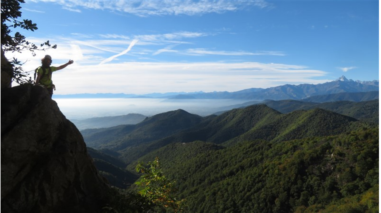
In sosta alla fine di Osteria