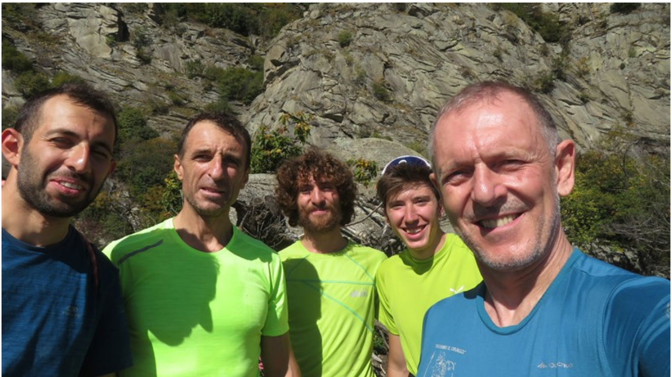
Le due cordate