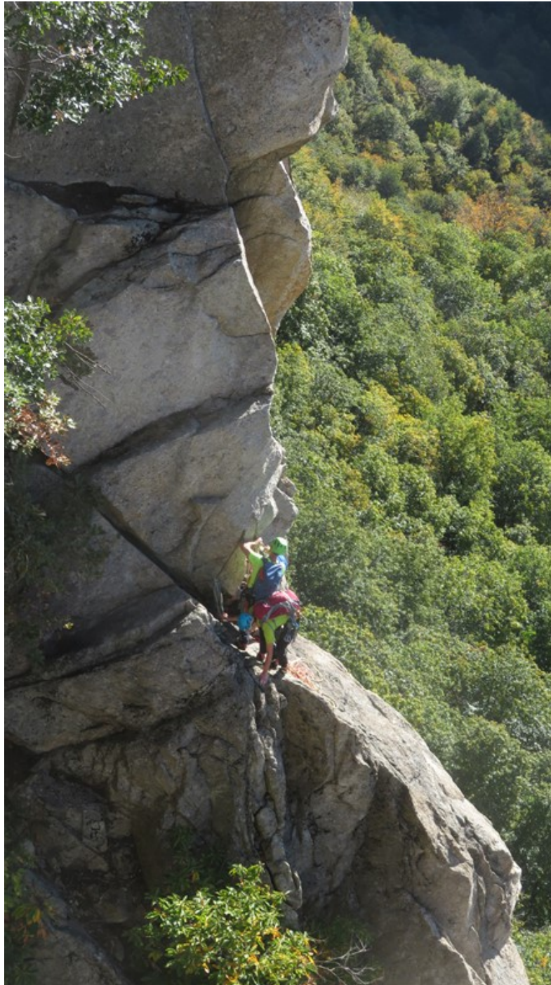
In sosta alla fine di Osteria