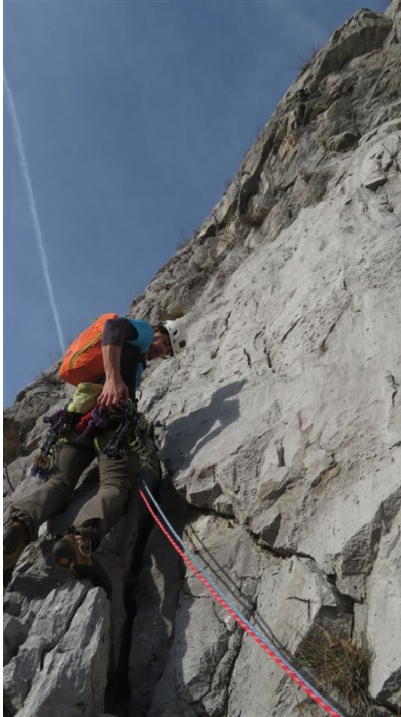
Claudio all'inizio del quinto tiro