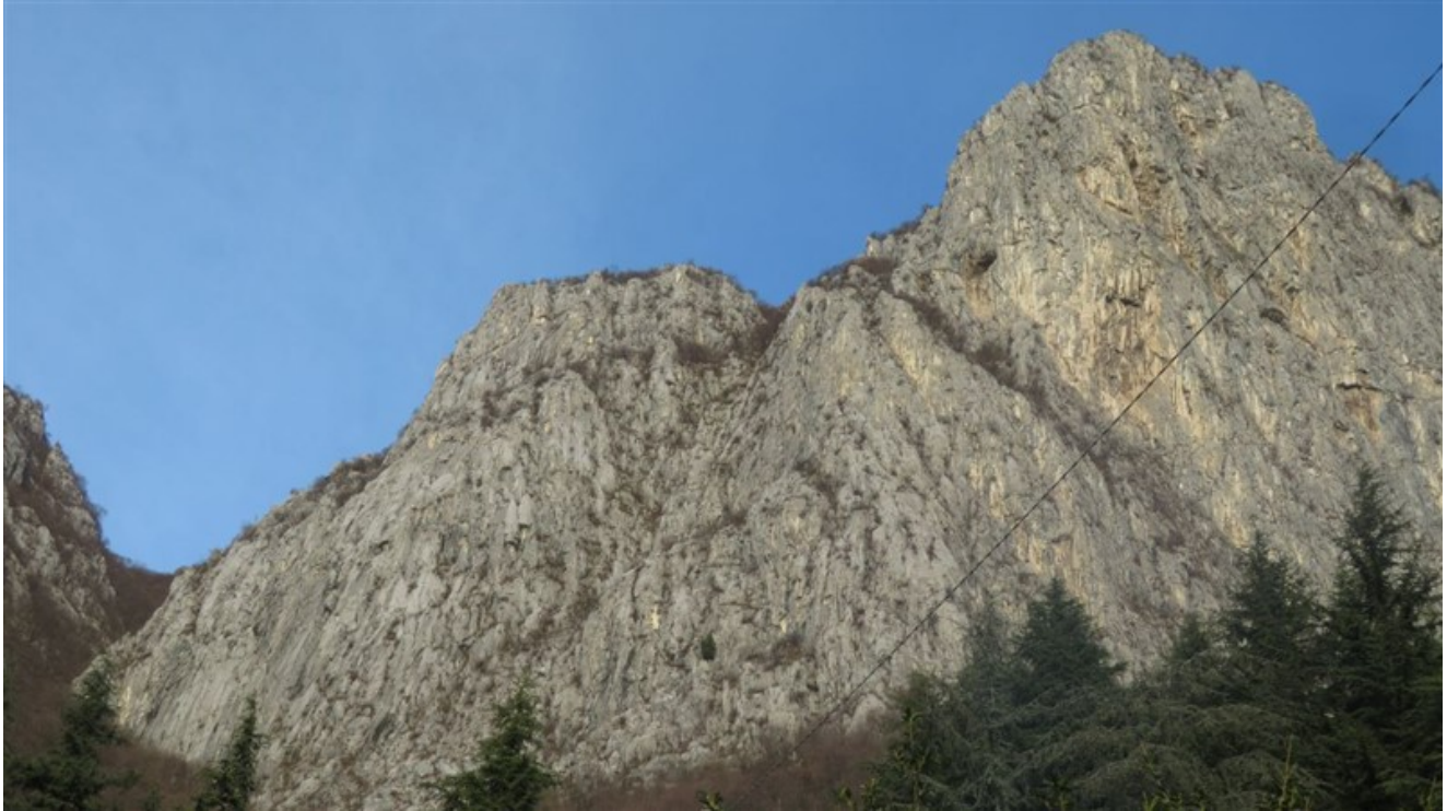
Medale e Antimedale