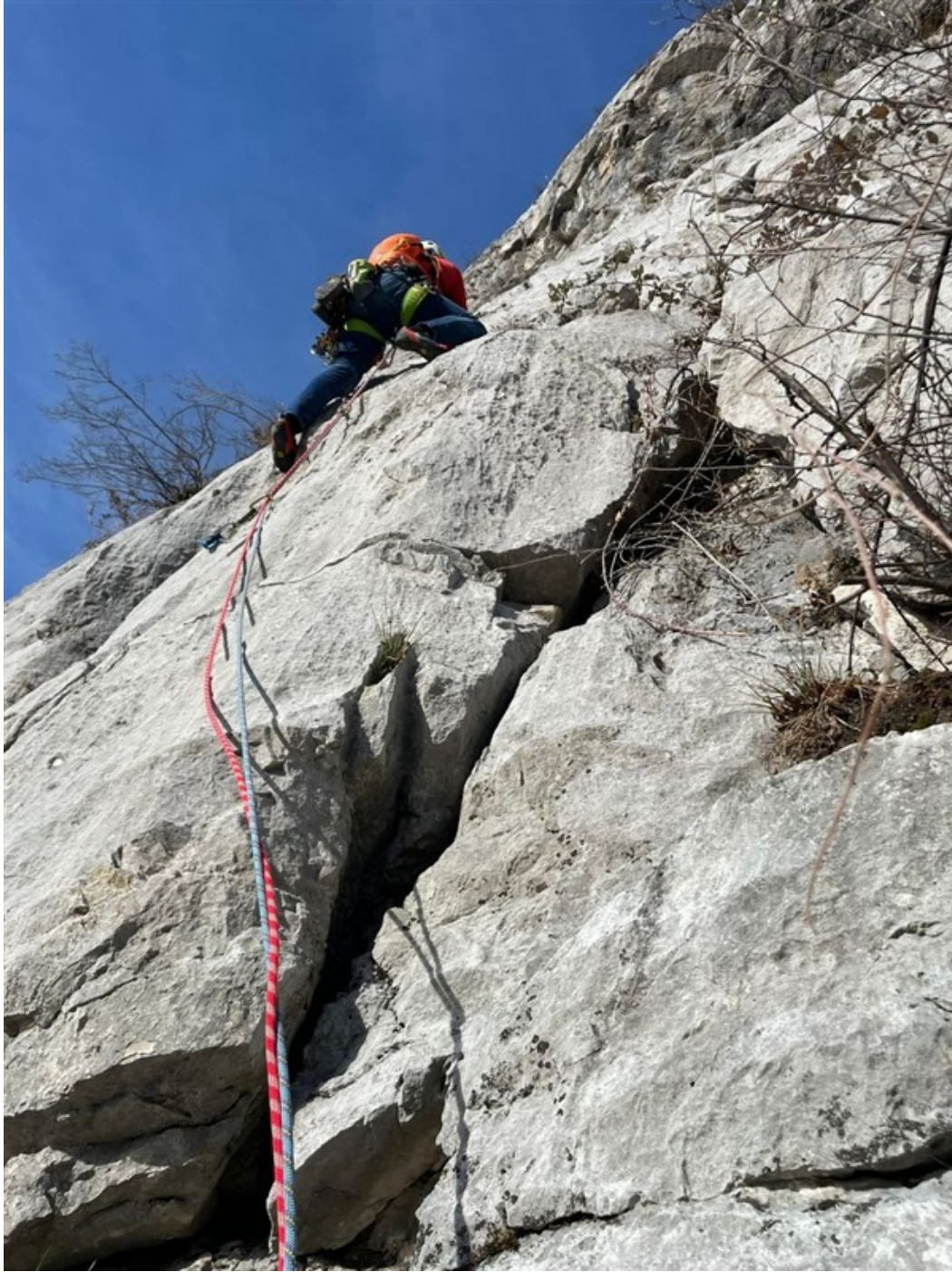
Walter attacca il quarto tiro