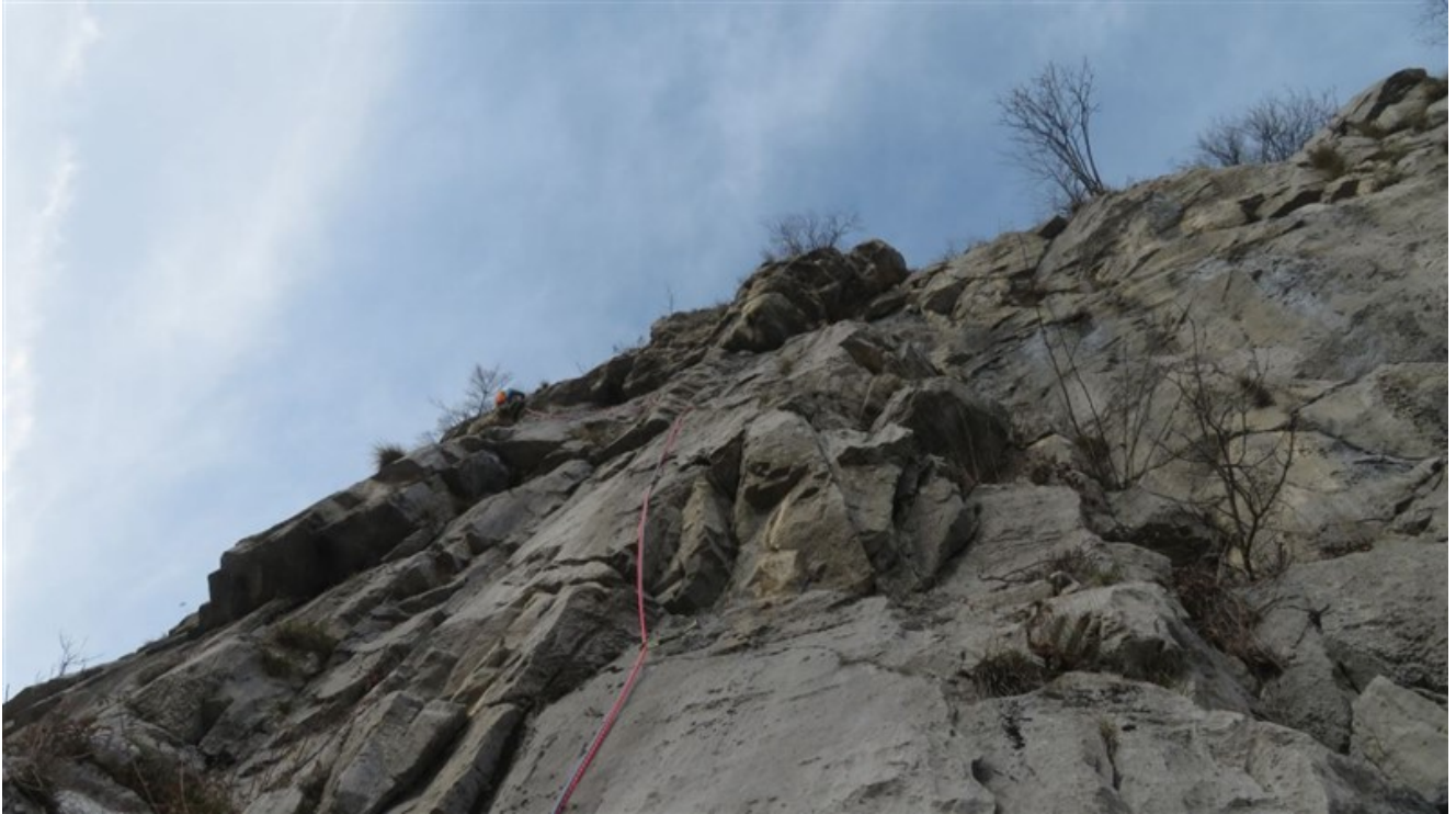
Il sesto tiro con Claudio in uscita dallo strapiombo finale