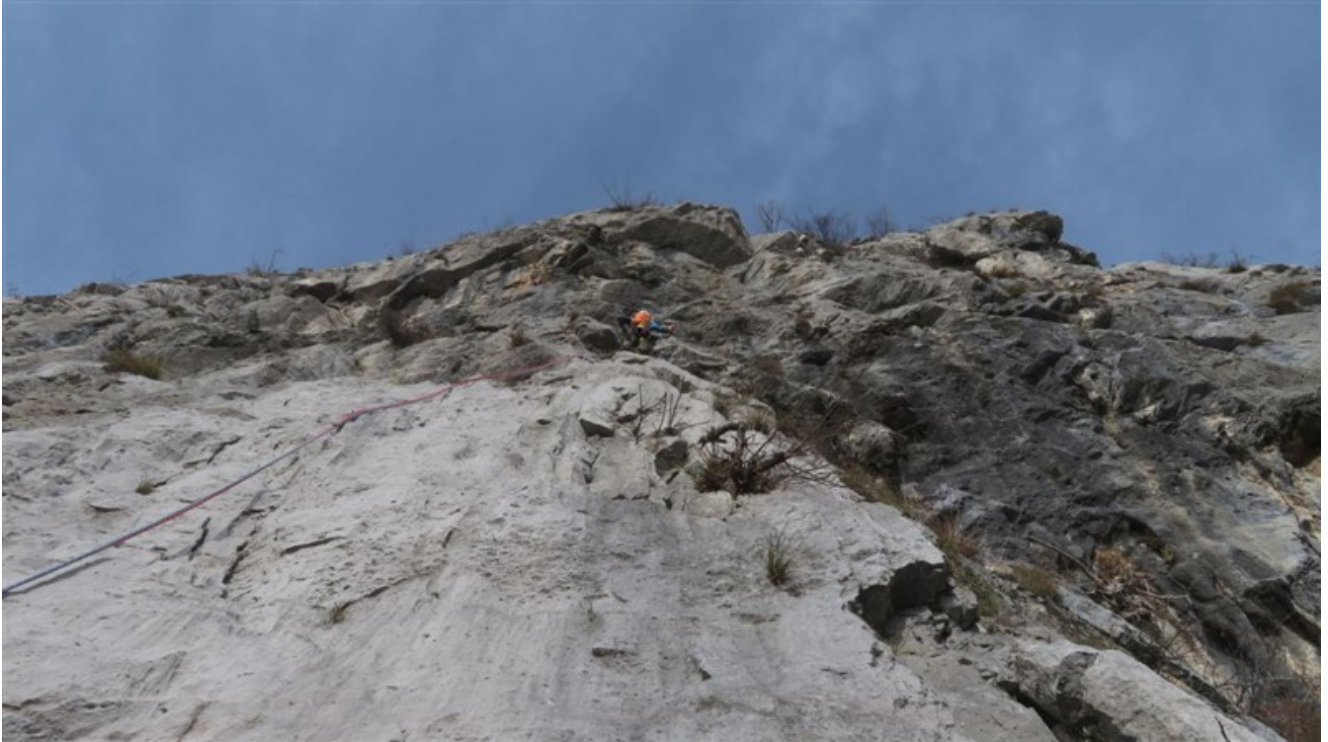
Il quinto tiro