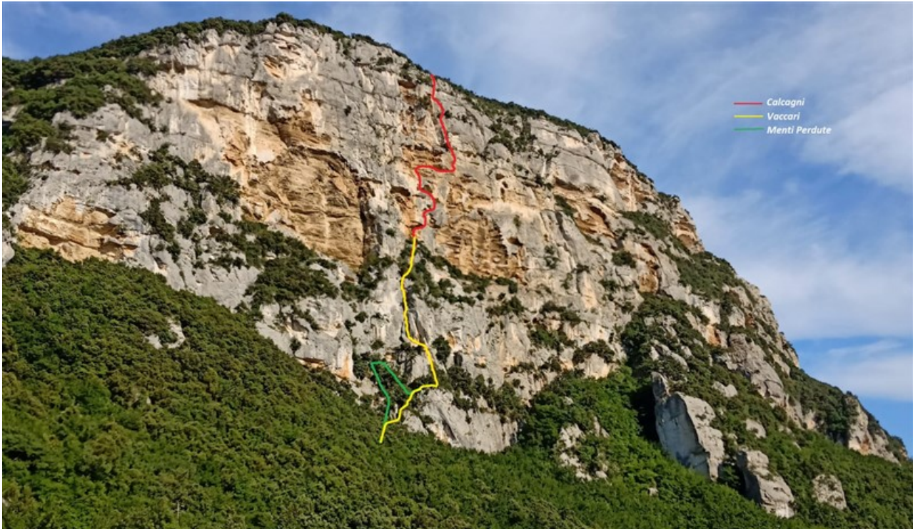
Tracciato indicativo (by Walter Polidori)