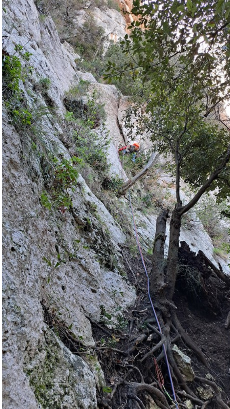
Attacco e prima lunghezza