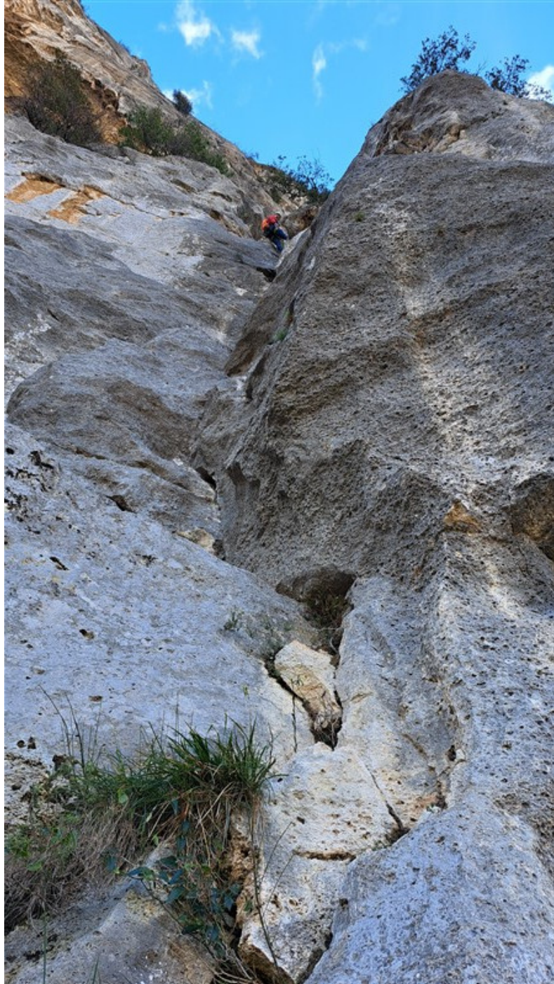
Il diedro della quarta lunghezza