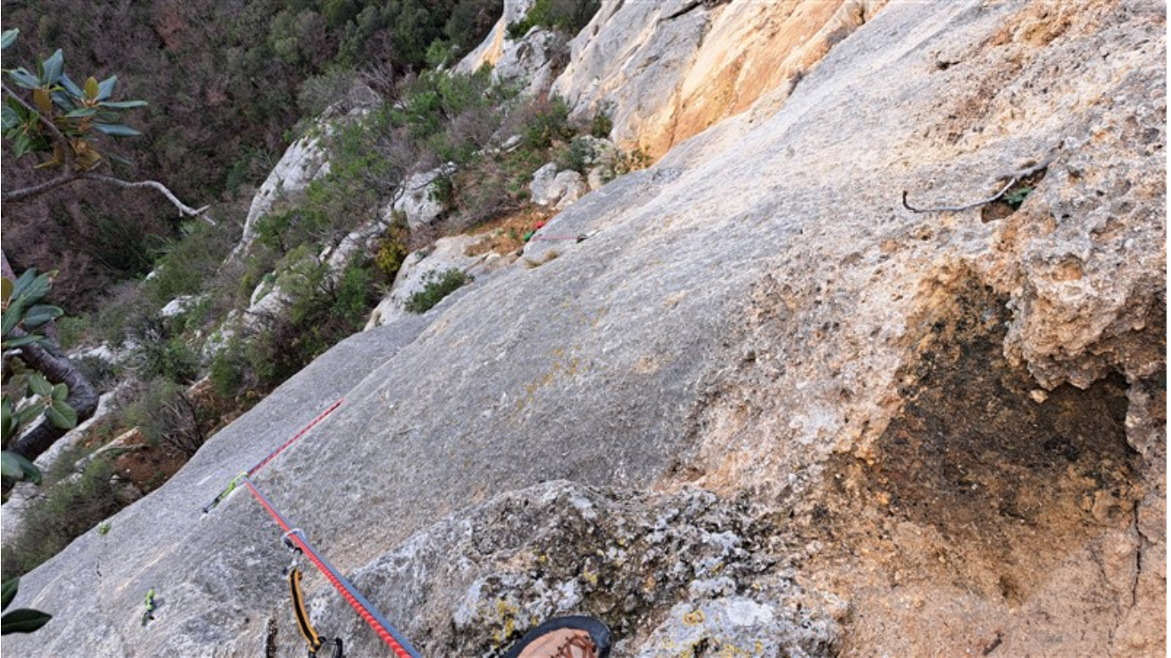
All'uscita della settima lunghezza