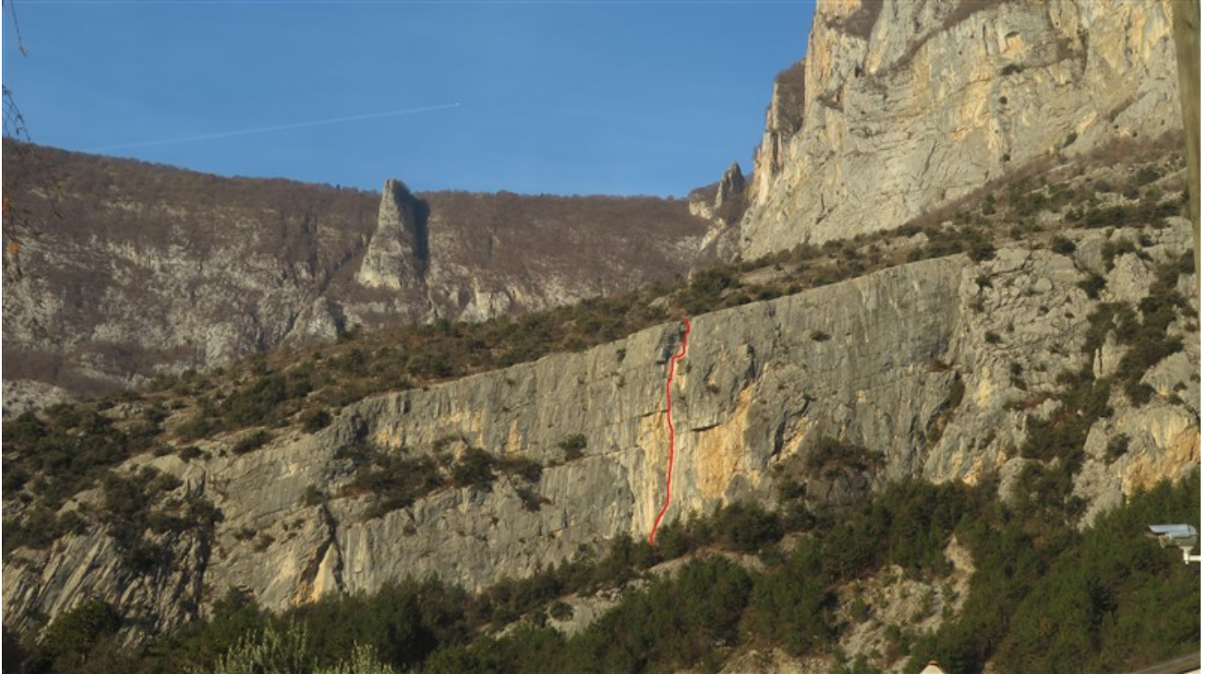
Muro delle Camerete