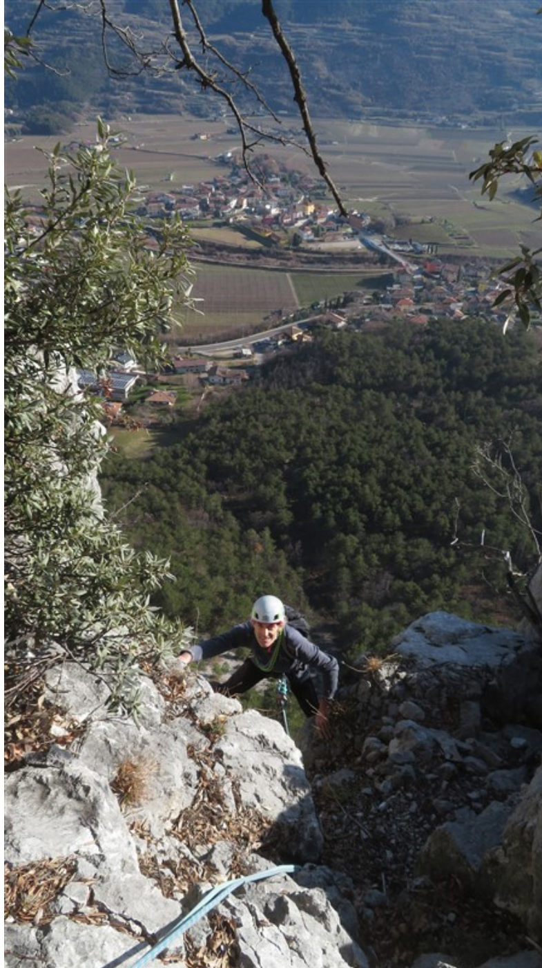
Uscita dalla terza lunghezza