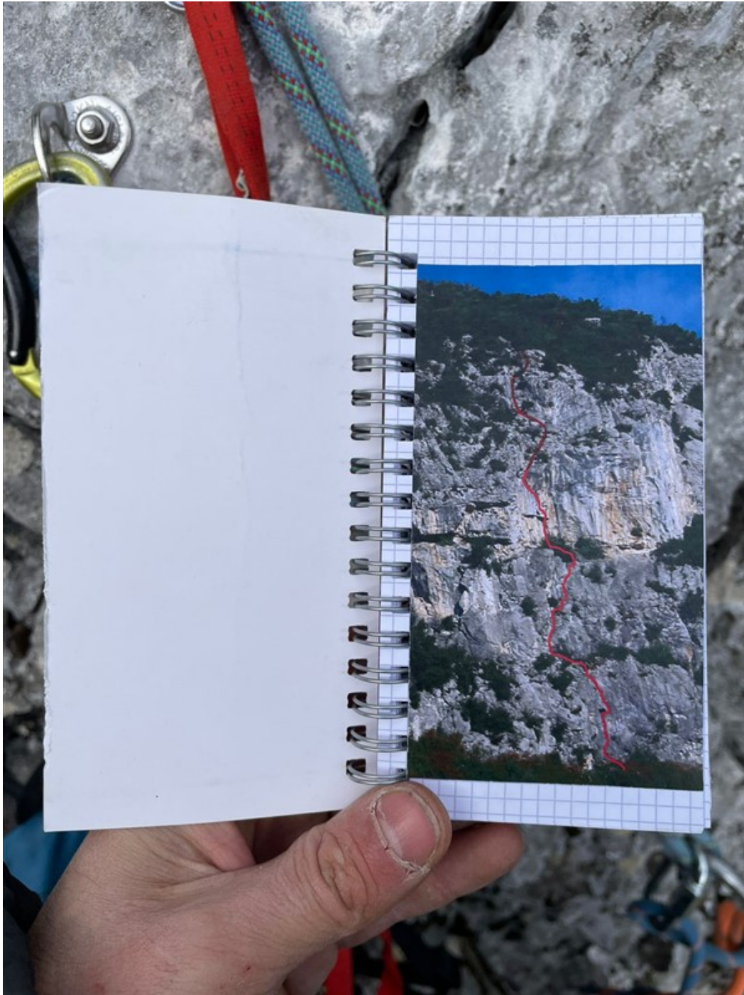
Libro di via