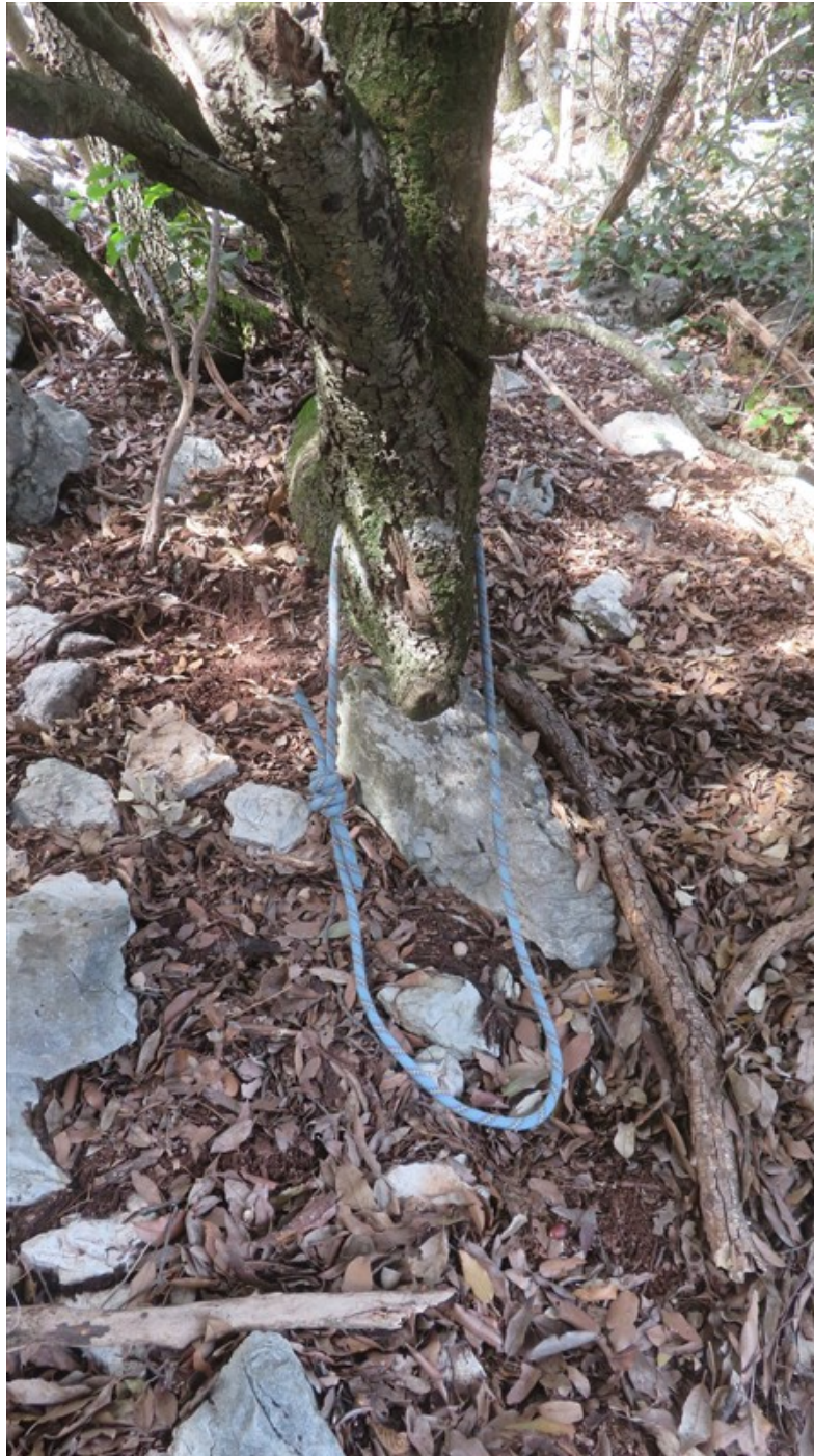
Sosta ottava lunghezza