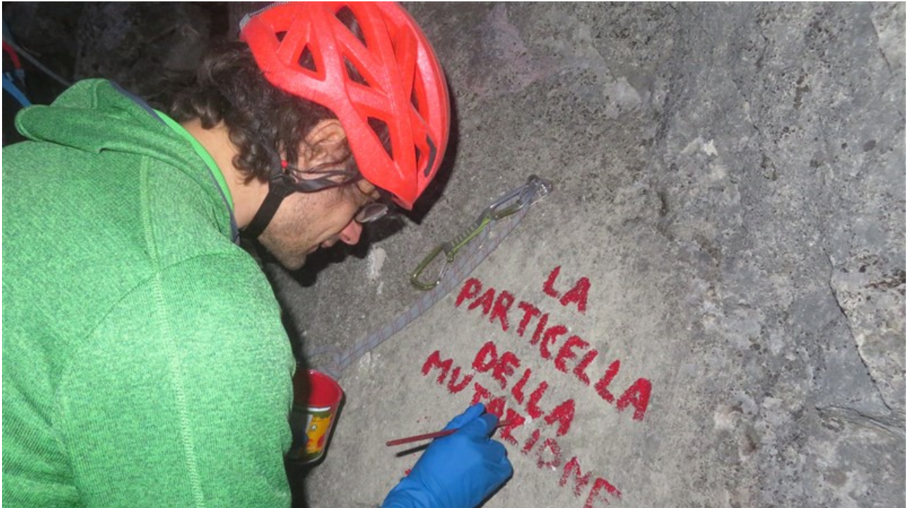
Scritta alla base della via