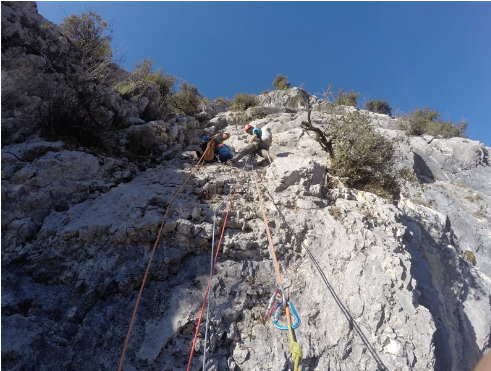
Sosta quarta lunghezza