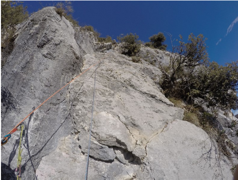
Sesta lunghezza dopo la pulizia