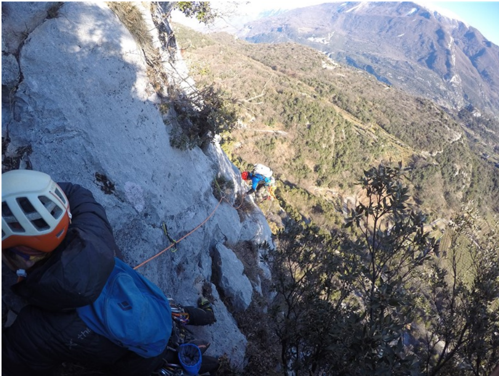
Parte finale quinta lunghezza