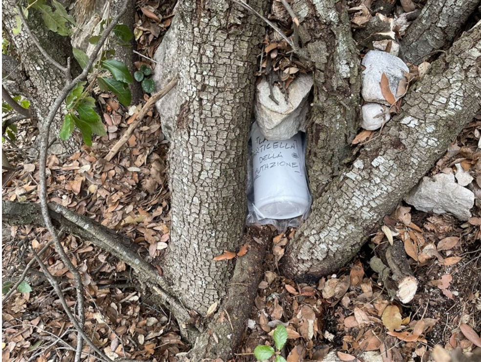
Libro di via