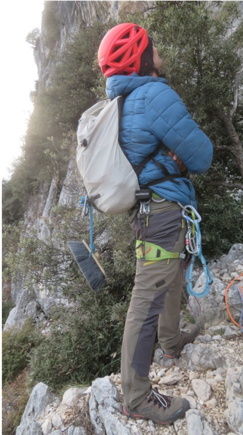
Tenuta da pulizia