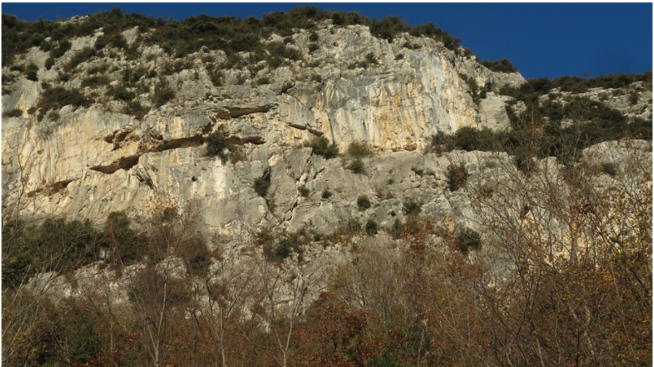
La porzione di parete dove sale la via