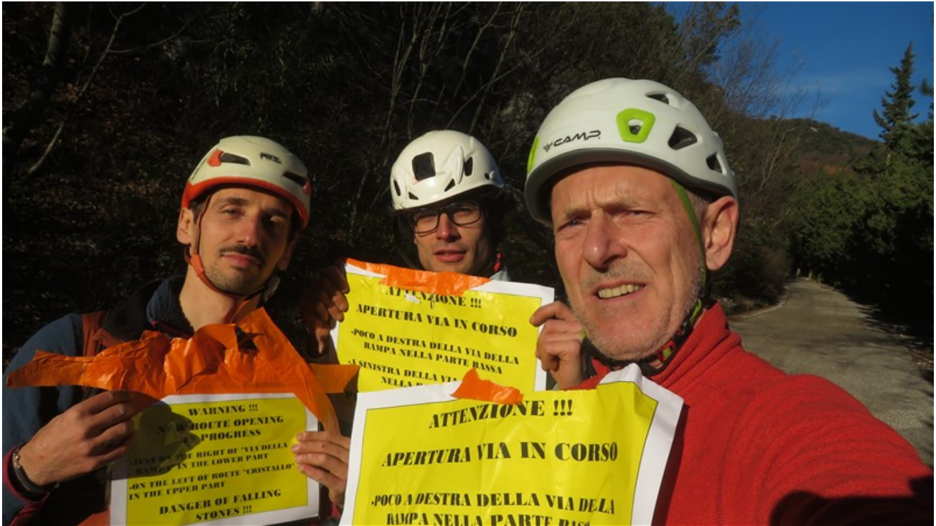
Cartelli di warning durante apertura e pulizia