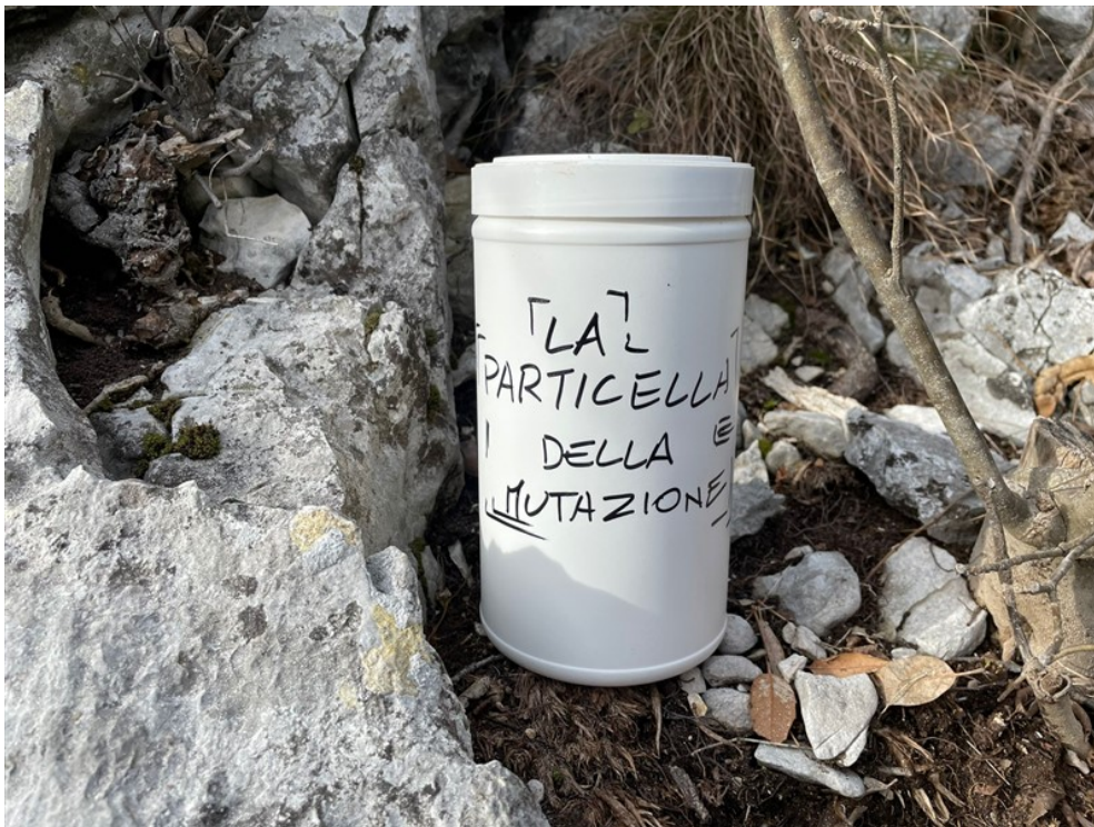
Libro di via