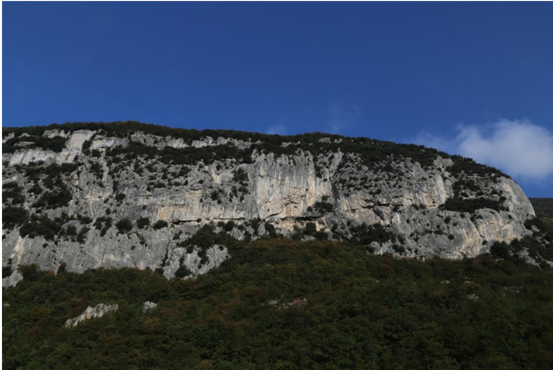
Parete di Padaro