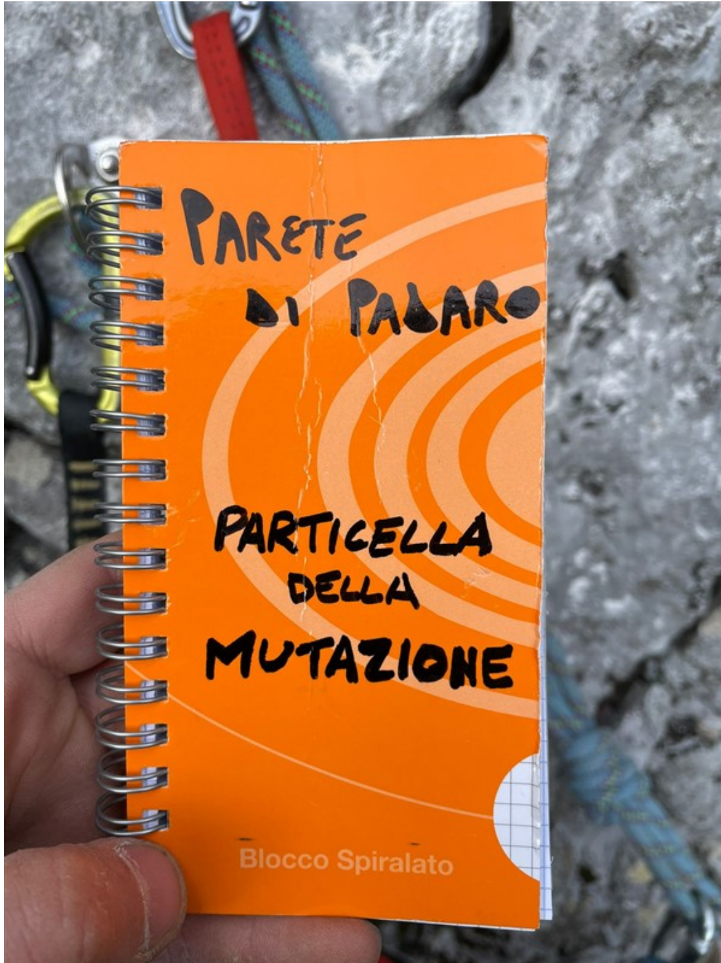
Libro di via