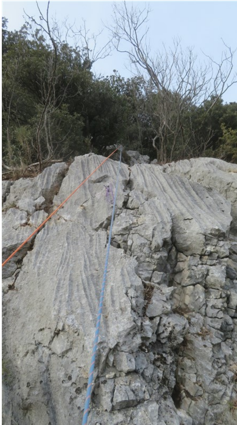
Il bel muretto finale della settima lunghezza