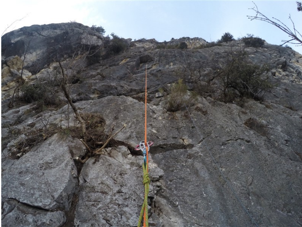
Prima lunghezza dopo la pulizia