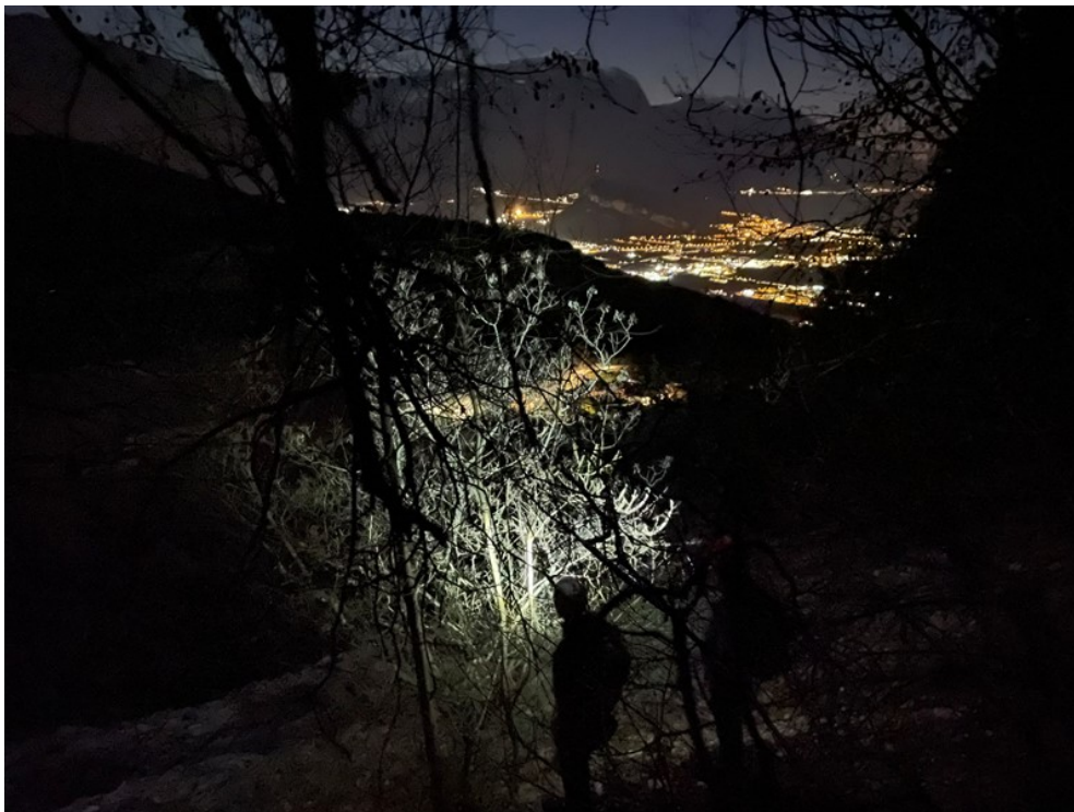
Discesa al termine della via