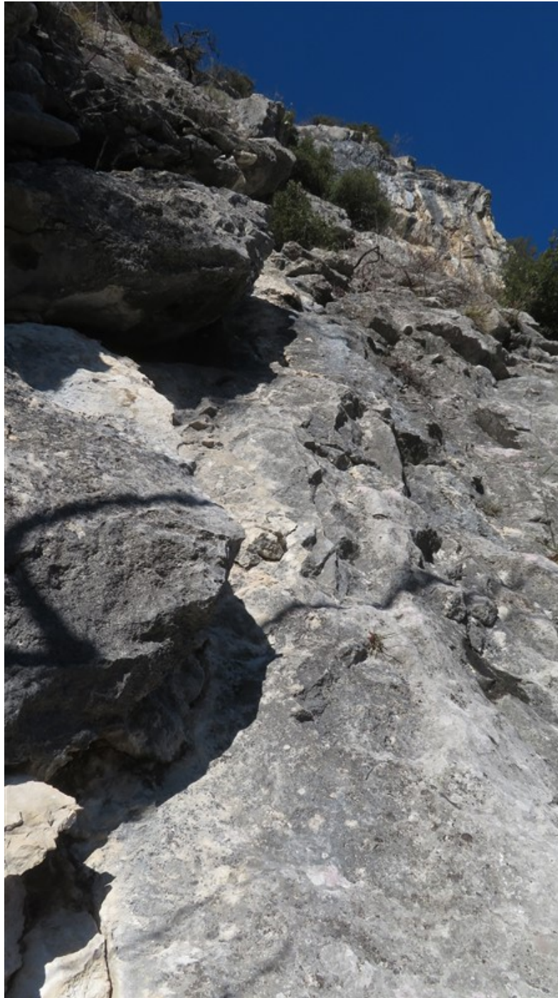
Seconda lunghezza dopo la cengia