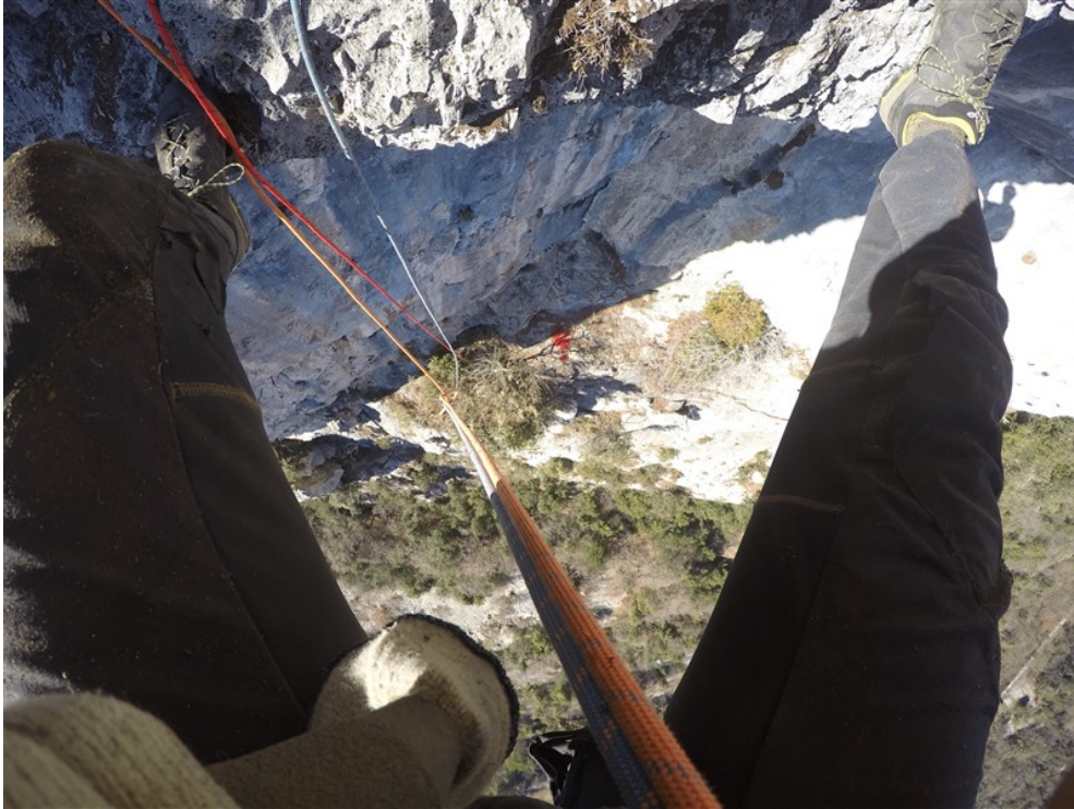
Quarta lunghezza, uscita dal tetto