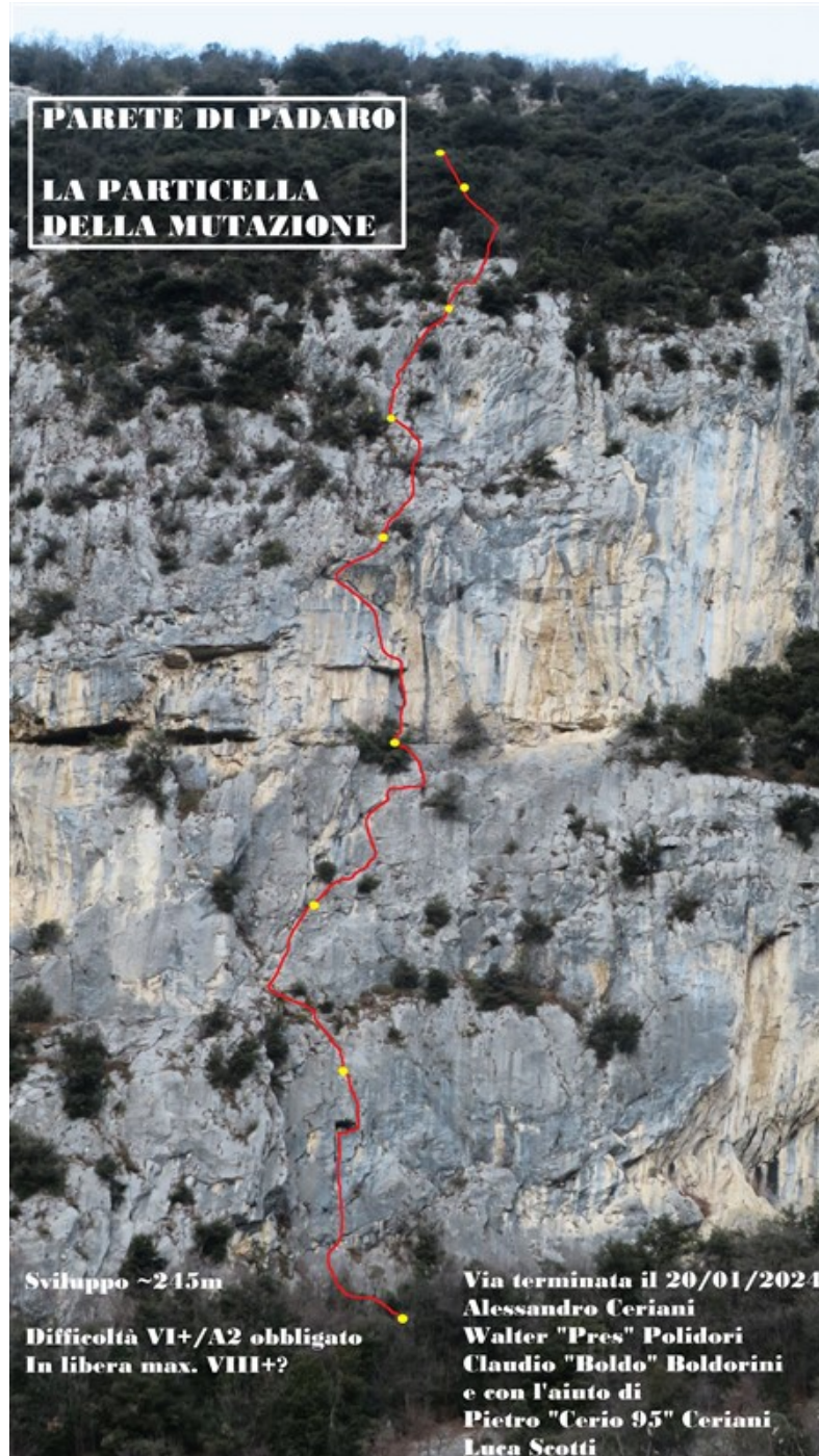
Parete di Padaro - La Particella della Mutazione