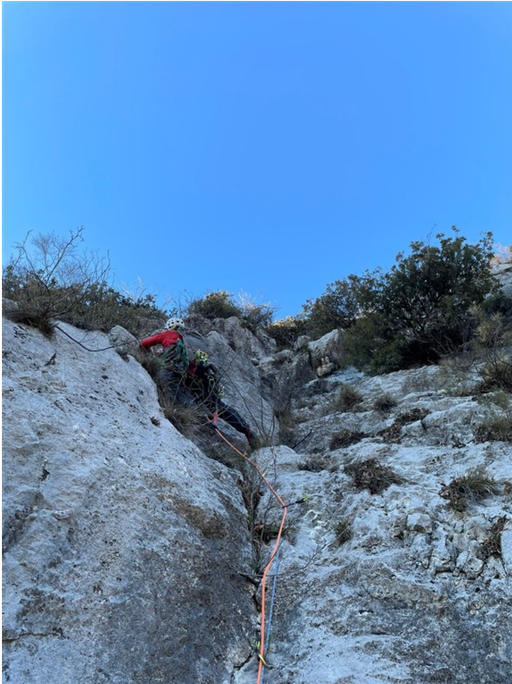
Sesta lunghezza in apertura