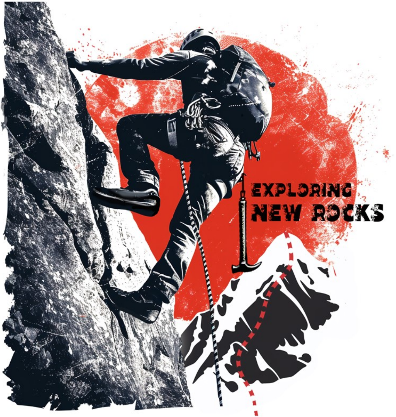
Logo New Rocks