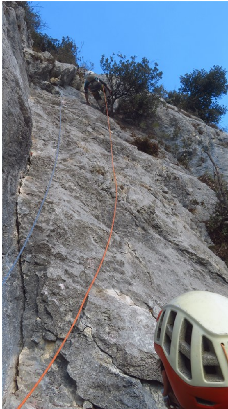
Sesta lunghezza dopo la pulizia