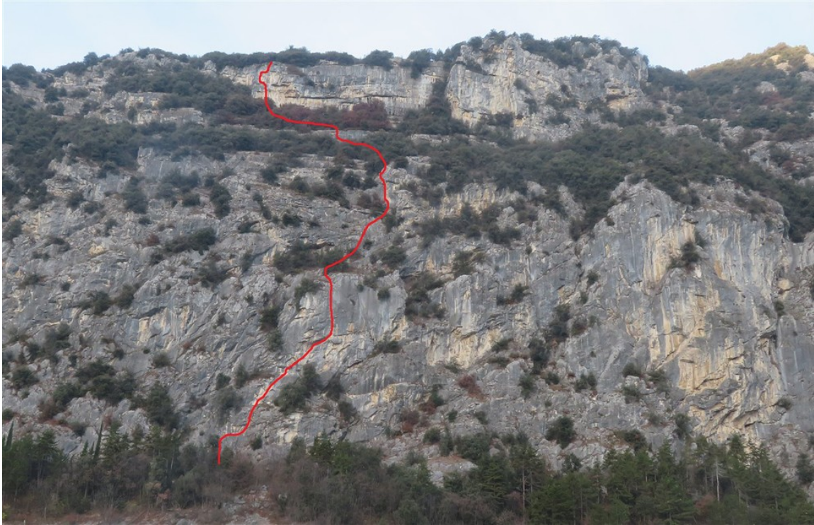
Tracciato indicativo El Palorcio (lunghezze originali)