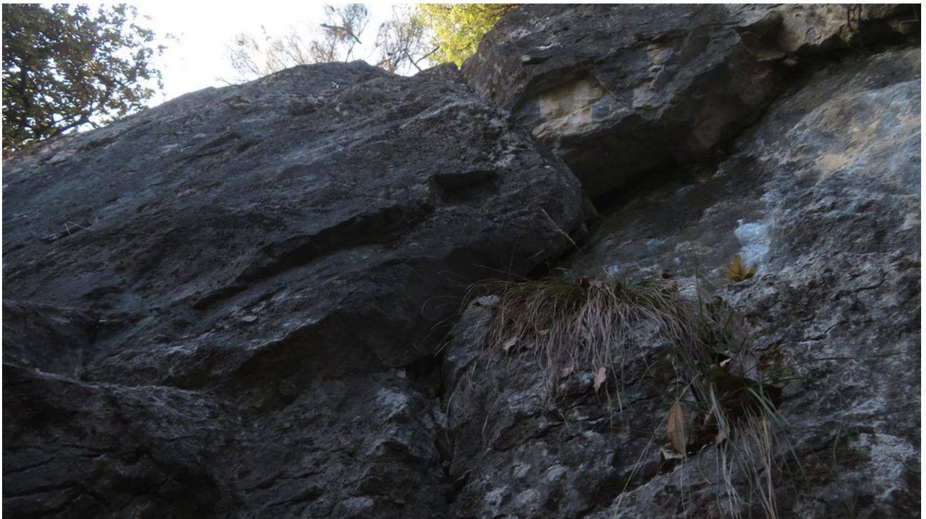
Ottava lunghezza, opzione b