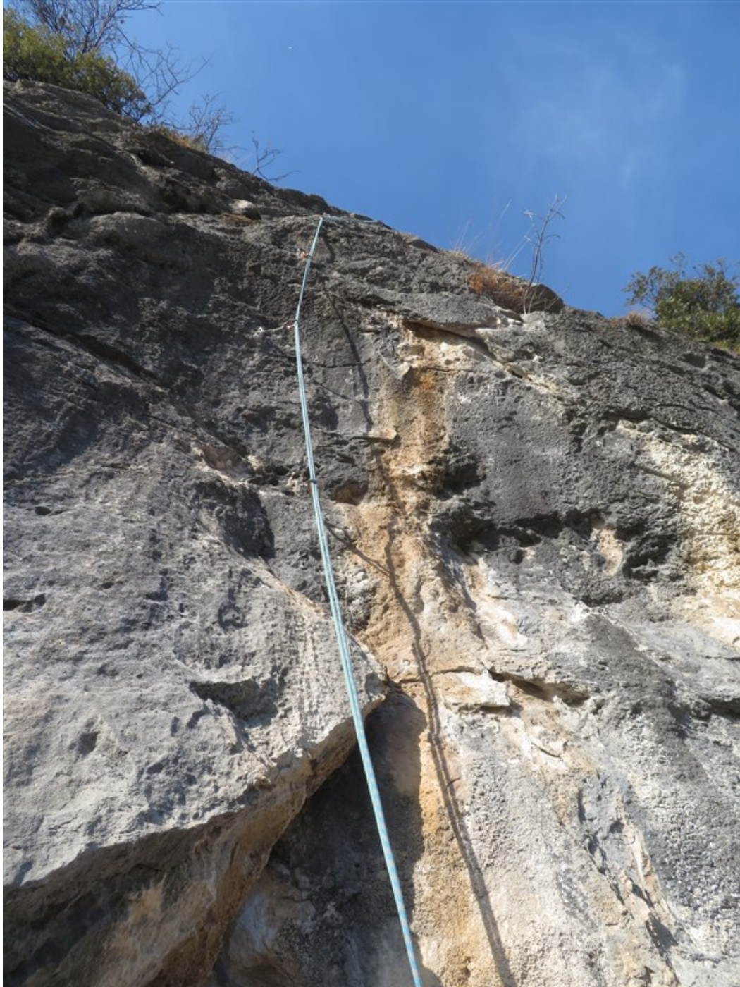
Muro quarta lunghezza