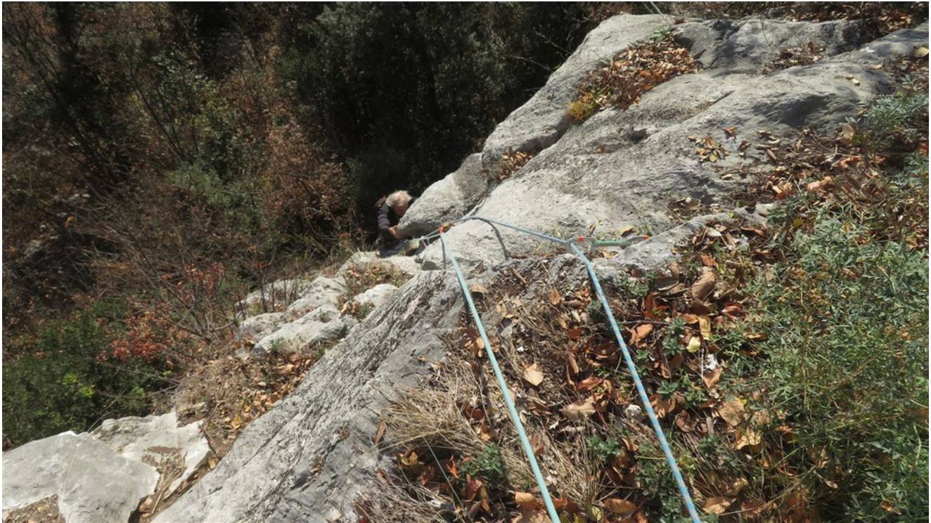
Uscita prima lunghezza