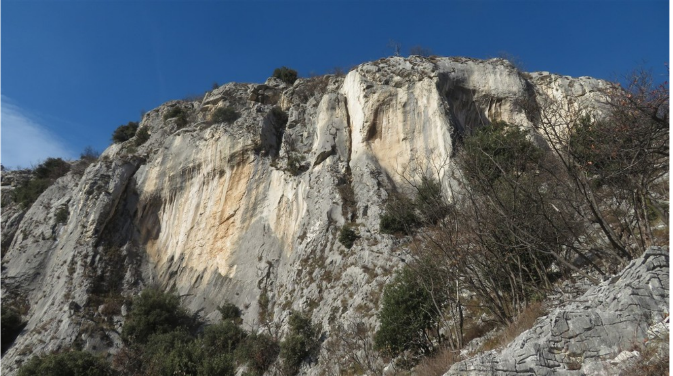
La parete dell'ottava lunghezza