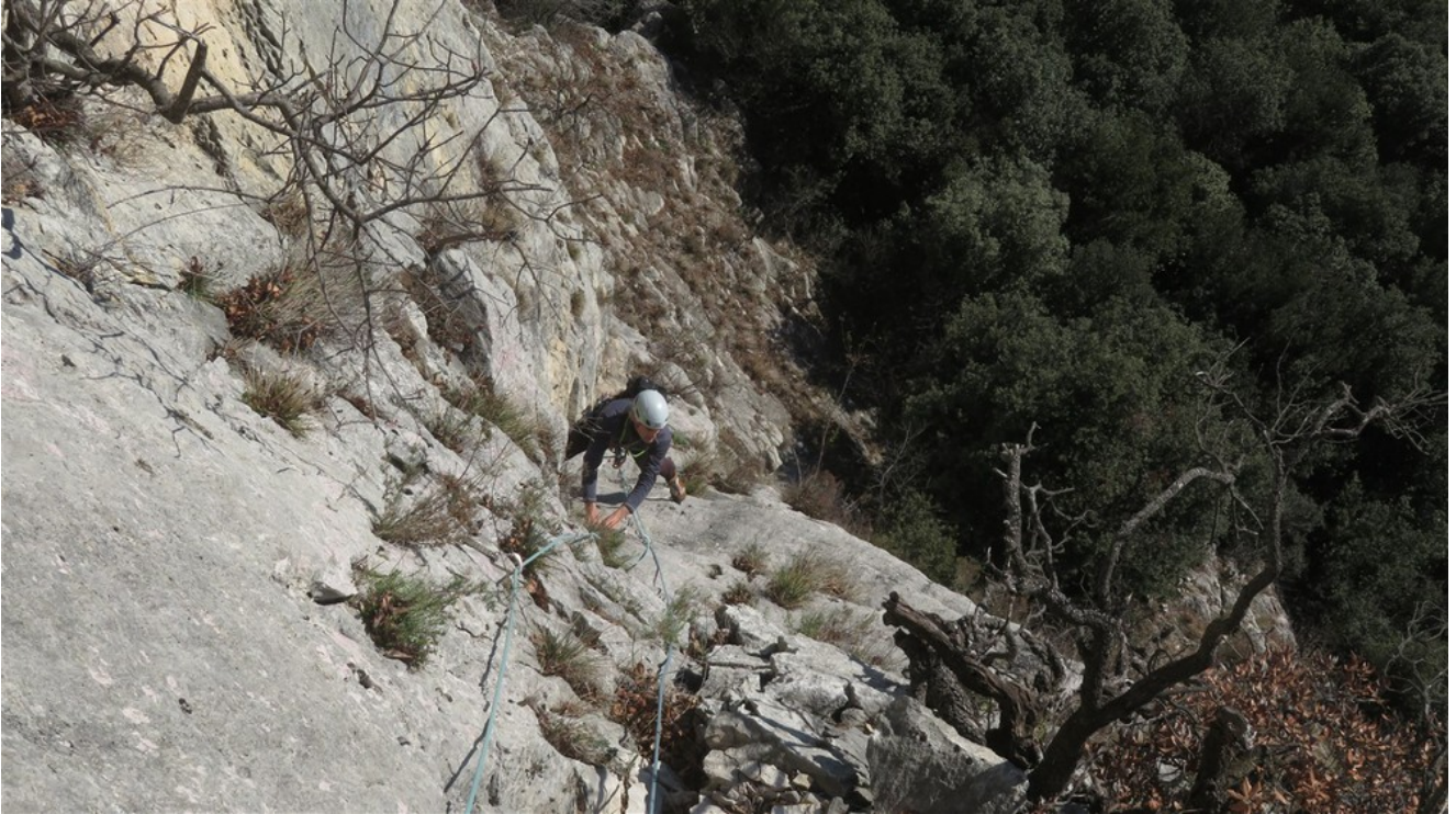
Parte finale seconda lunghezza