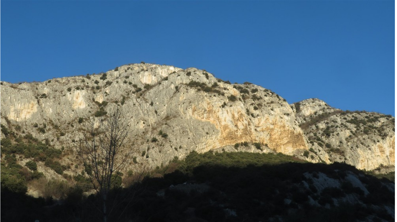
Bastionate di Tessari