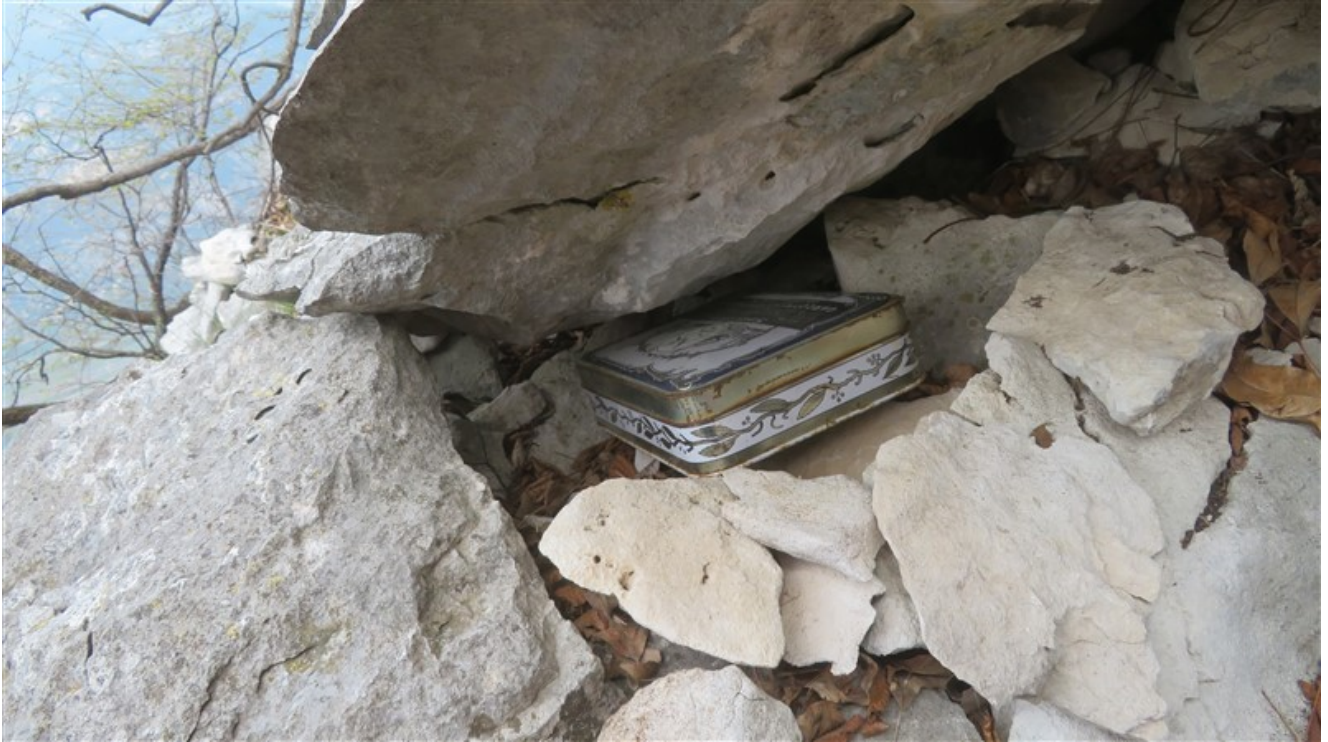
Libro di via