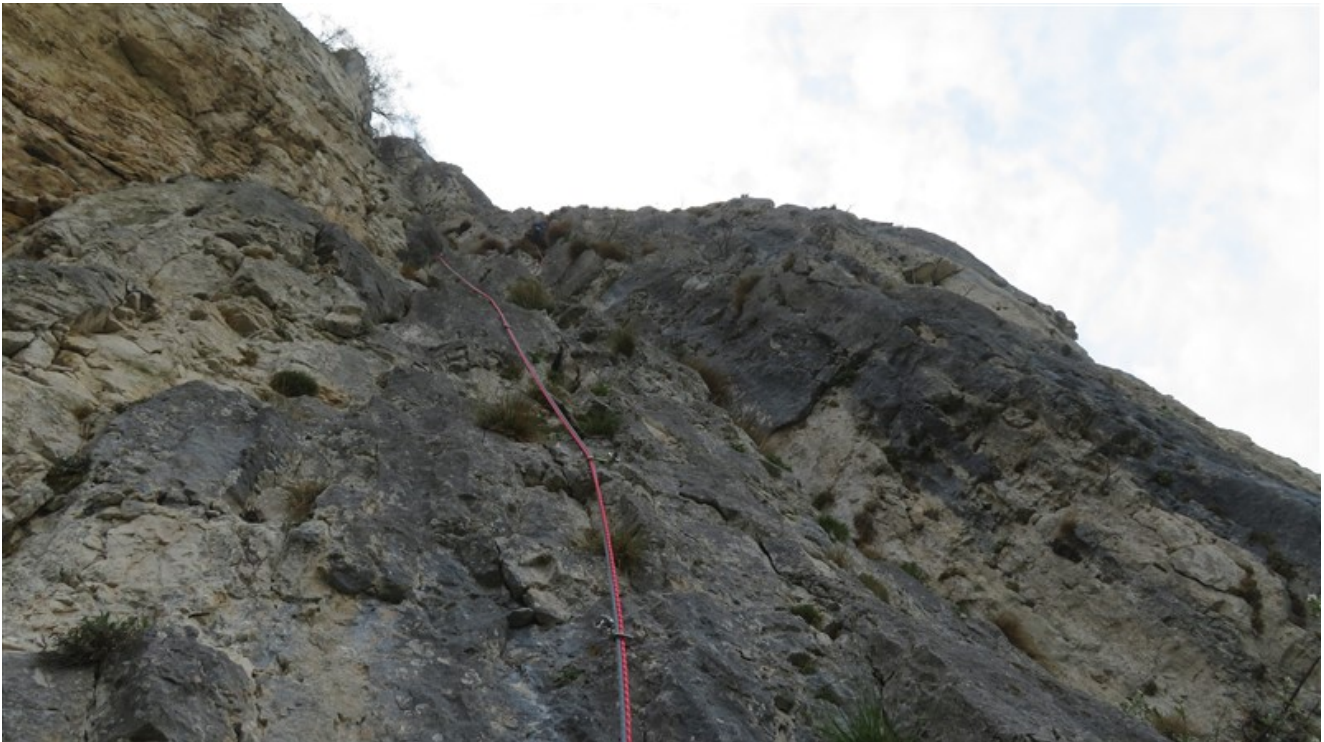
Quarta e quinta lunghezza