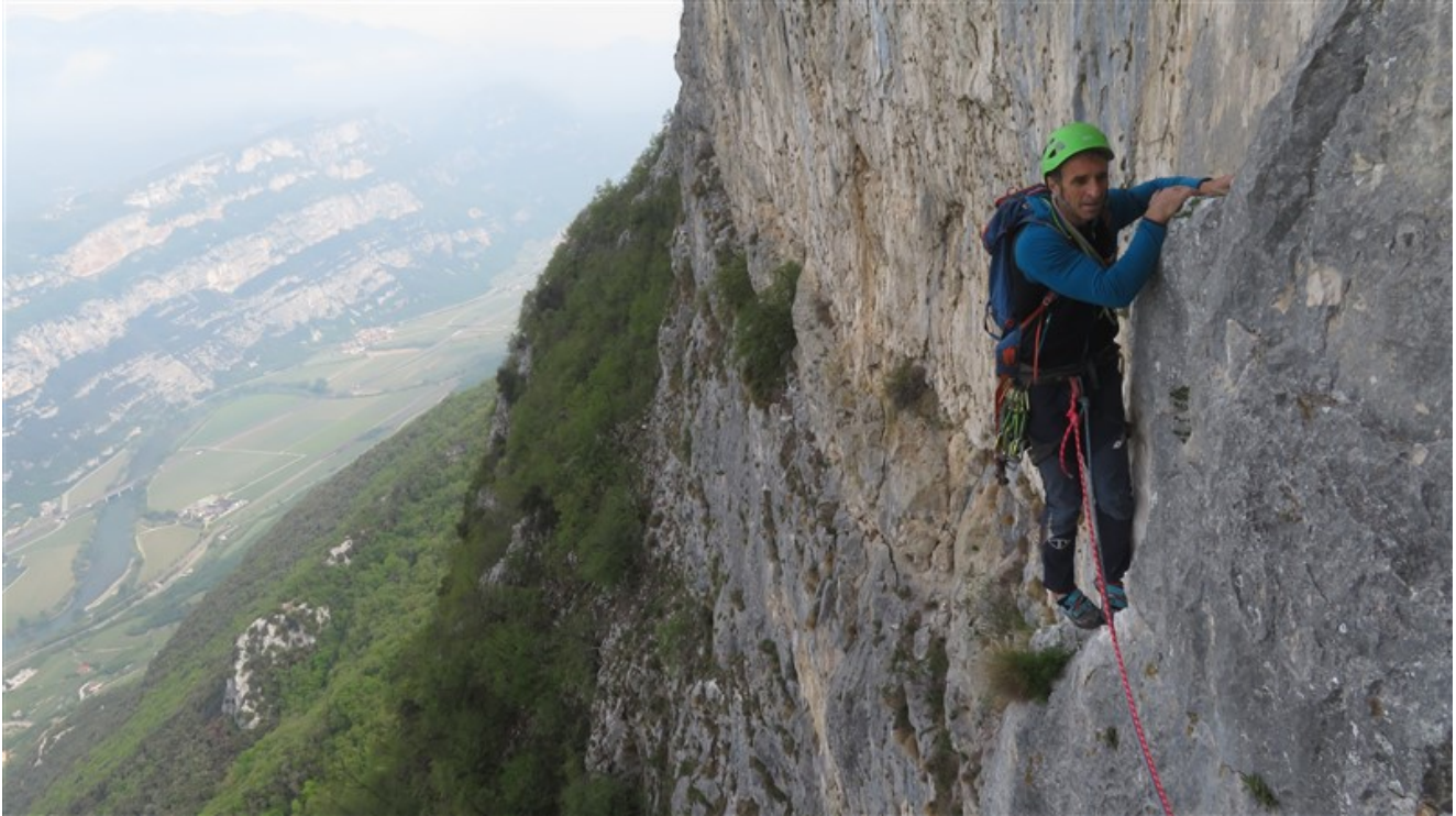
Uscita terza lunghezza