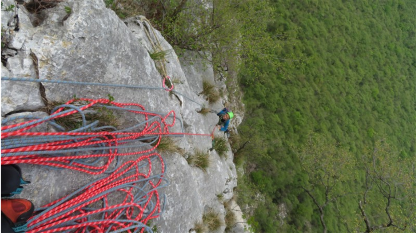
Tratto finale settima lunghezza