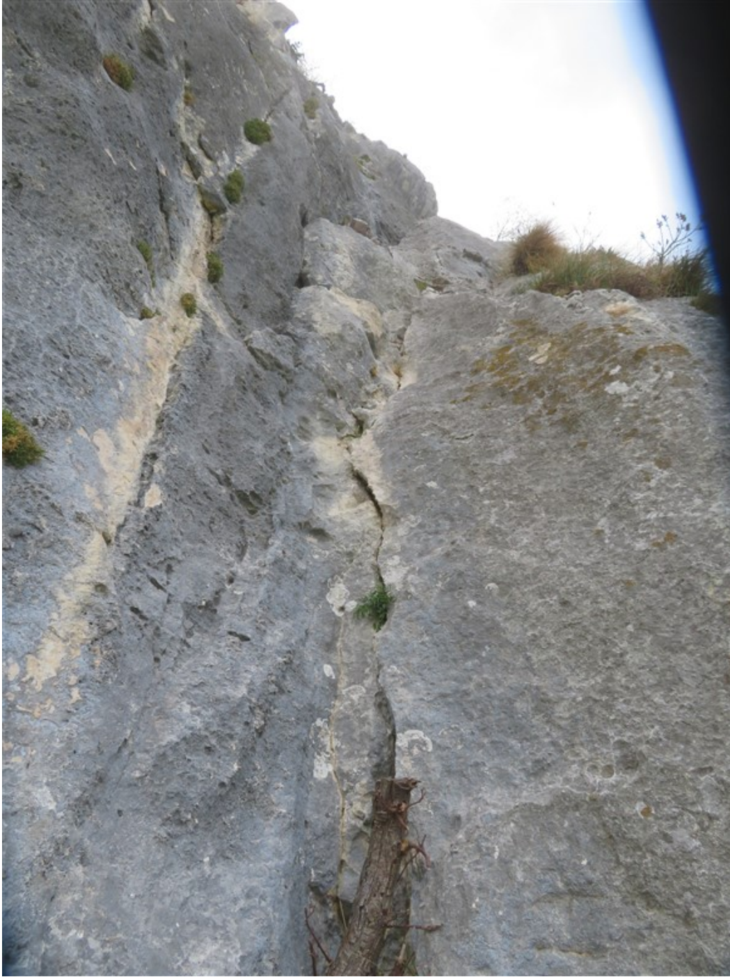
Partenza sesta lunghezza