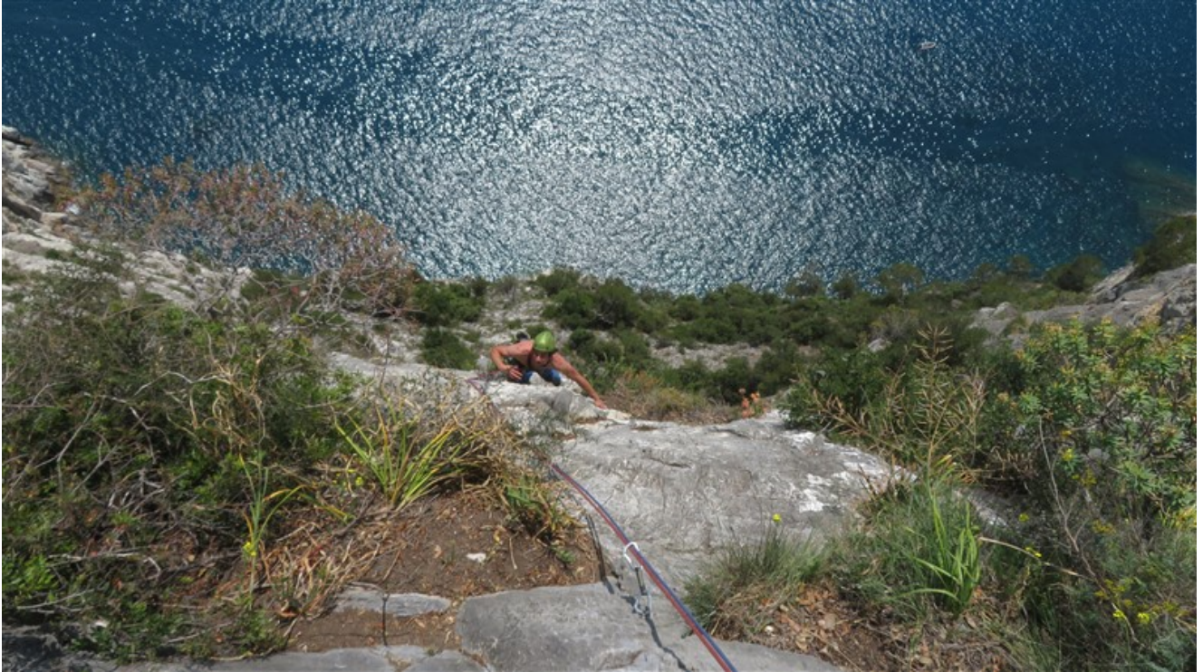
Fine seconda lunghezza