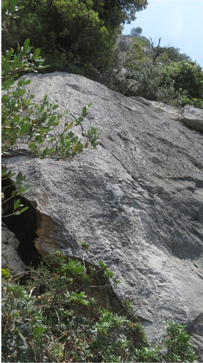
Partenza seconda lunghezza