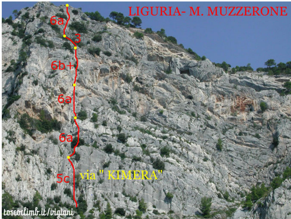
Tracciato indicativo Kymera, da www.toscoclimb.it