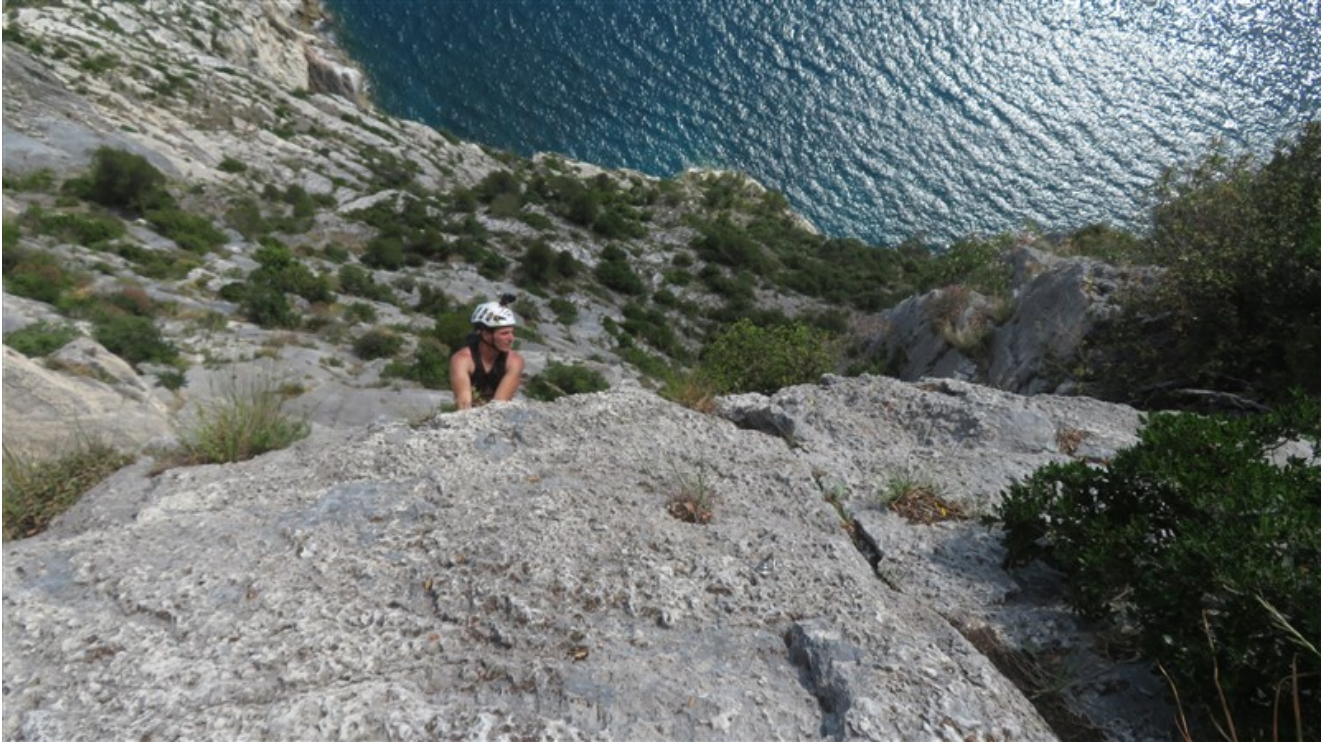
Uscita quarta lunghezza