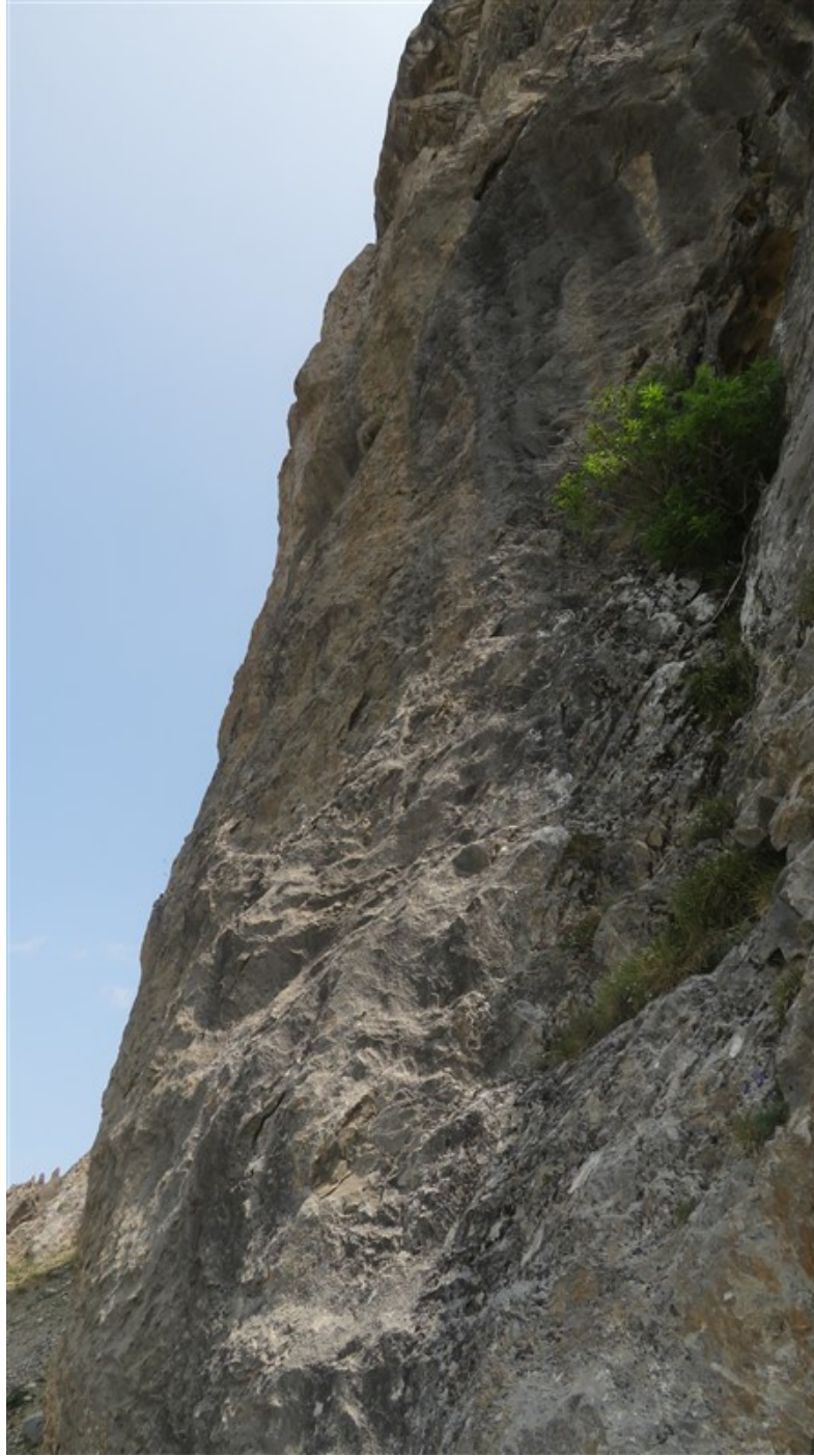
Il pilastro della prima lunghezza