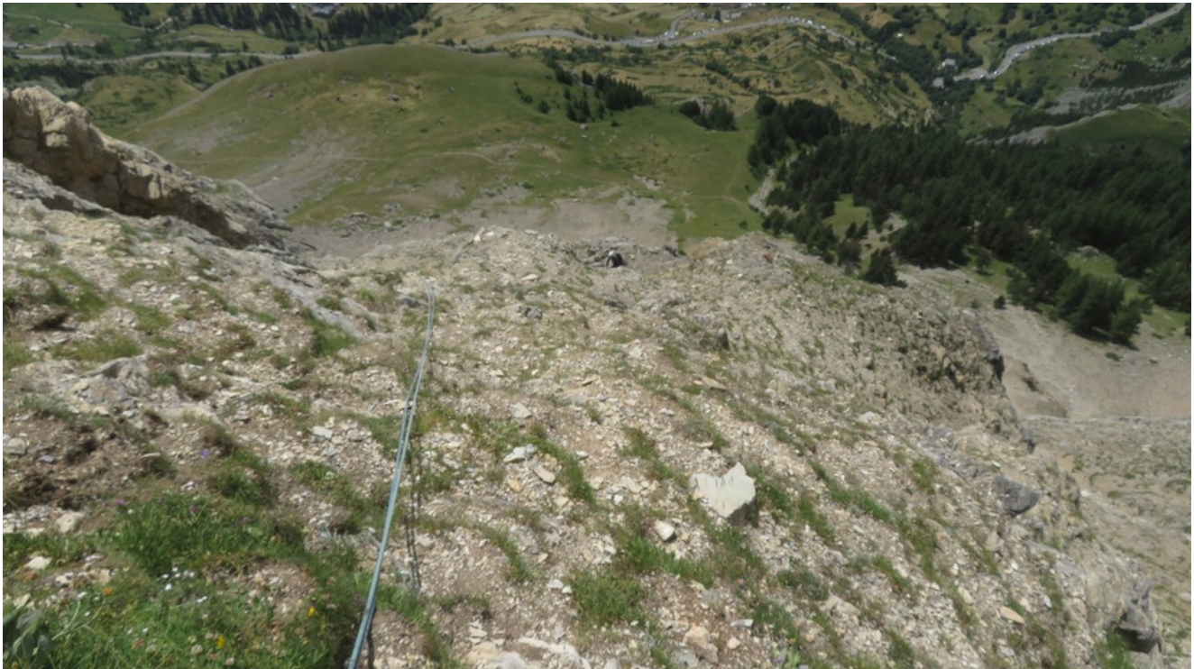
La cengia della quarta lunghezza