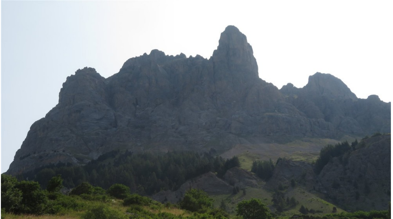
Petit Aiguillette du Lauzet