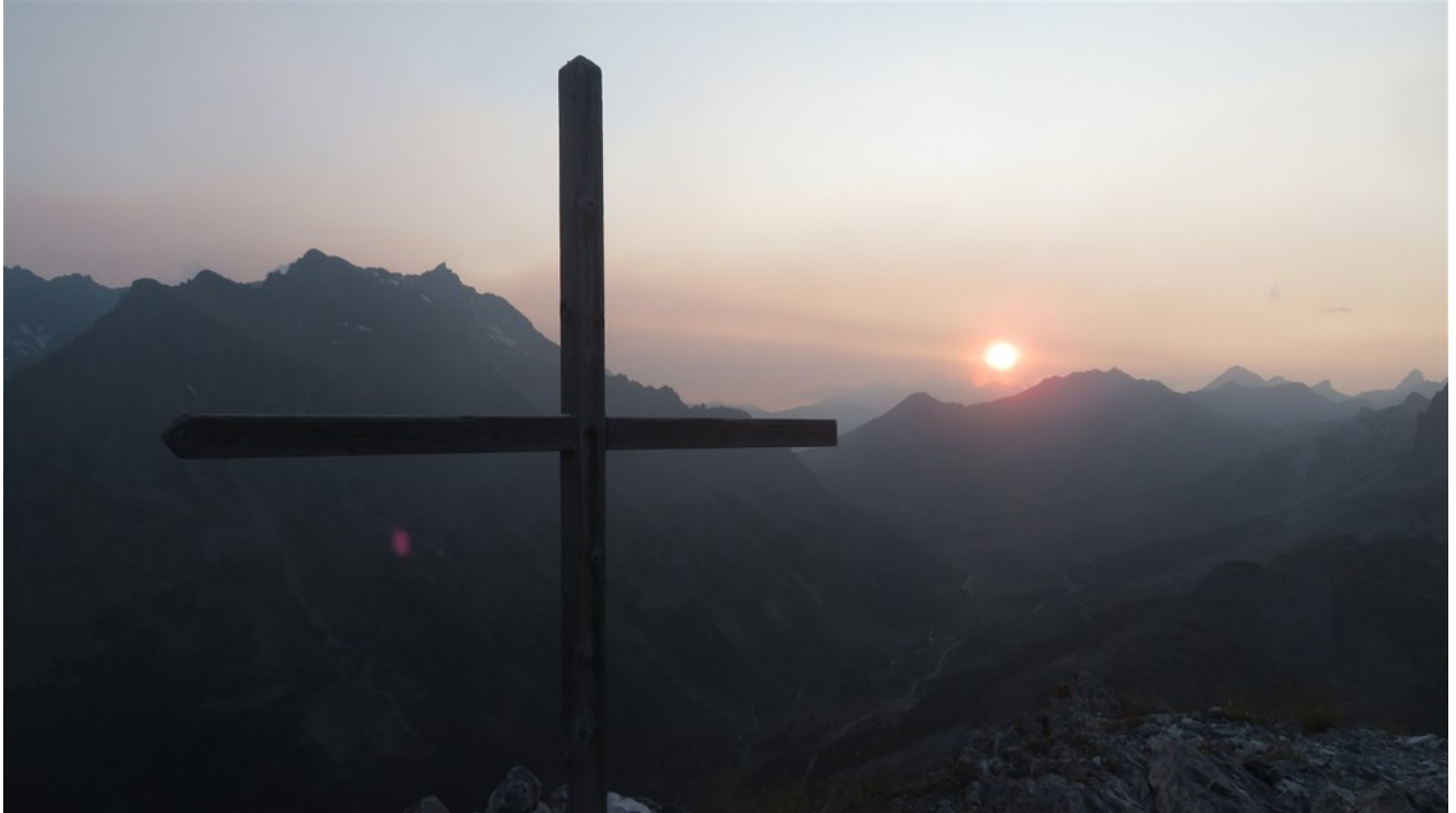
Panorama dalla vetta