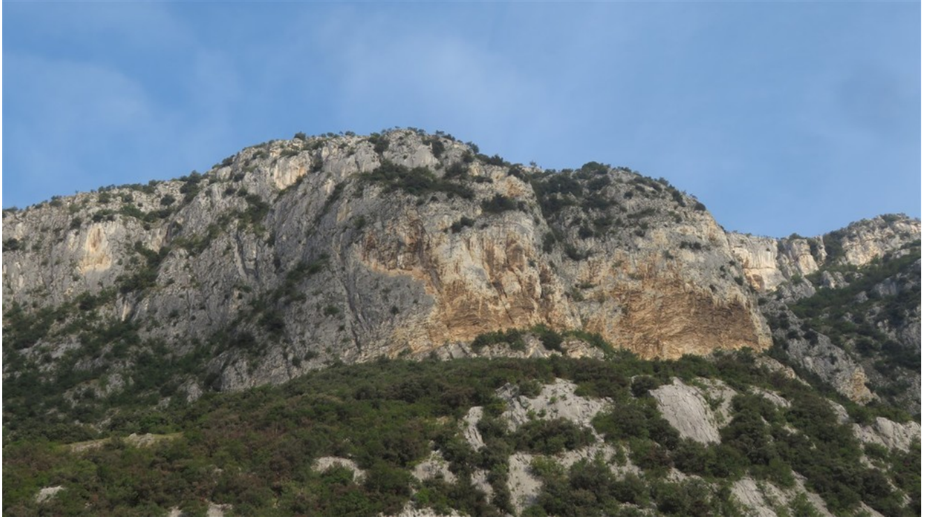
Bastionate di Tessari