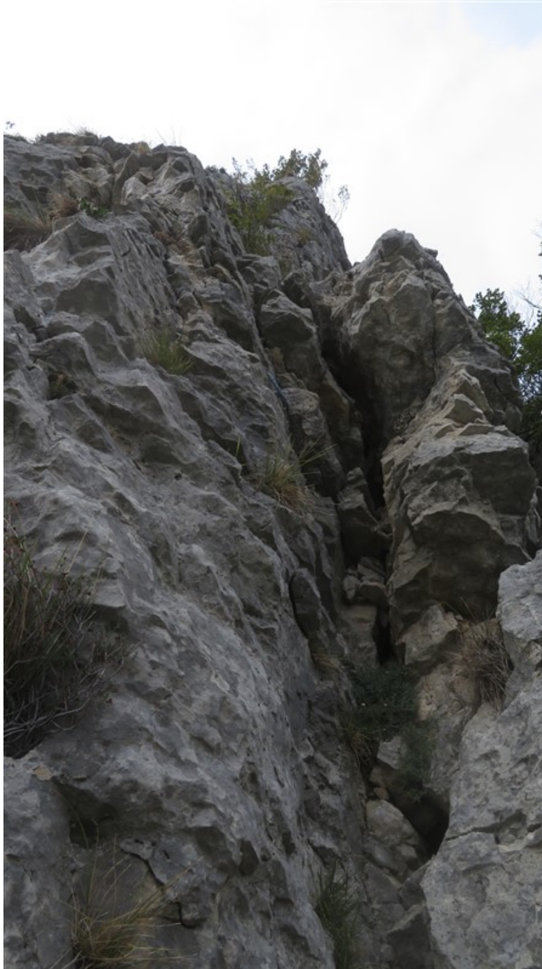
Partenza quinta lunghezza