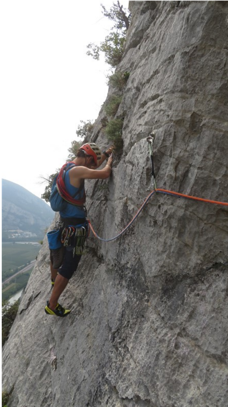
Partenza quarta lunghezza