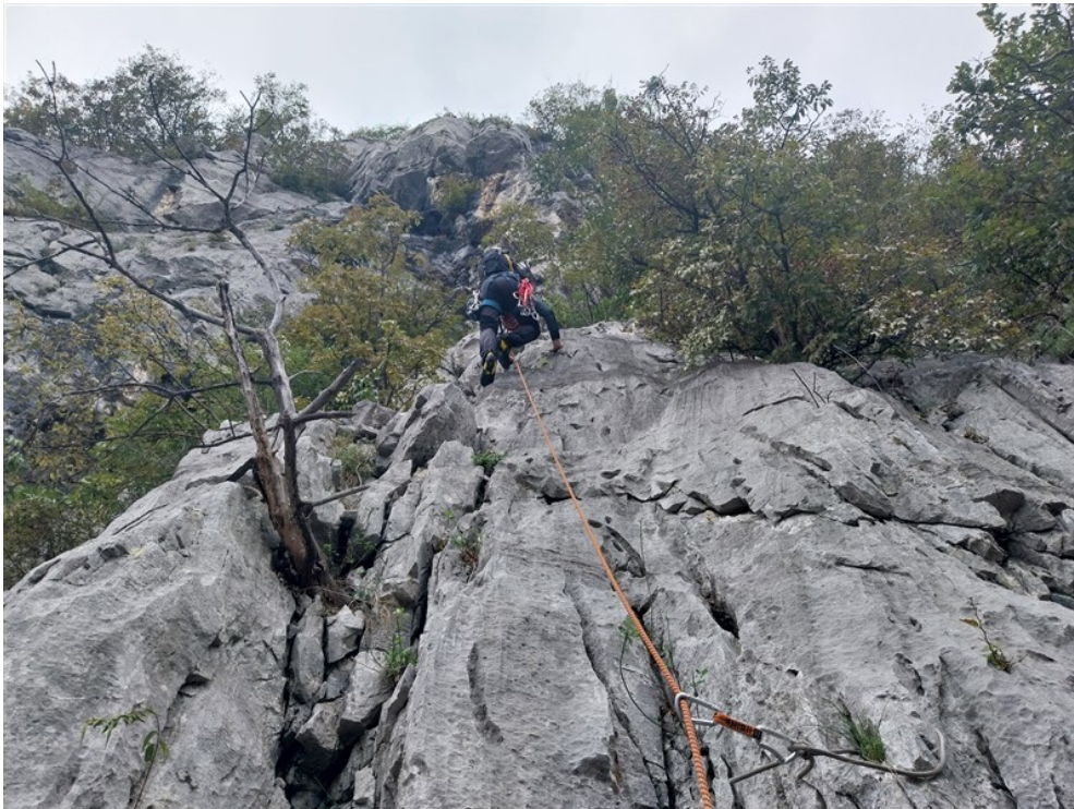
Fabio sulla prima lunghezza