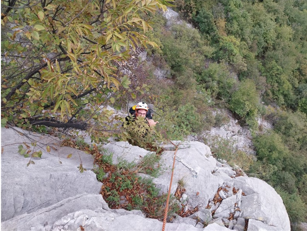
Fabio in uscita dalla seconda lunghezza