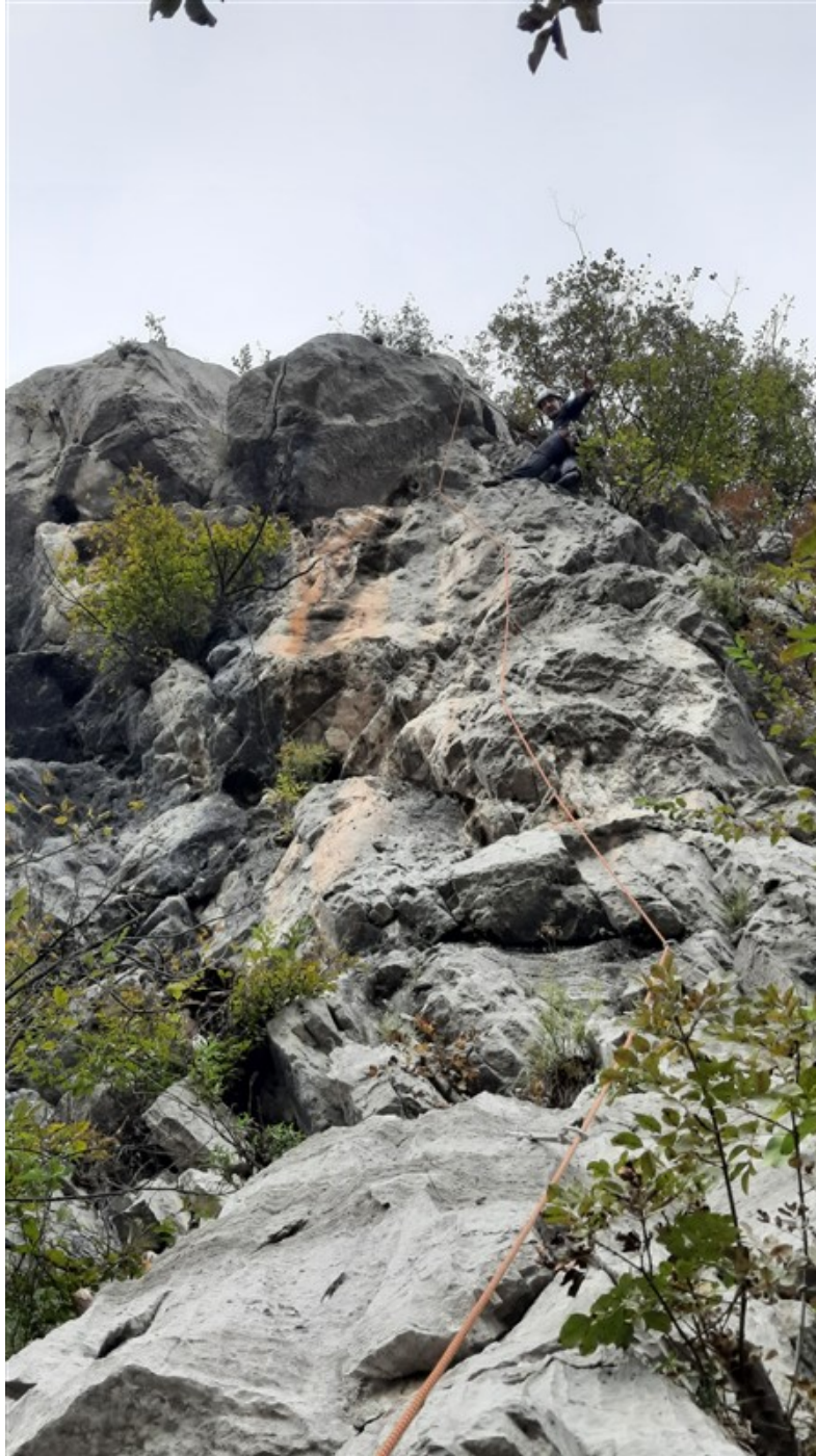
Simone sul pilastro nero giallastro del secondo tiro