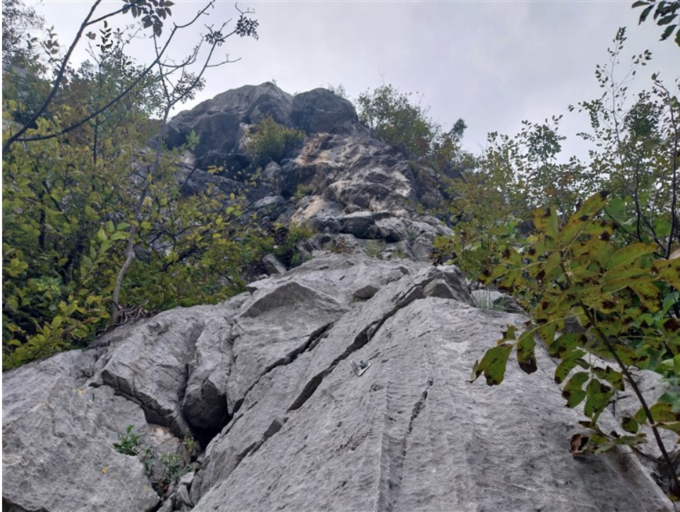
Seconda lunghezza dalla S1