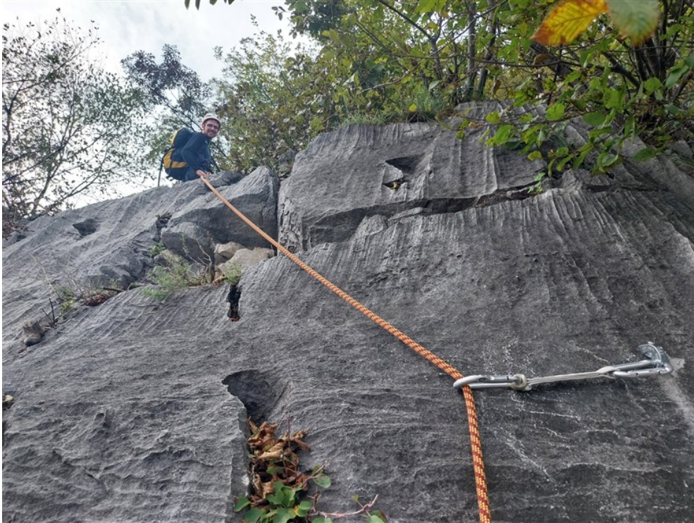
Fabio alla S3, tratto in uscita della via