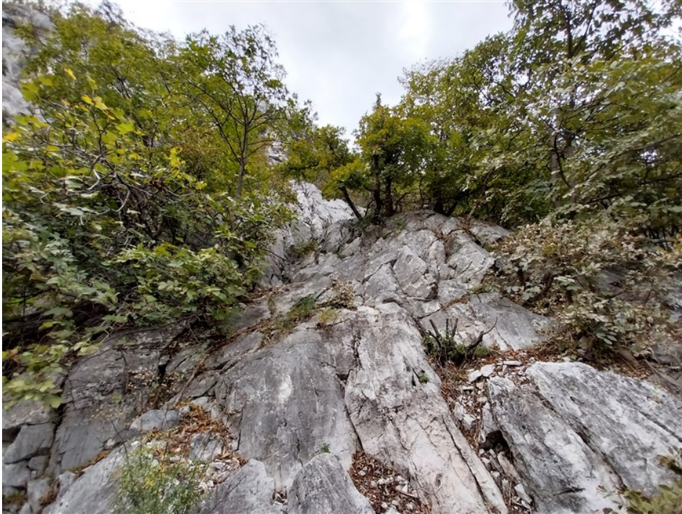
Il canalino roccioso che porta all'attacco della via