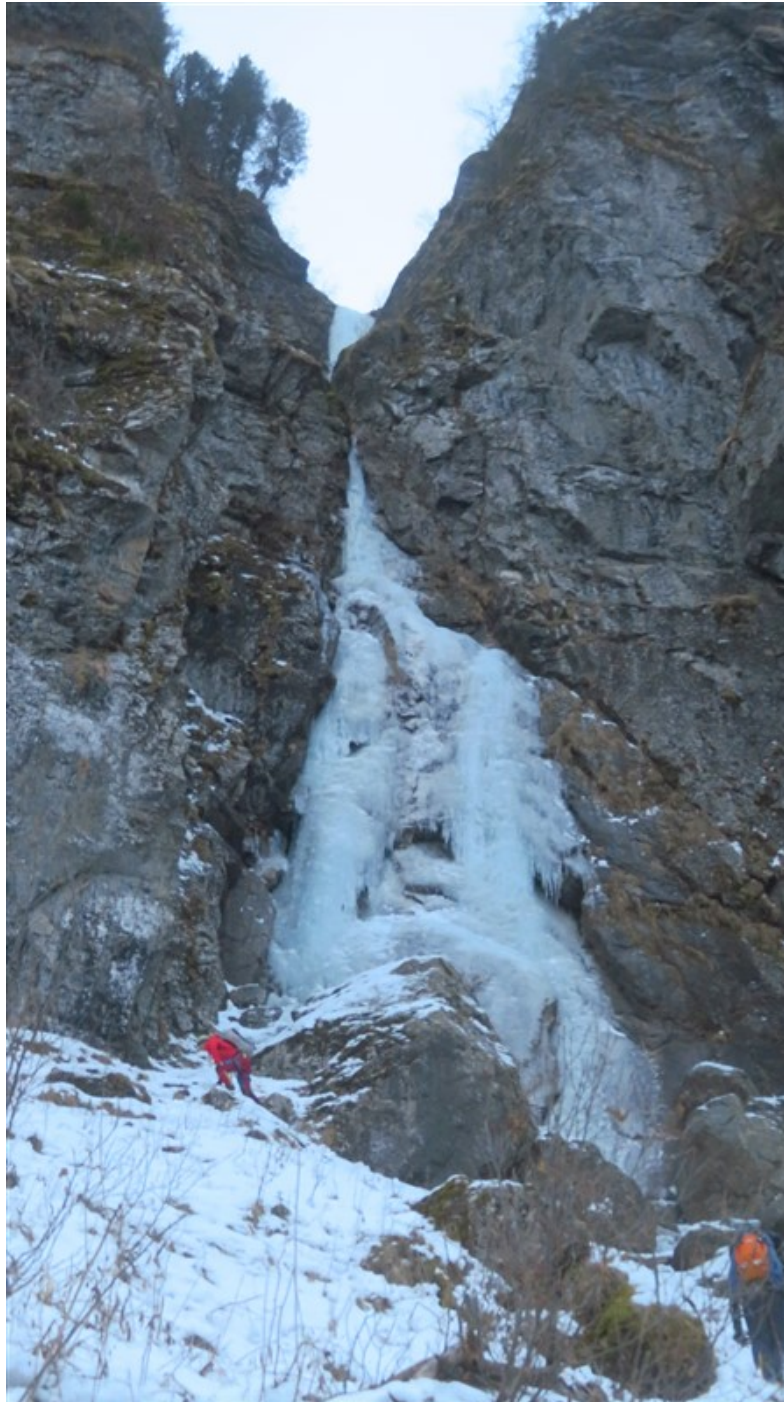
Verso l'attacco del primo salto, a sx