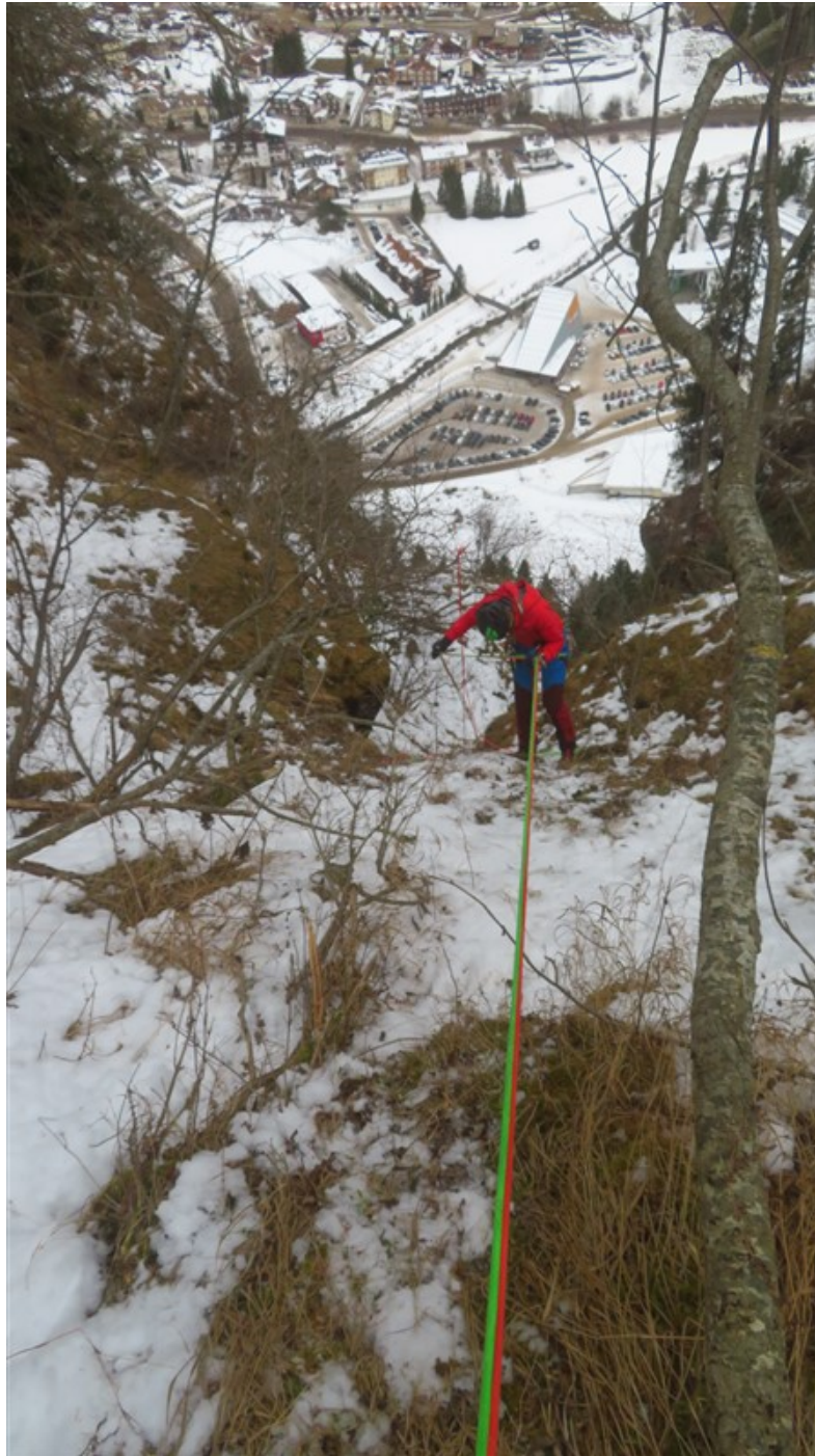
inizio prima doppia