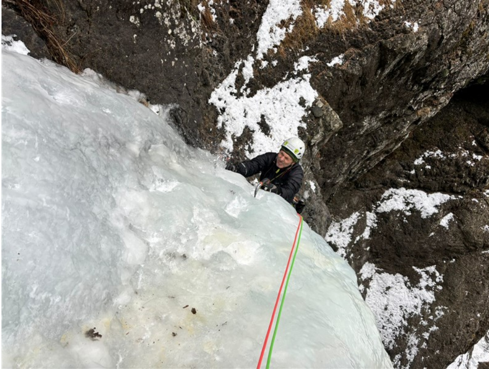
Uscita seconda lunghezza