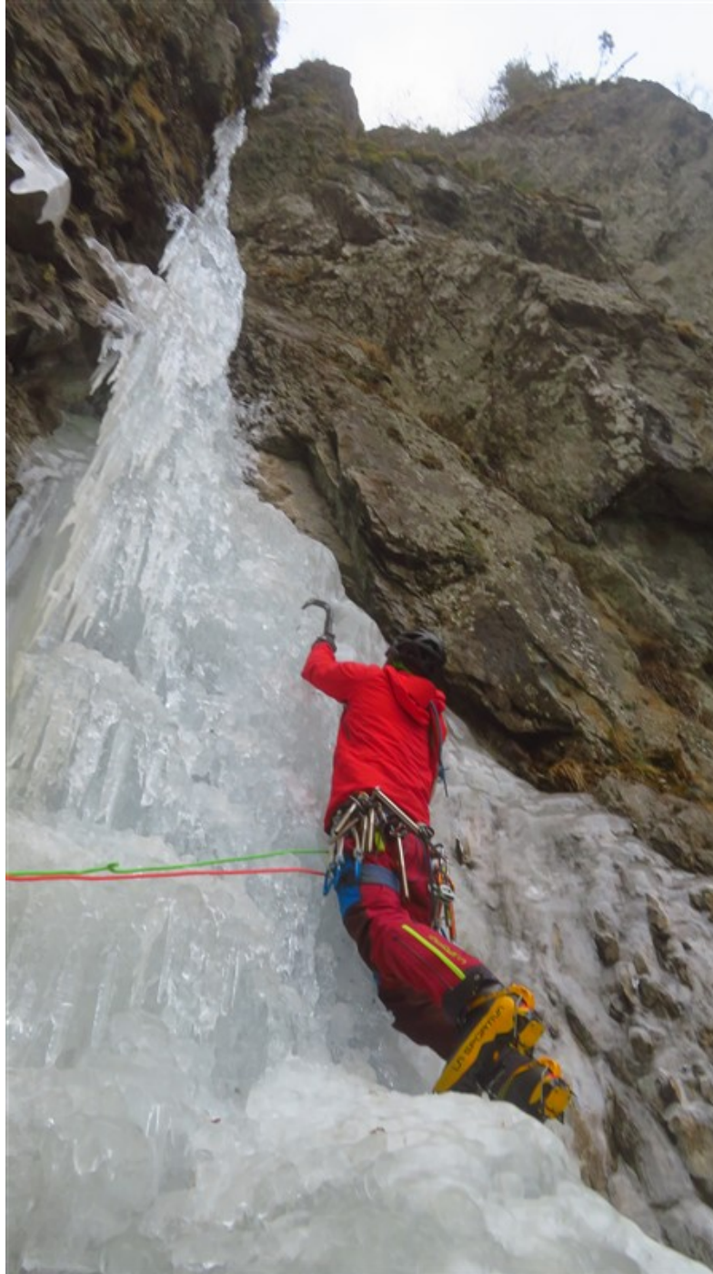
Partenza seconda lunghezza