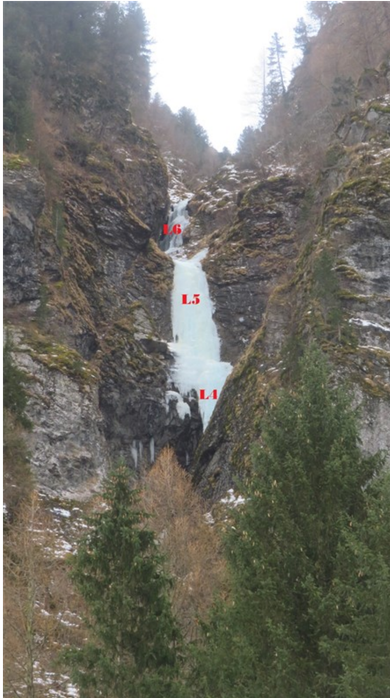
La parte alta della cascata vista dalla strada