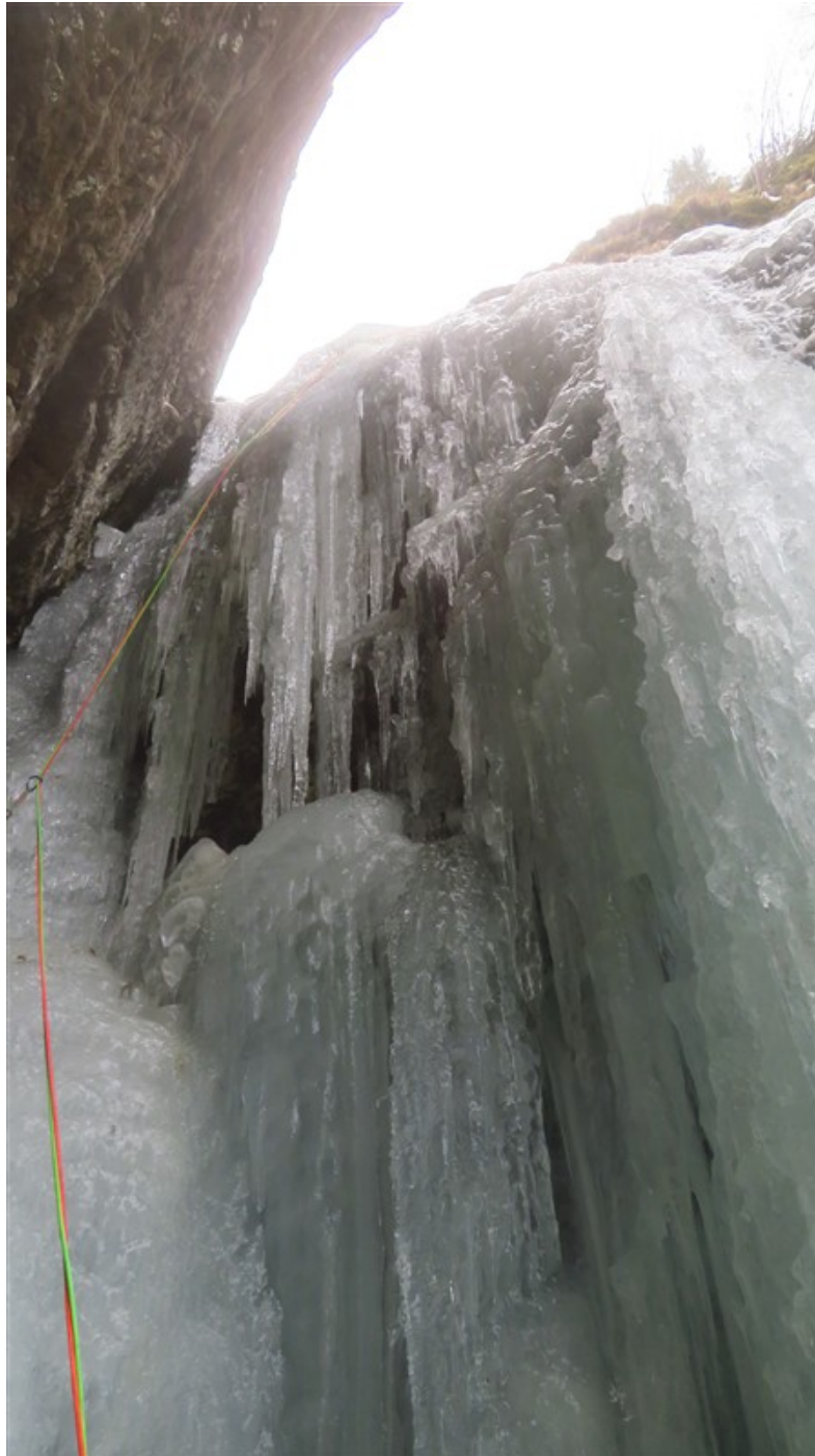
Il salto della sesta lunghezza