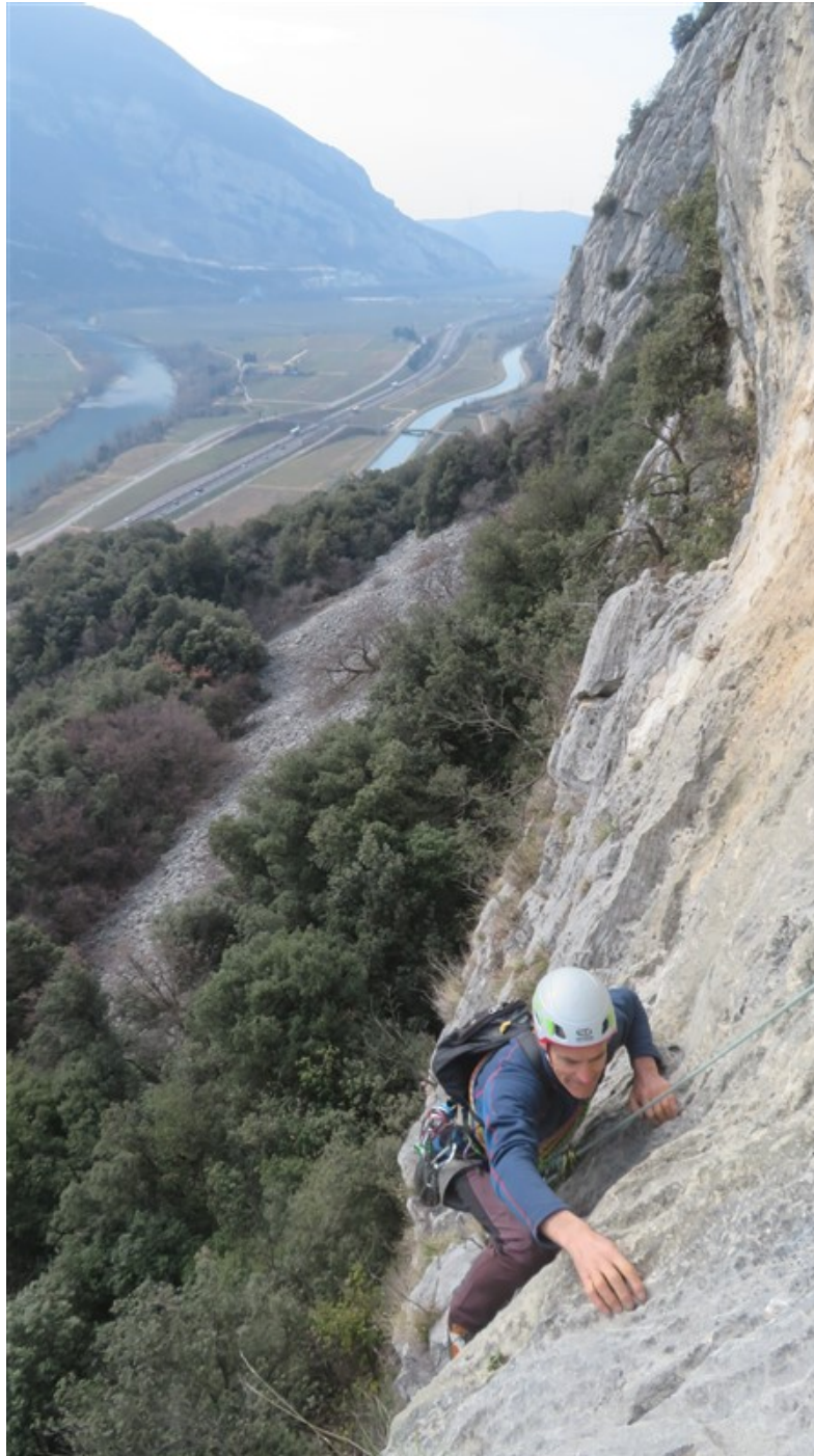
Uscita seconda lunghezza