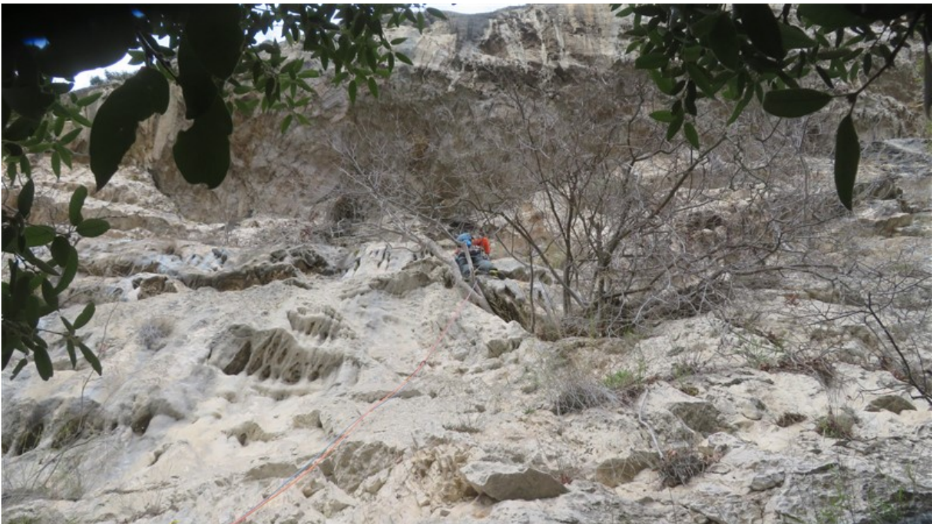
Parte iniziale prima lunghezza