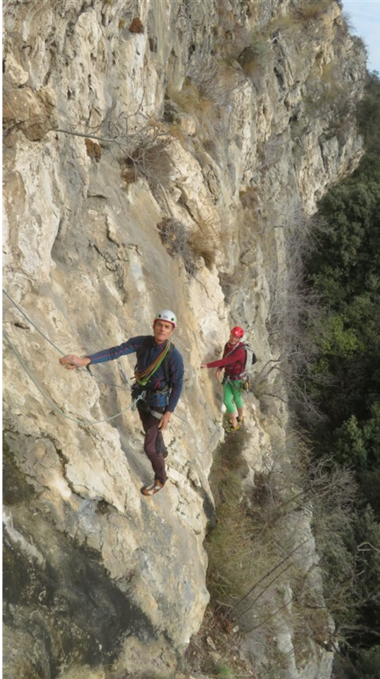
Parte finale prima lunghezza