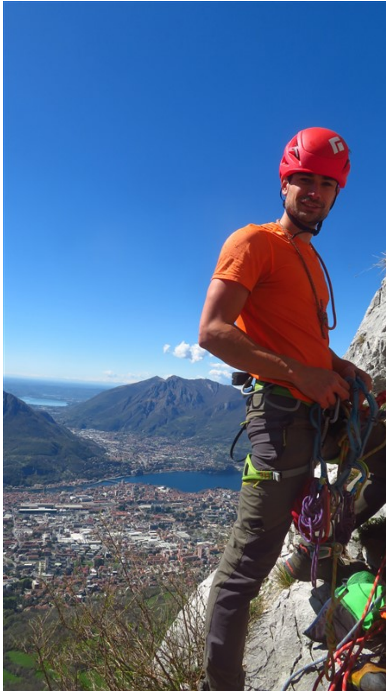
In sosta, L6