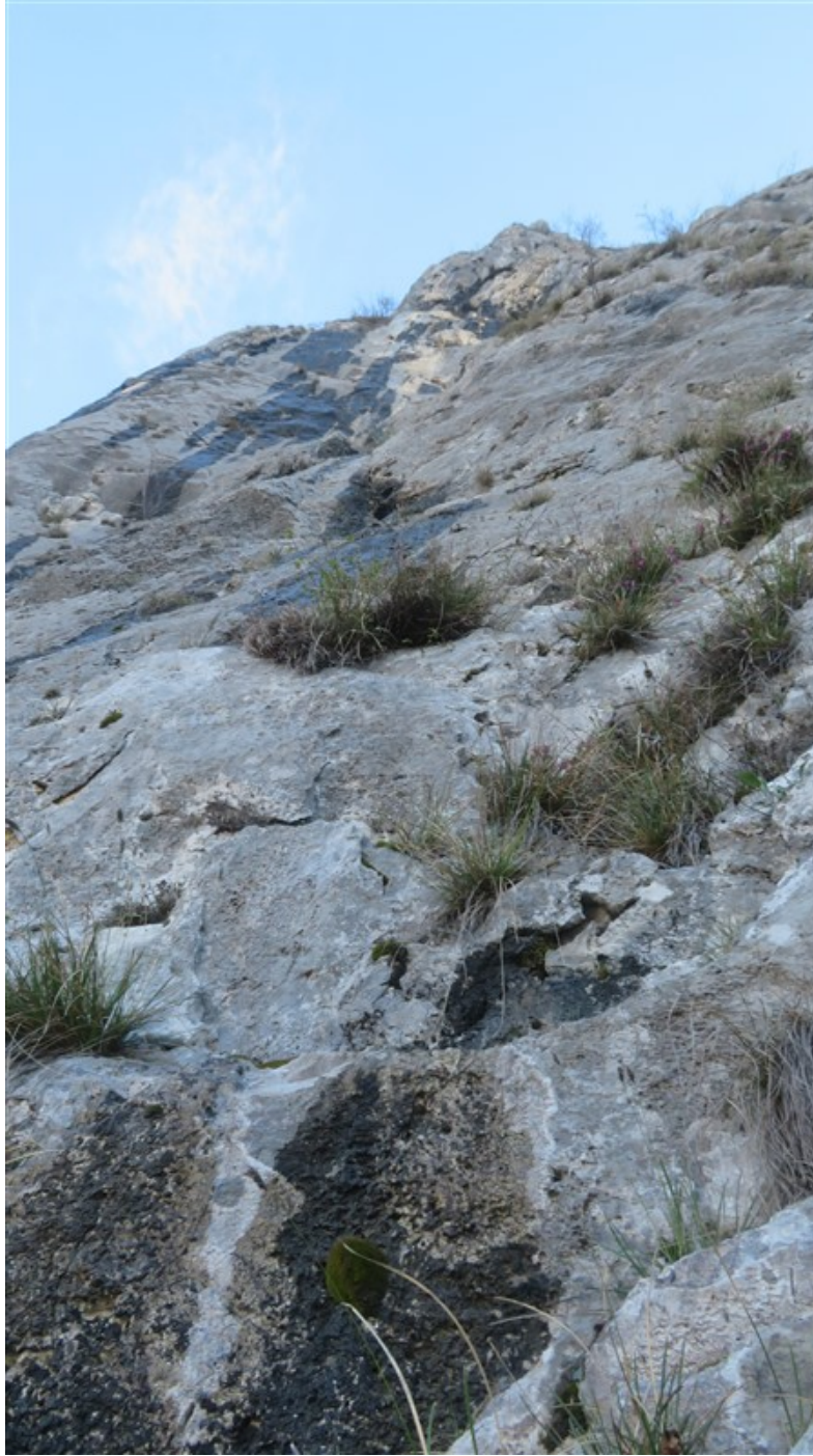
Prima lunghezza dalla base