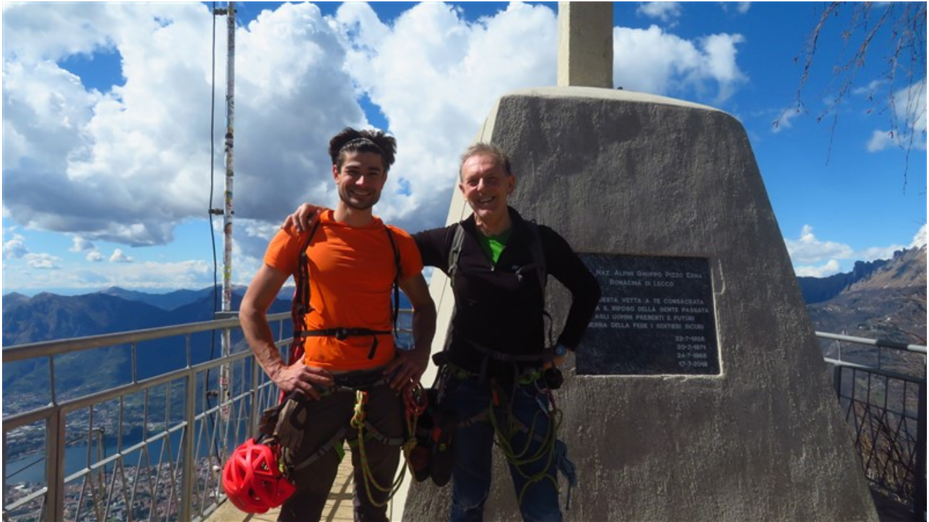
In vetta, alla fine della ferrata