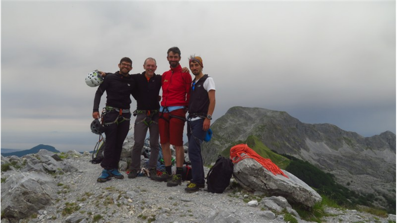
Foto di vetta