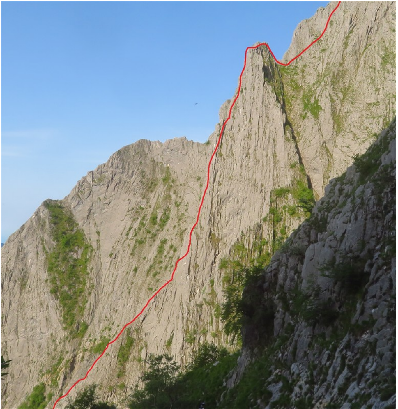
Tracciato indicativo Pilastro Montagna, manca il tratto finale