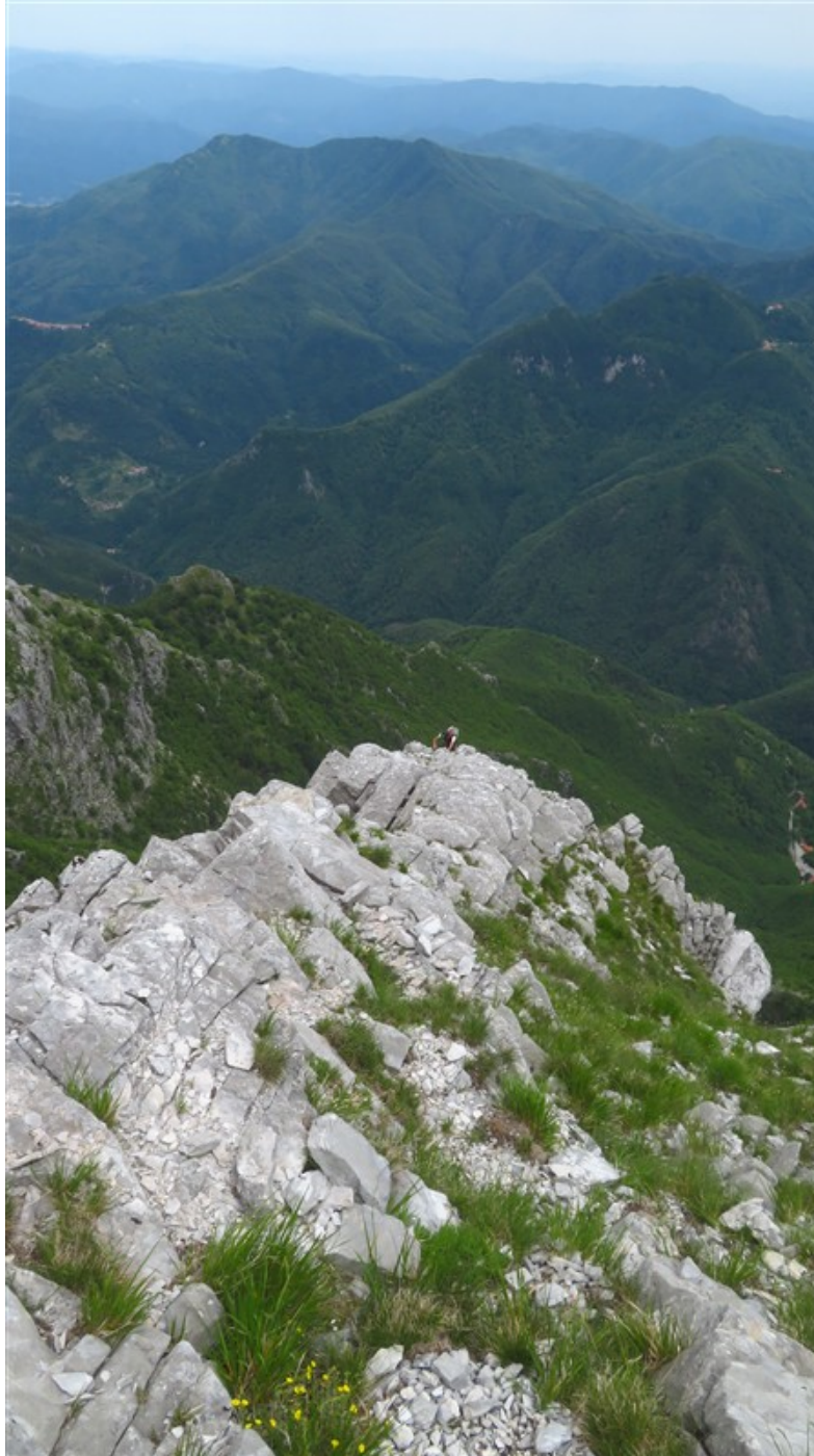
Quindicesima lunghezza: la cresta finale