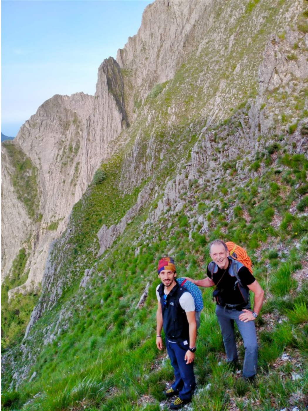
Il primo tratto di canale erboso da scendere