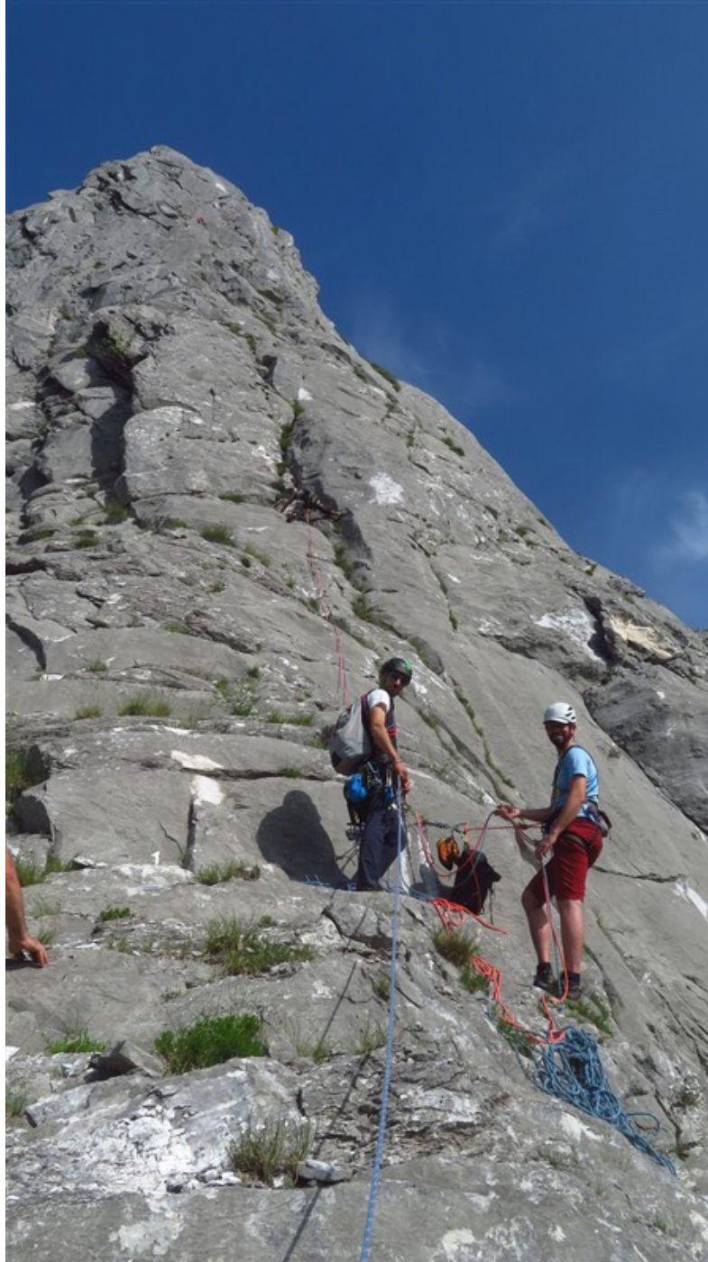
S1 alla base delle prime difficoltà