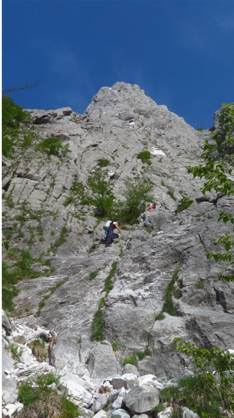
Attacco della via Cordata del Cottolengo, occorre invece attaccare più a sx