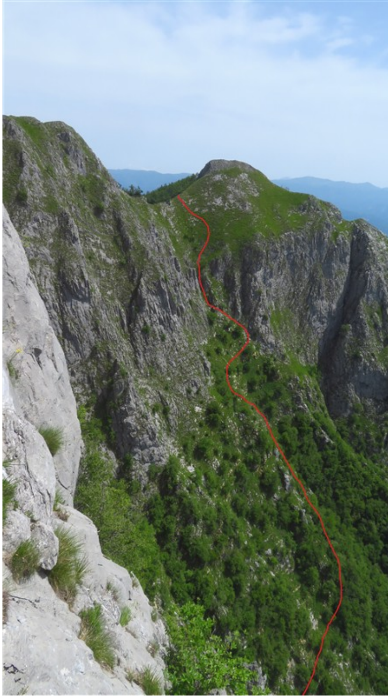
Tracciato indicativo della discesa nel canalone per arrivare all'attacco