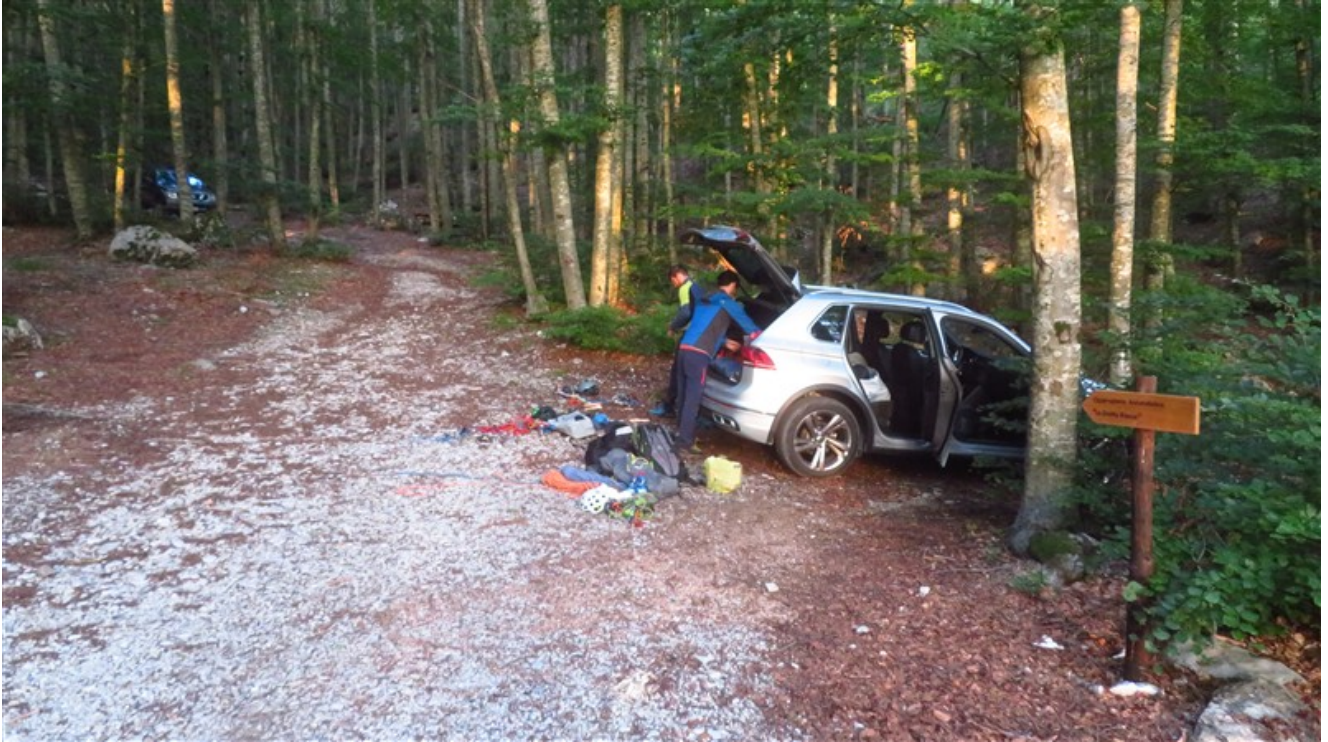
La sterrata con area picnic dove parcheggiare