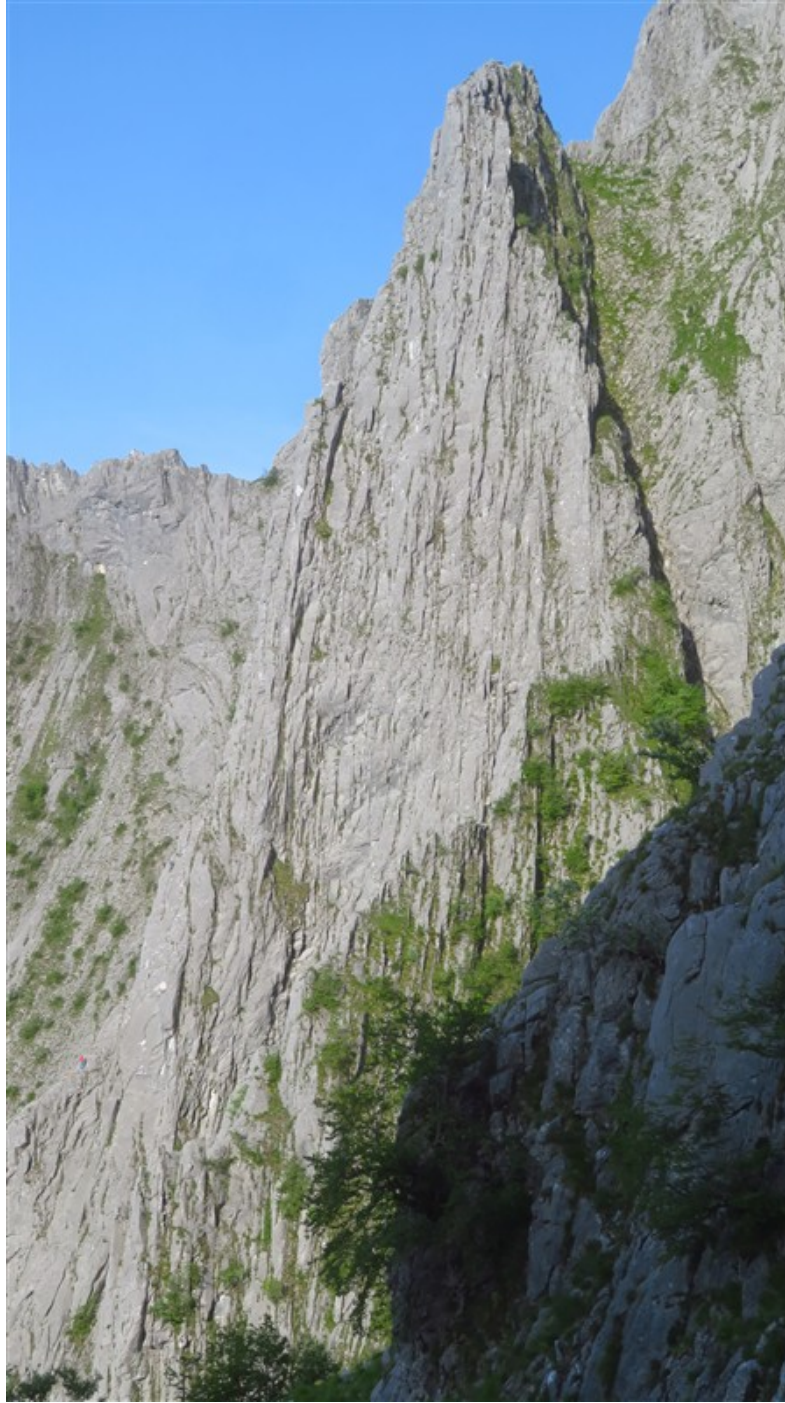
Pilastro sud-est della Pania Secca