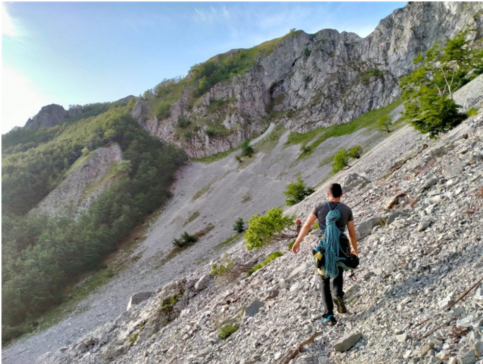
Il ghiaione da attraversare durante l'avvicinamento