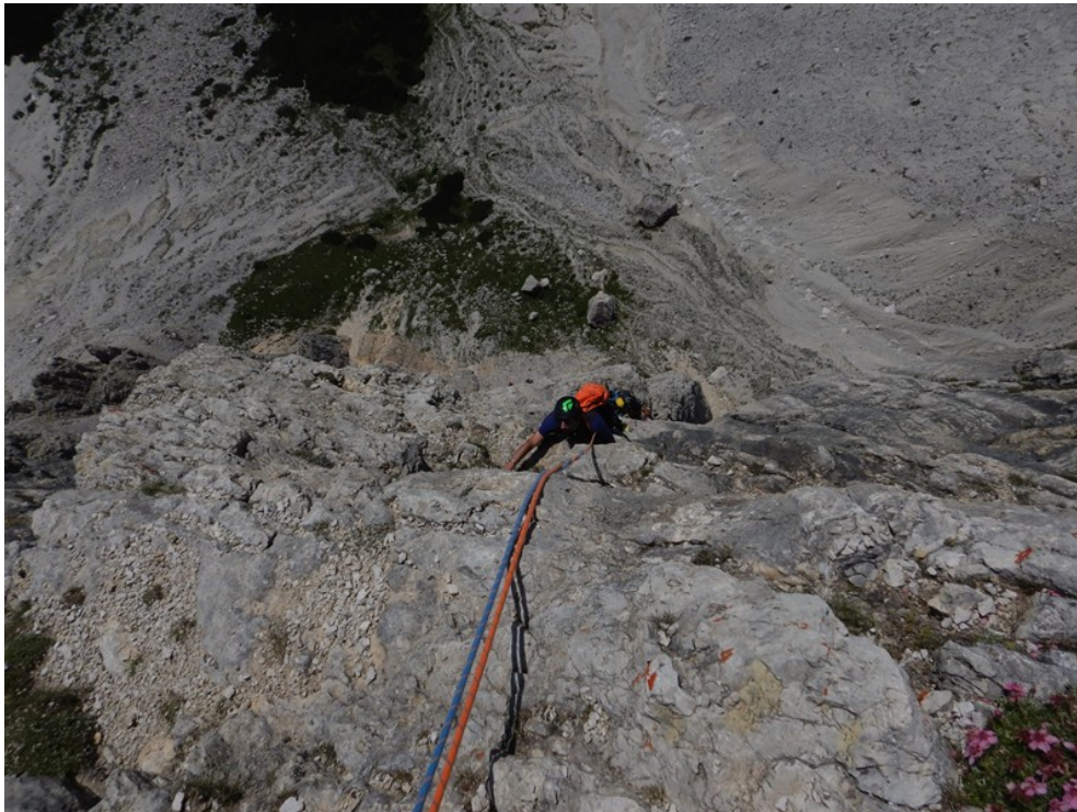
Uscita quarta lunghezza