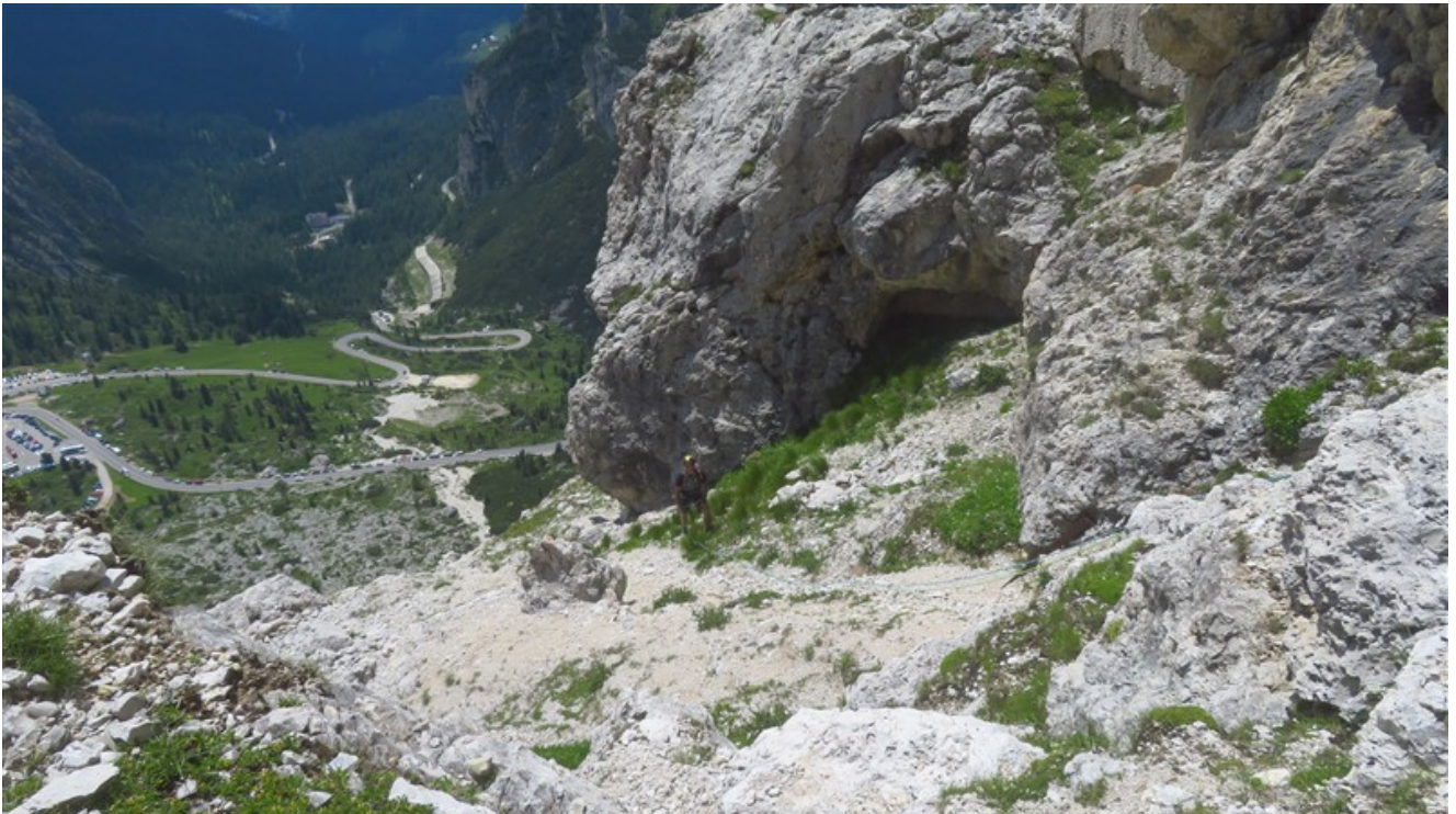
Settima lunghezza, uscita