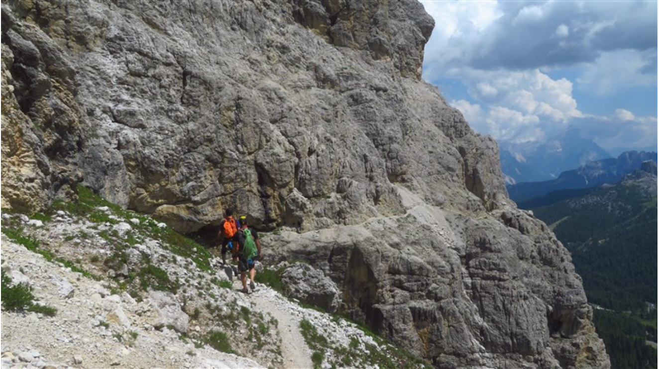
La Cengia Martini dall'uscita della via