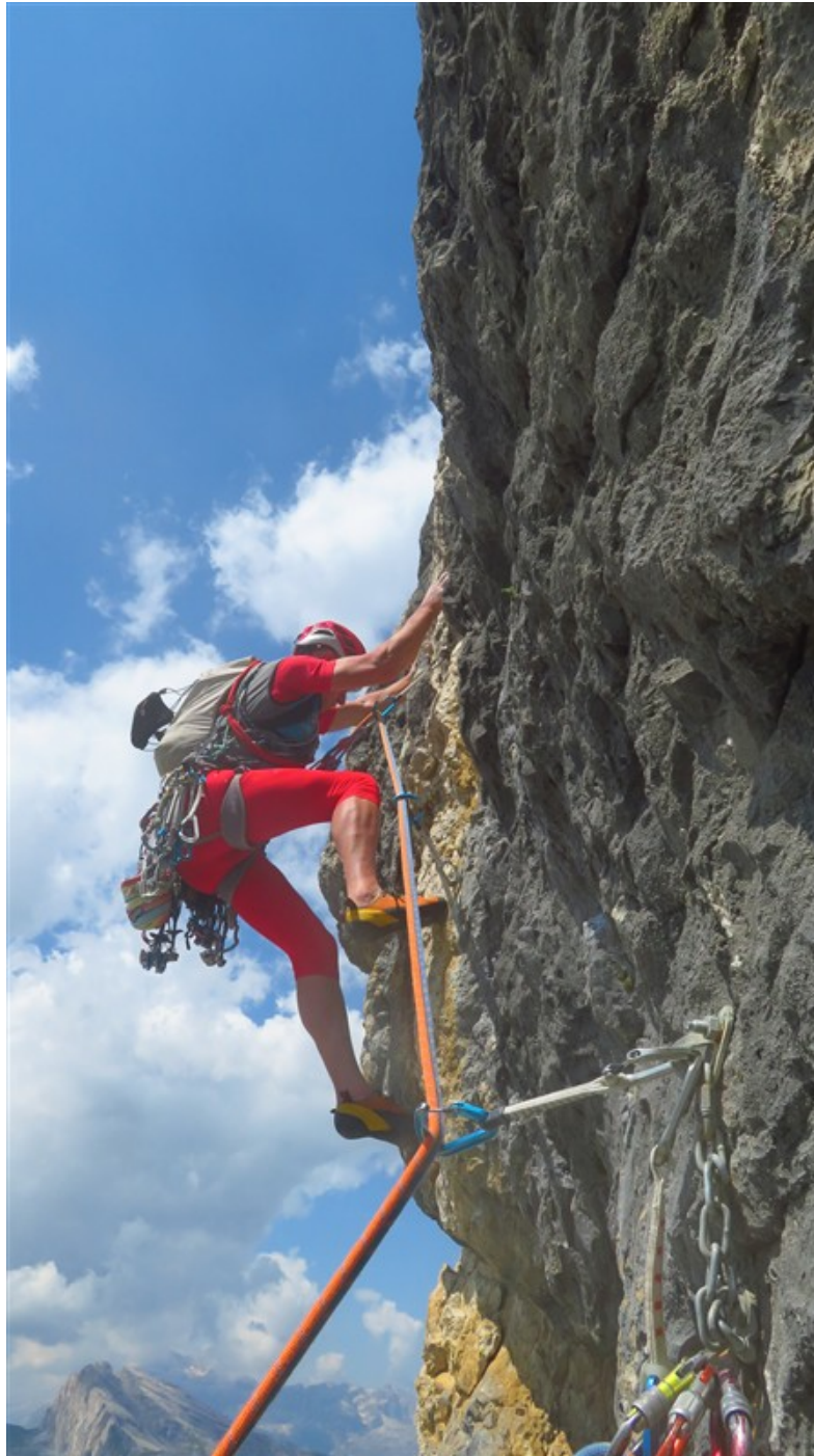
Partenza sesta lunghezza