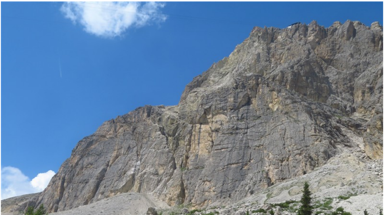
In primo piano le pareti del Piccolo Lagazuoi