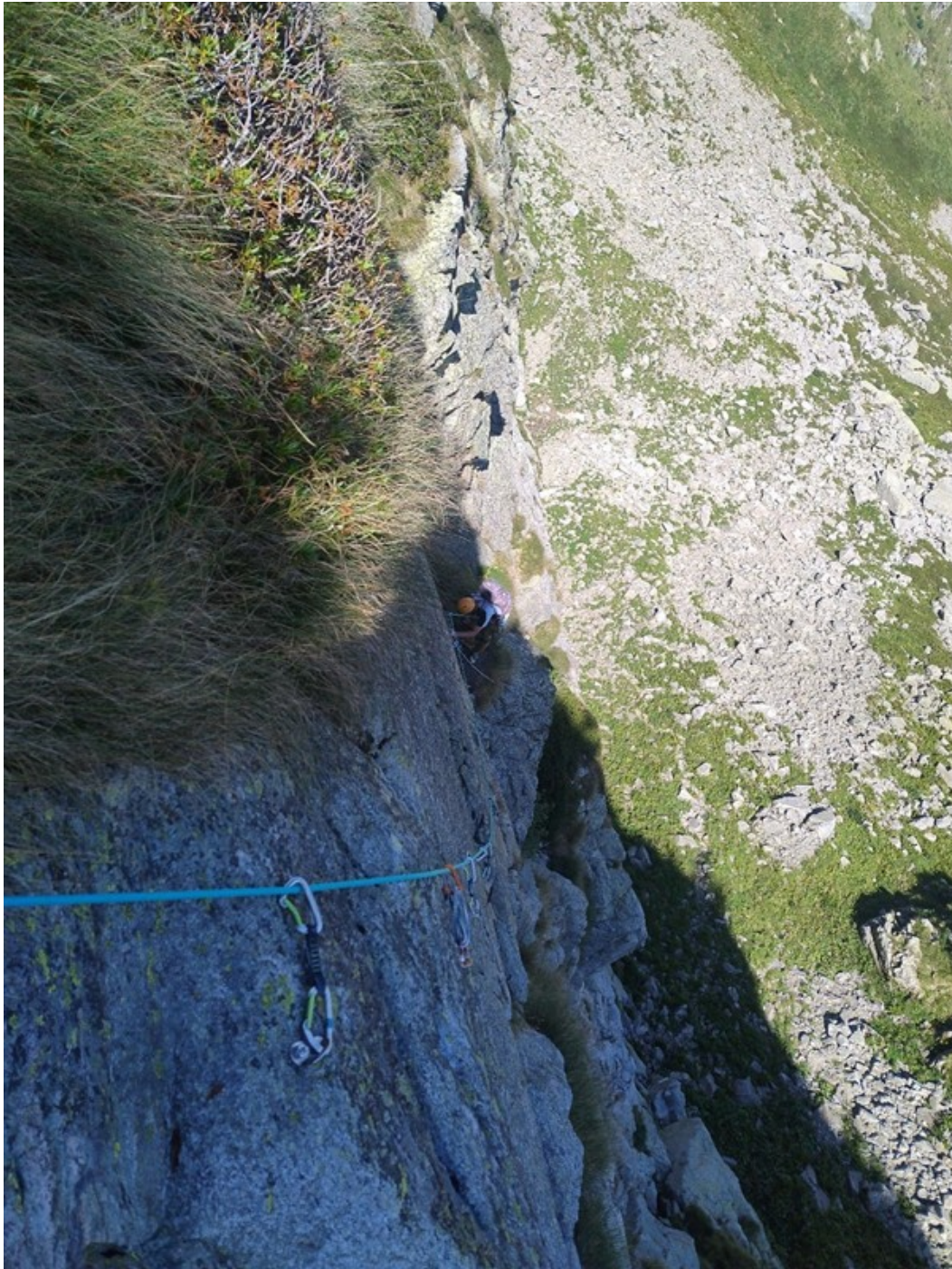
L5, tiro molto bello e protezioni super!