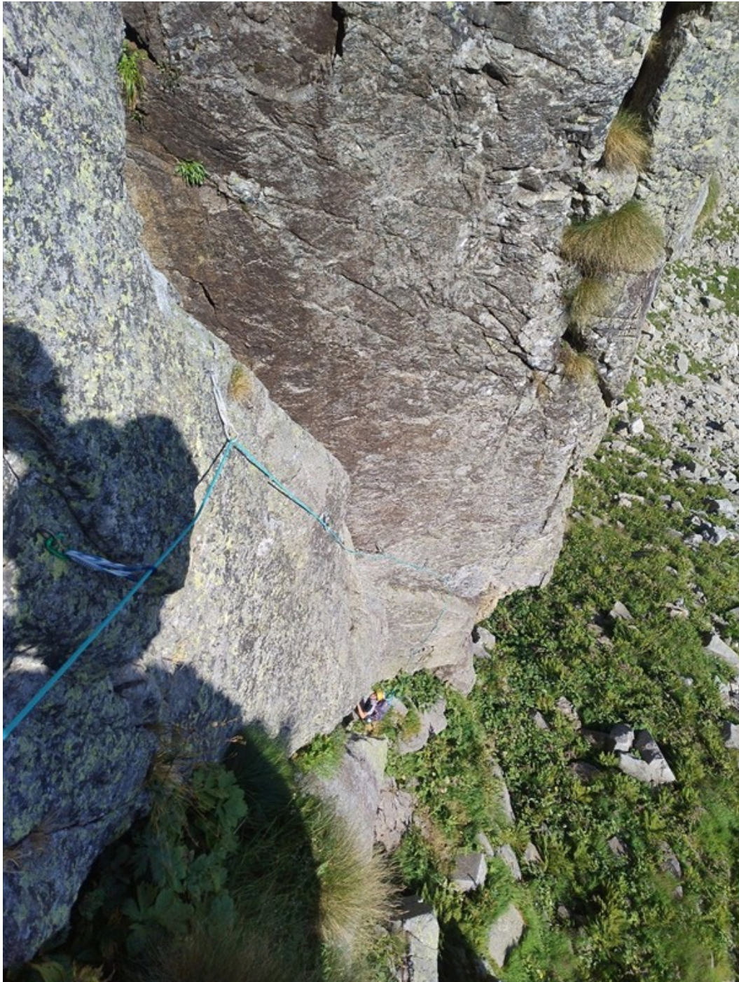
Marco in partenza fotografato dalla S1