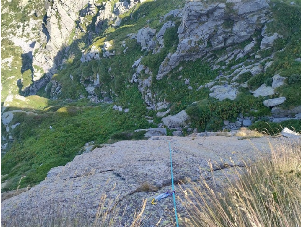
Placca delicata al termine di L10