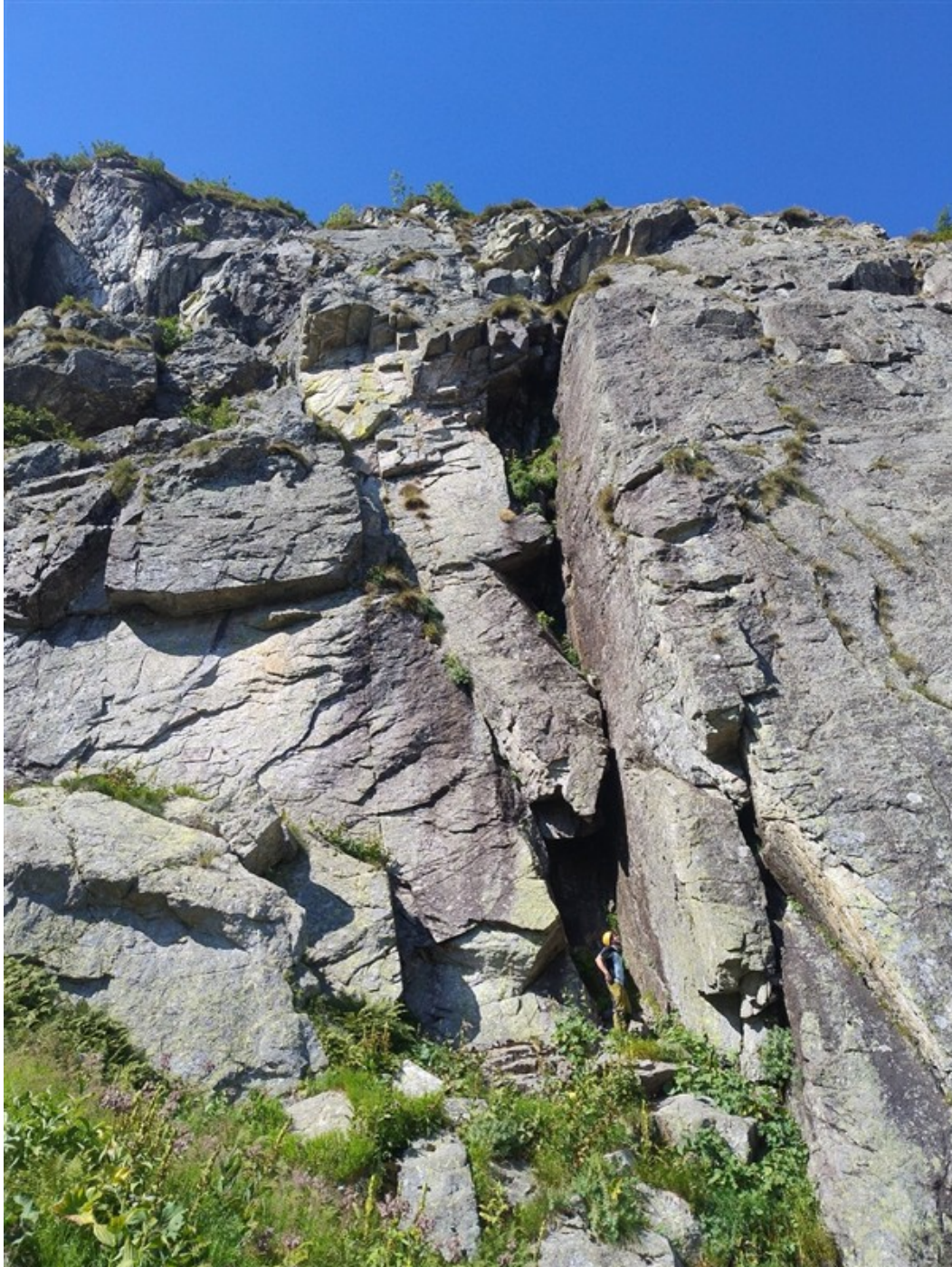
Marco di fronte al muro su cui attacca la via