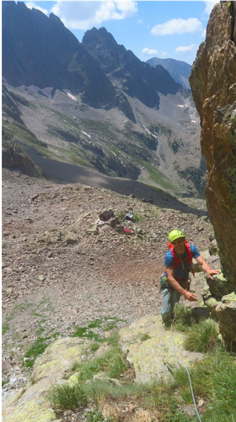
Uscita prima lunghezza