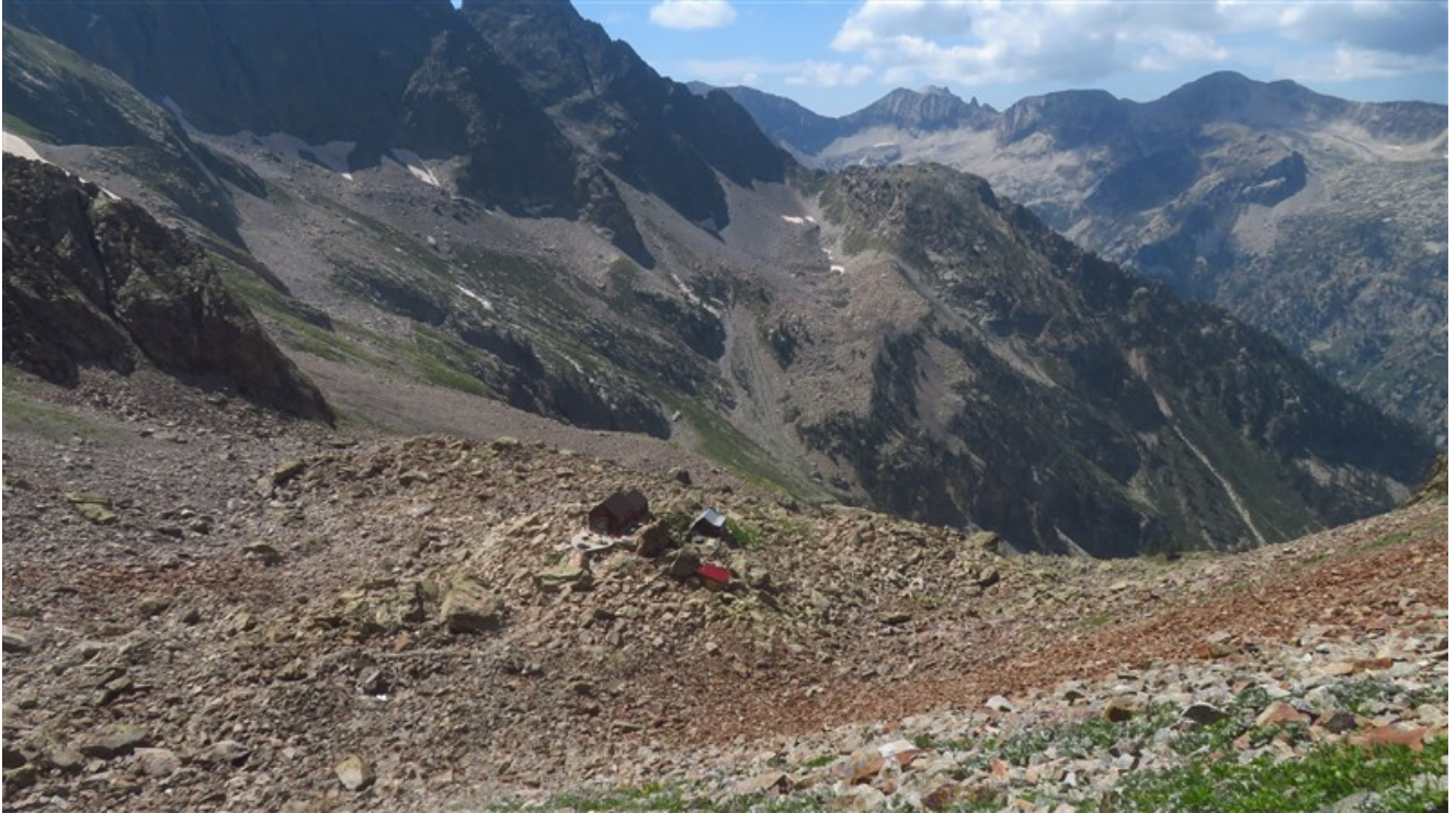
Il rifugio Bozano visto dalla via