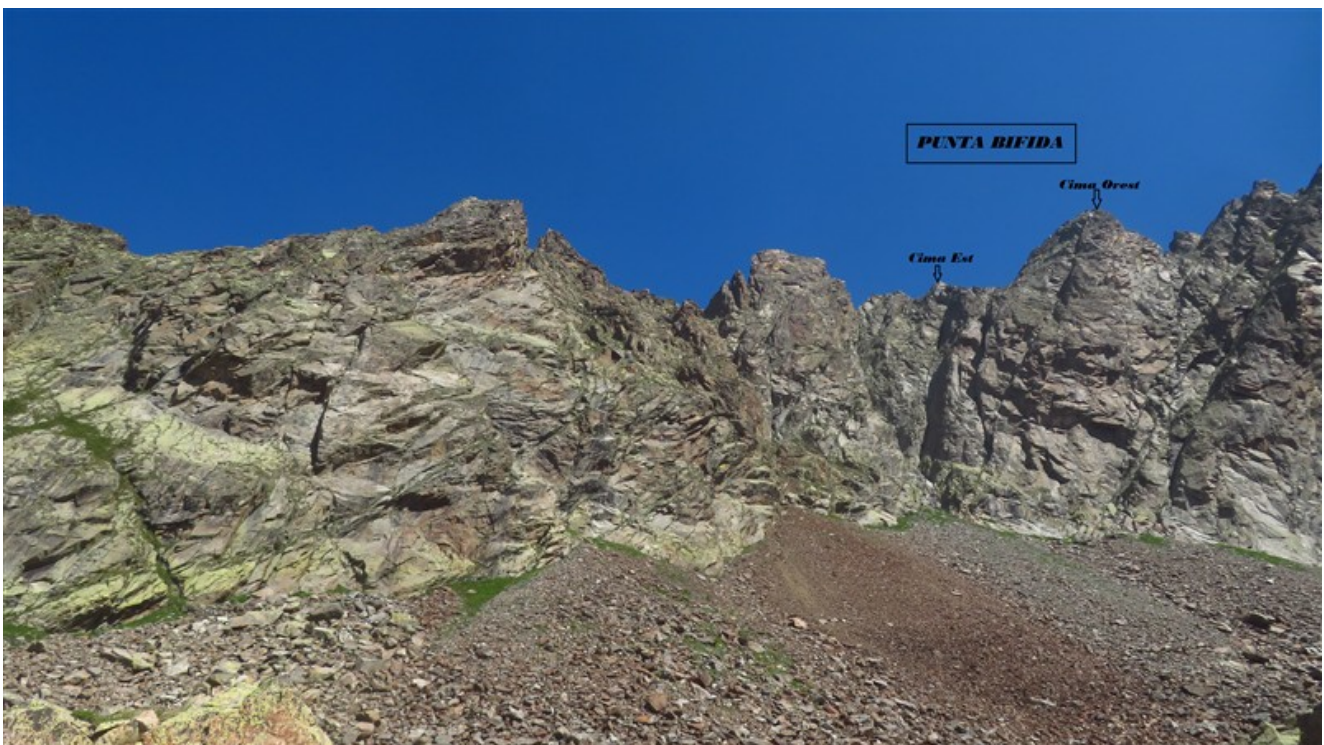
Catena delle Guide