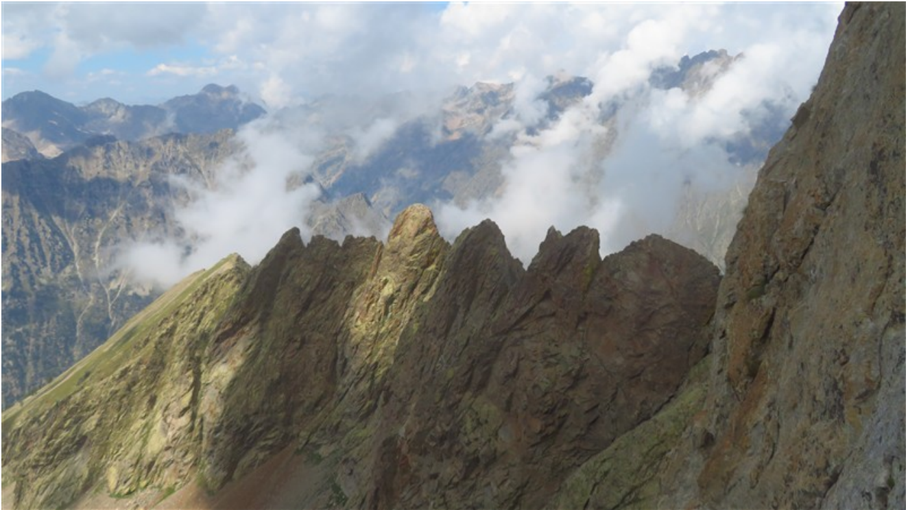
Catena delle Guide