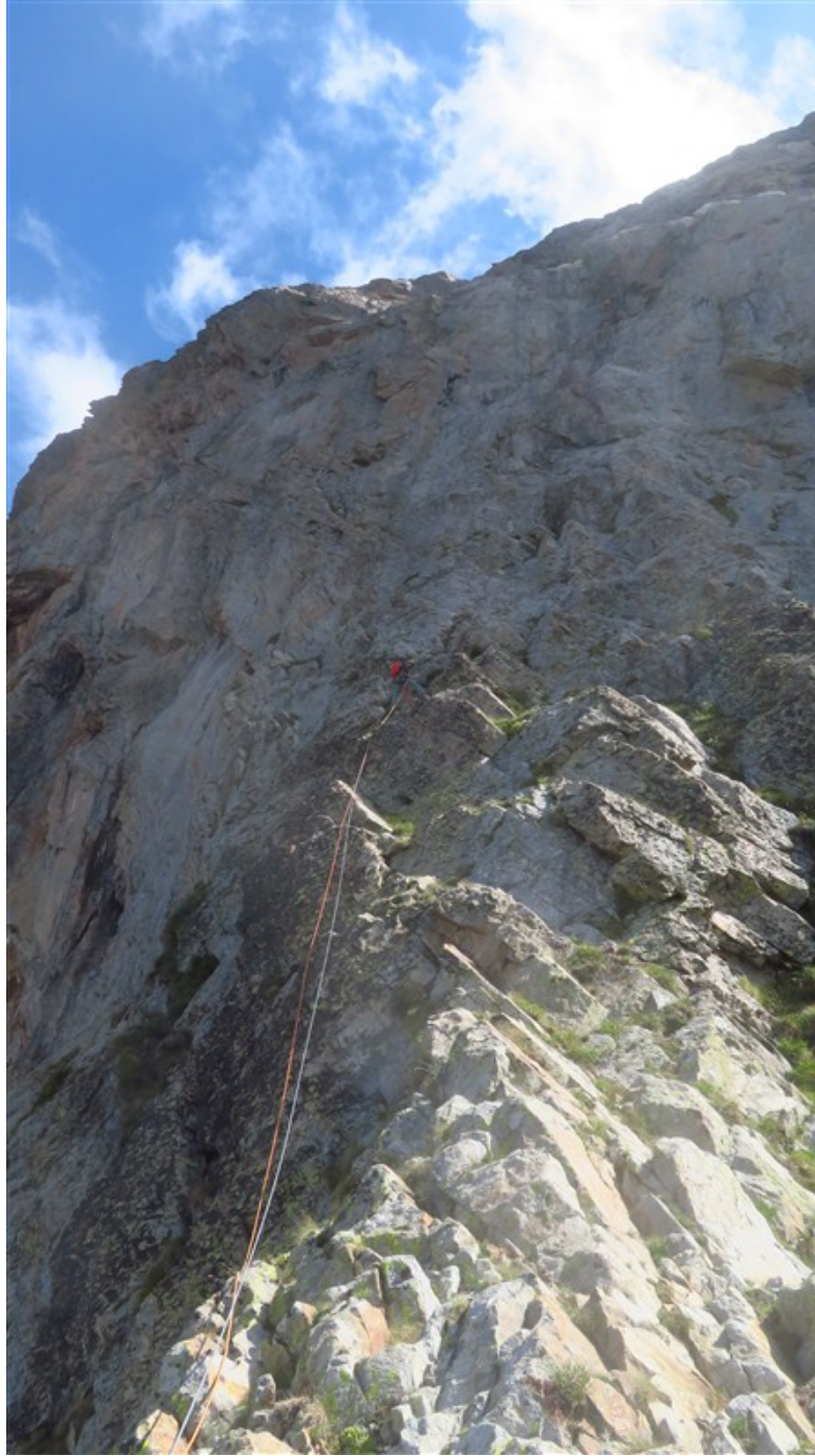
Salendo sullo sperone iniziale della via Campia